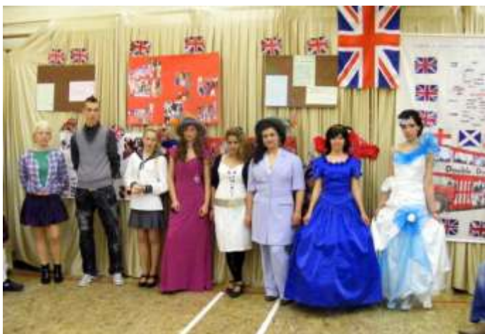
Így mutatták be Nagy Britannia (fent) és Olaszország (lent) viseleteit.

Mind a projekthét, mind a nyílt nap új élményekkel, új kompetenciákkal gyarapította tanulóinkat.