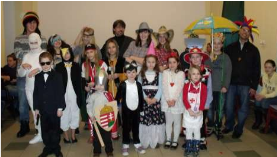
Balassagyarmat - Farsang az oratóriumban.

gondolatai, valamint a szalézi jelöltek "jóreggeltjei" és "jőéjszakájai" pedig tovább színesítették a lelki programot. Köszönjük mindenkinek, hogy emlékezetessé tette számunkra ezt a hétvégét. Bízunk benne, hogy az itt szerzett tapasztalatok, lelki élmények és elhatározások segítenek bennünket abban, hogy meg-lássuk és kövessük Istenünk hívását életünk kisebb és nagyobb döntéseiben egyaránt.