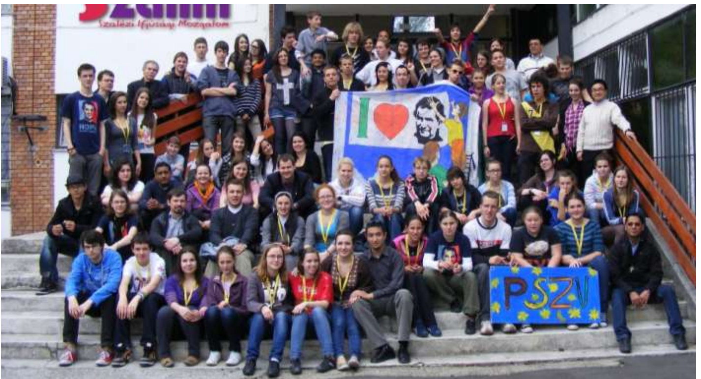
Kazincbarcika - A PSZV résztvevői a Szalézi Szent Ferenc Gimnázium előtt.

Ezúton is szeretném megköszönni a kedves és lelkes fogadtatást a Szalézi Szent Ferenc Gimnázium minden dolgozójának és tanárának, illetve a helyi fiatalok elő-