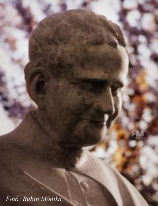
Fotó: Rubin Mónika