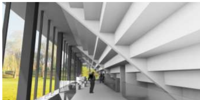
Előcsarnok (terv STÚDIÓ 100 Kft)

főépület emeleti szintjén egy összenyitható, több, mint 300 négyzetméteres nagy közösségi terem áll majd rendelkezésre, ami akár lakodalmak megrendezésére is alkalmas lehet. Tehát valóban egy közösségi helyet szeretnénk létrehozni a városban, amely elsősorban az ifjúság érdekeit fogja szolgálni.