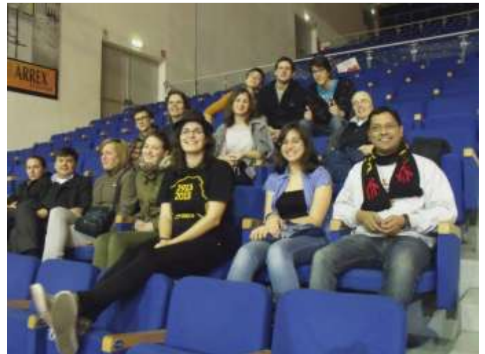
Különböző helyekről jövő animátorokból álló csapat ötletszerzés céljából ellátogatott a jesolói fesztiválra.

Mindannyiunk nevében elmondhatom, hogy nagyon hasznos tapasztalat volt, hogy ellátogattunk erre az ünnepre, így rengeteg energiával feltöltődve készülhetünk a Szalézi Part Fesztiválra. És igen, láttuk és elhittük.