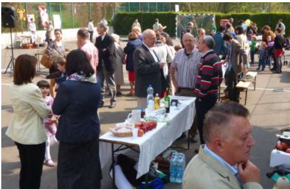
Óbuda — Közösségi Fórumot tartottak virágvasárnap