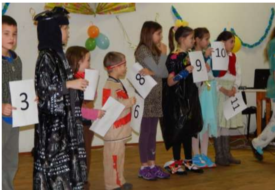
Újpest-Megyer – Farsang az oratoristákkal

Egyházközségi farsang – Kis és nagy gyerekek, ifjak és idősek, szórakoztak együtt, február 22-én délután az idei farsangon. A szervezők igyekeztek minden korosztály számára programmal kedveskedni. Mint szalézi plébánia azonban mégis arra tevődött elsődlegesen a hangsúly, hogy bevonjuk a fiatalokat és a gyerekeket az ünneplésbe. A bált, mindannyiunk öröme, Havasi atya üdvözlő szavai nyitották meg. Örültünk annak, hogy együtt szórakozhatunk, és azok is benéztek a bálba, akik nem tudtak hosz-