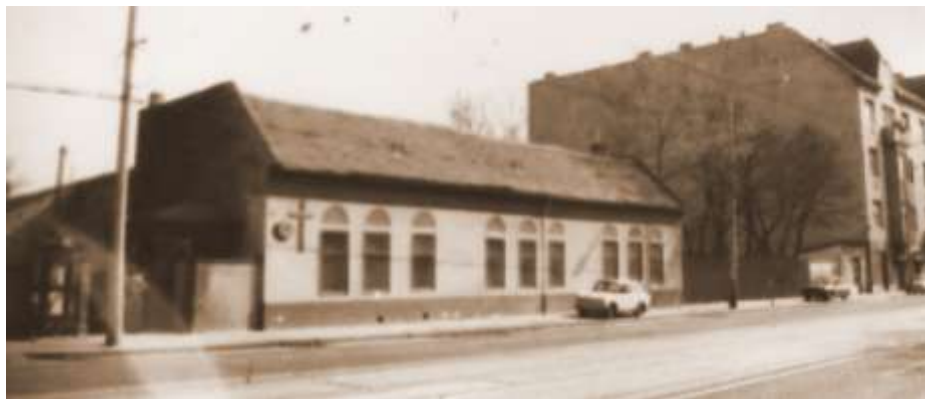
A régi Bécsi úti kápolna, amelyet 1992-ben lebontottak. A kápolna és a Szent Alajos Ház hosszú udvarai egymással találkoztak, így a Bécsi útról a kápolnába menekülő zsidó üldözötteket sötétedés után átkísérték a Kiscelli utcára néző Szent Alajos Házba, ahonnan napközben többen elmenekülhettek. Akik maradtak, a padláson bújtak meg, de ha ottlétüket a szomszédok észrevették, könnyen besúghatták a nyilasoknak.

- Hála Istennek, ez ma már csak a múlt! - írja Havasi József atya a Kiss Mihálynak emléket állító könyvecske utószavában. - A múltat azonban nem szabad elfelednünk, hiszen így megakadályozhatjuk azt, hogy megismétlődjének ezek az események. Meg kell őket ismertetnünk a mai kor fiatalságával, nehogy visszatérjenek ezek a veszélyes idők.