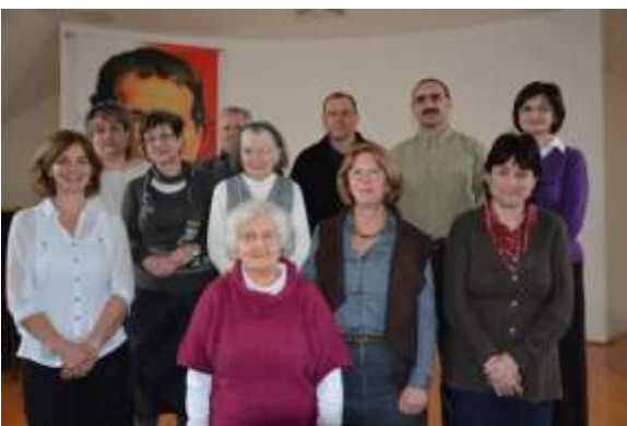
A szalézi munkatársak tanácsa

Életünket itthon, helyi csoportjainkban kell élni, együtt a szerzetesekkel. Ehhez nyújt segítséget, hogy lefordítottuk, megjelentettük az Apostoli Élet Szabályzatának legfrissebb változatát, mindenki tudhatja, mihez kell tartania magát. Sok új ígérettétel és ígéret-megújítás is történt. Gyönyörű tanúságtételeket olvashattunk, tagjaink hétköznapi áldozatokkal teli szolgálattal telnek, függetlenül attól, hogy ki hány éves.