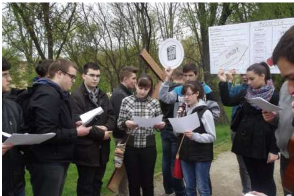
Kazincbarcika – Keresztút szeretet-jogosítványért

koztak - meséltek munkájukról, a hazájukban zajló szalézi életről; bemutatták hazájuk (Lengyelország, Vietnam) nevezetességeit.