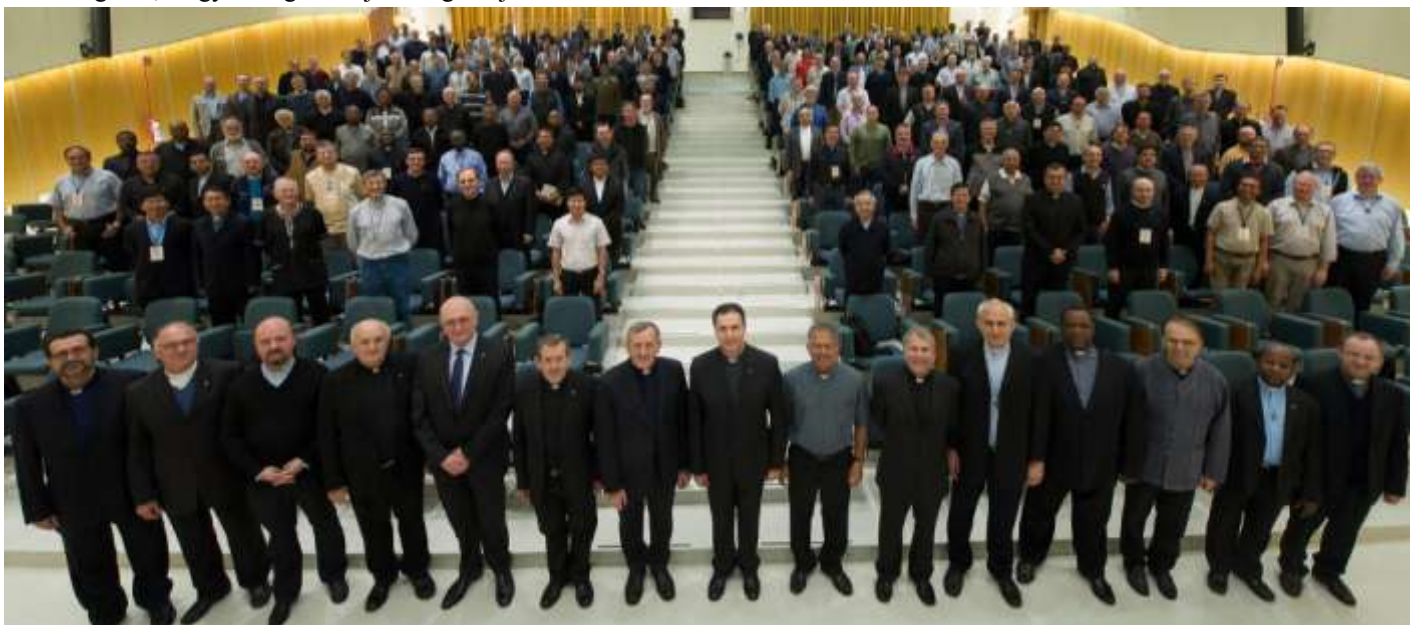
A 27. Egyetemes Káptalan résztvevői, előtérben az Egyetemes Tanács tagjai, középen a rendfőnökkel.

Don Bosco Szalézi Társasága 27. Egyetemes Káptalanja április 12-én ért véget. „A kegyelem és a Szentlélek egyidejű jelenlétének időszaka volt ez” - mondta Ángel Fernández Artime, Don Bosco tizedik utóda záró beszédében a káptalan több mint 200 tagja előtt.