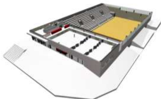
Alaprajz—emelet (terv STÚDIÓ 100 Kft)

A város lakosai is használhatják majd a sportcsarnokot, annak rendje és módja szerint. Nem egy zárt létesítmény lesz, nem is csak a két iskola létesítménye, bár a délelőtti időszakban ők fogják használni, délután és este pedig szeretnénk csapatoknak, egyesületeknek, közösségeknek szervezeten biztosítani lehetőséget a sportolásra. Maga a sportcsarnok kiegészítő helyszíneket is kap, ennek is a sport áll a középpontjában. Lesz két falabda pálya, bowling pályák, csocsó, biliárd, darts, lehetőség beszélgetésre, együttlétre, aerobikos fitness terem, illetve a