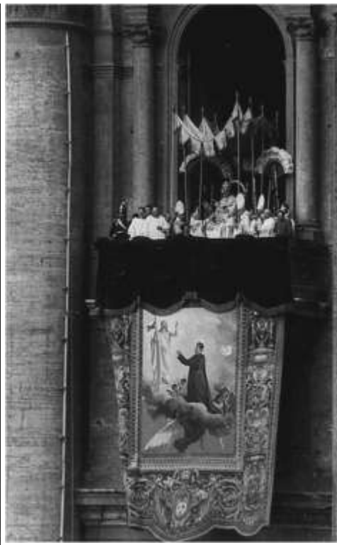
Eredeti archív felvételek Don Bosco szentté avatásáról