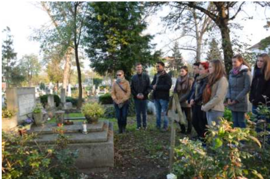
A nyergesújfalui animátorok meglátogatták a szalézi sírokat a környéken.