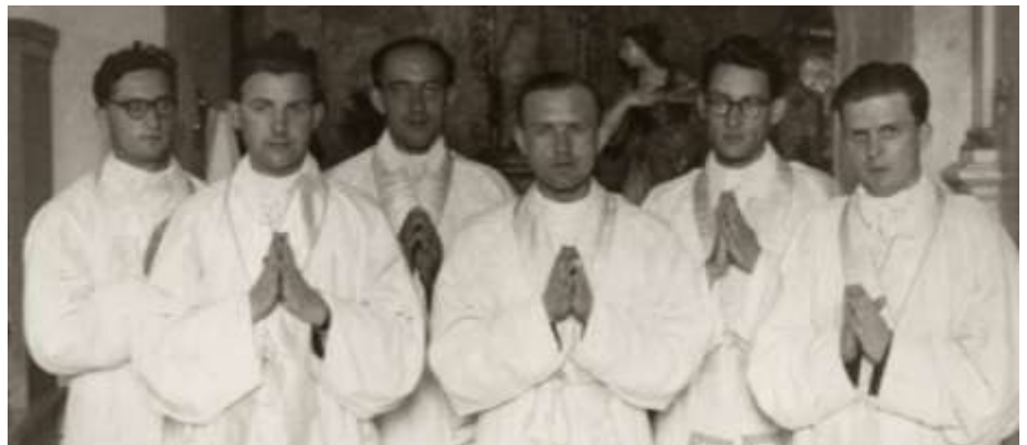
Hatszoros primícia 1958-ban: