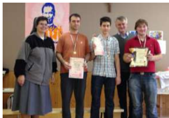
Mogyoród—A bajnokság győztesei