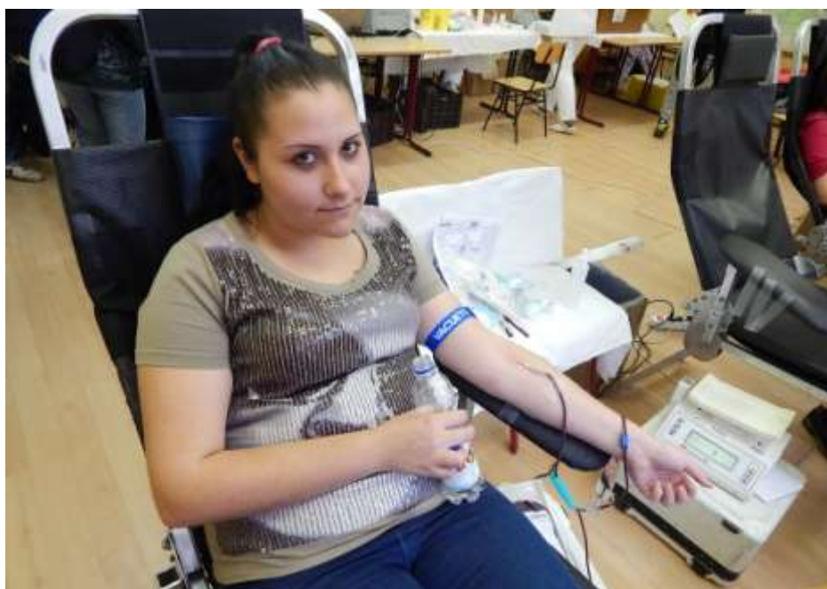
Kazinbarcika — Egészségét a Don Bosco Szakiskolában.