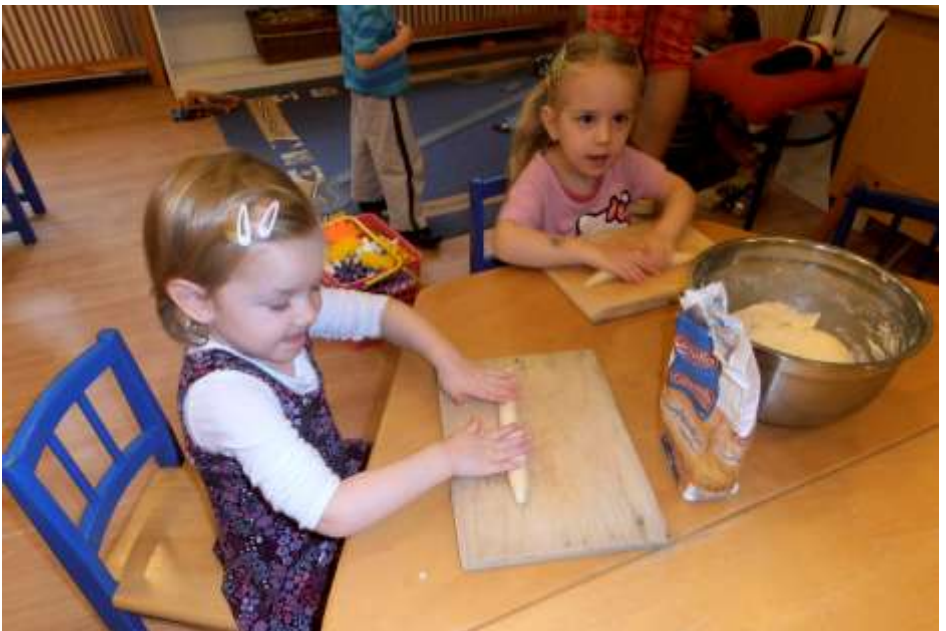
Óbuda—Készül a Márton-napi perac az óvodában

Minden csoportban a gyerekek peracet is sütöttek Márton napjára. A nagycsoportosok délelőtt az óvodában a közös áhítaton előadták a gyerekeknek a Szent Márton életéről szóló műsorukat. Csodaszép