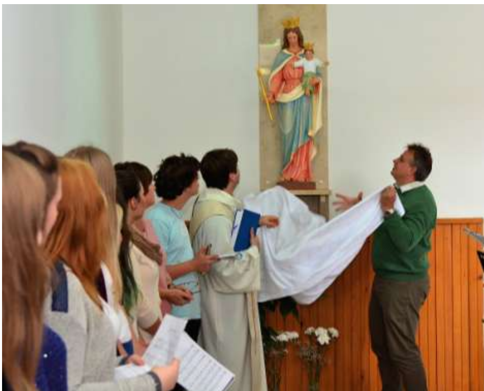
Kazincbarcika—Segítő Szűz Mária szobor a Szalézi Szent Ferenc Gimnáziumban..