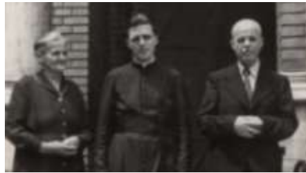
Szüleivel az újmise után.

1948. augusztus 17-én kezdtük a noviciátust és pont egy évvel később tettük le az első fogadalmat. Utána következett Mezőnyárad. Elvégeztük azt is, de nem volt államilag érvényes bizonyítványunk, és 1950-ben, amikor befejeztük az évet június 13-án, elküldtek minket haza, hogy