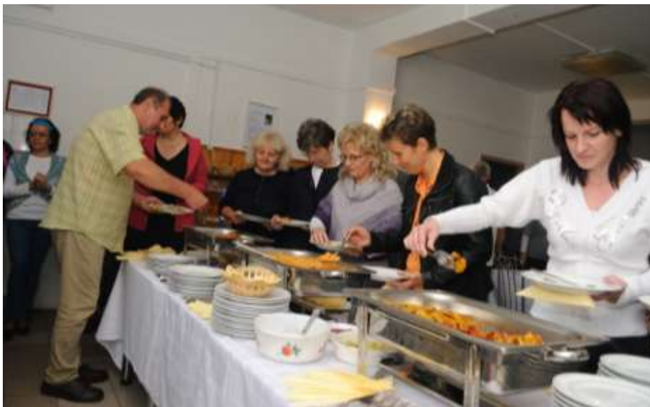
Kazincbarcika—Indiai teaház a Szalézi Szent Ferenc Gimnáziumban.