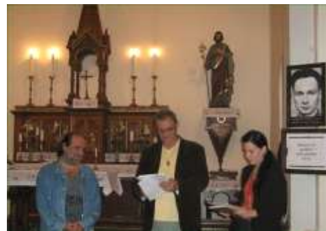
Clarisseum—Nyitott Templomok Éjszakája

Nyitott Templomok Éjszakája az újpesti Clarisseumban – 2014. szeptember 20-án, az Ars Sacra Fesztivál keretében 16 órakor megnyitottuk a Clarisseum kapuját a látogatók előtt.