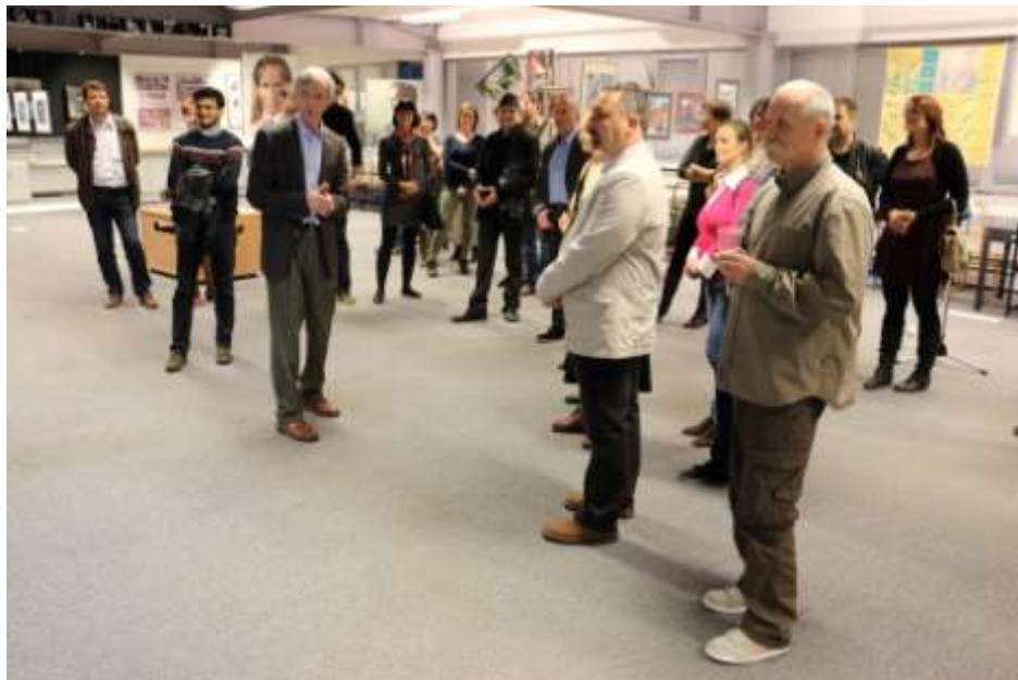
A budapesti SZÁMALK-Szalézi Szakközépiskola művésztanárainak kiállítása

„Fiatalokkal a fiatalokért” – Ezzel a gondolattal indítottuk a SZÁMALK-Szalézi Szakközépiskola második szalézi tanévét. Ebben a tanévben számos programot tervezünk a Don Bosco bicentenáriumra. Programjaink közül érdemes kiemelni a „Margit mama műhelyek” indítását, amelyeket a pedagógiai- és családsegítő munkatárs és a dekoratőr szakos csoportjaink alkotnak. Különböző ajándékokat fognak készíteni, amelyeket karácsonyra a rászoruló családoknak illetve a szalézi óvodának ajándékozunk. November 27-én és december 4-én délután 15 órakor adventi gyertyagyújtást