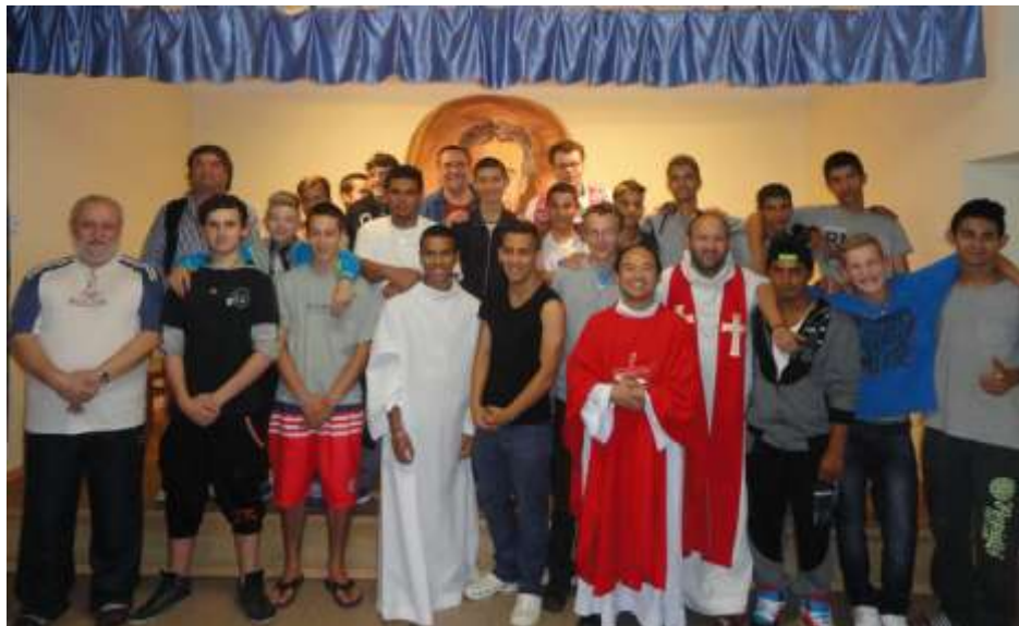
Kazinbarcika—Születésnapot ünnepeltek a kollégiumban