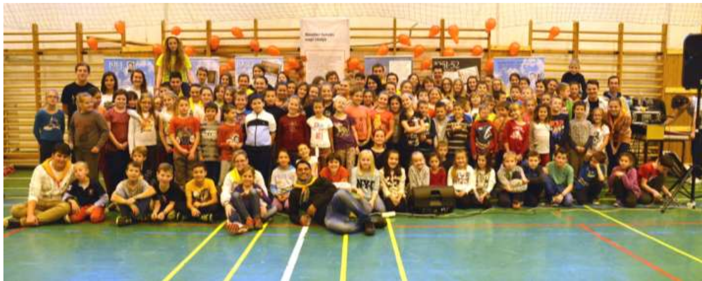
Nyergesújfalu—Az őszi játéknapp résztvevői