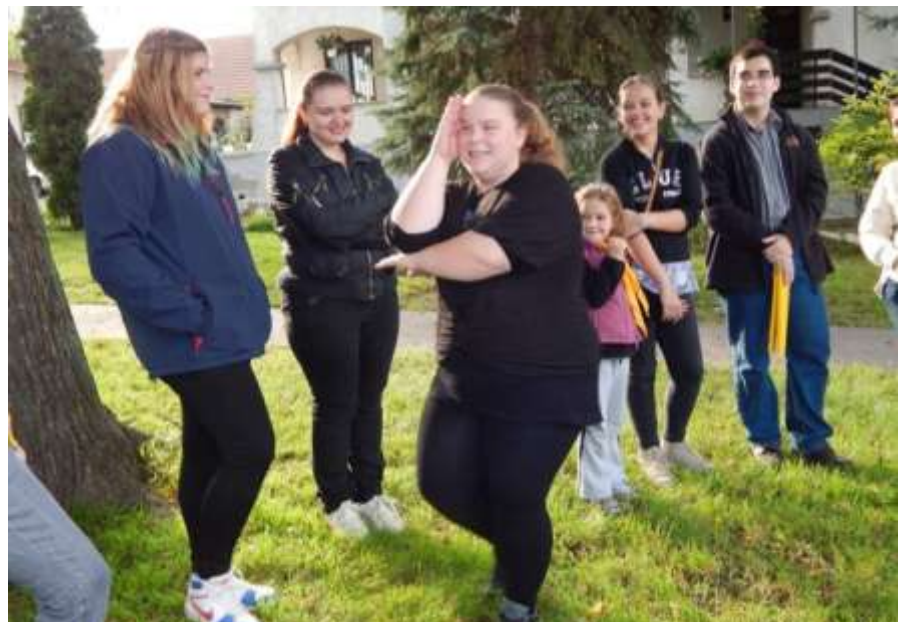
Kazincbarcika— „Bubis” játéknapp