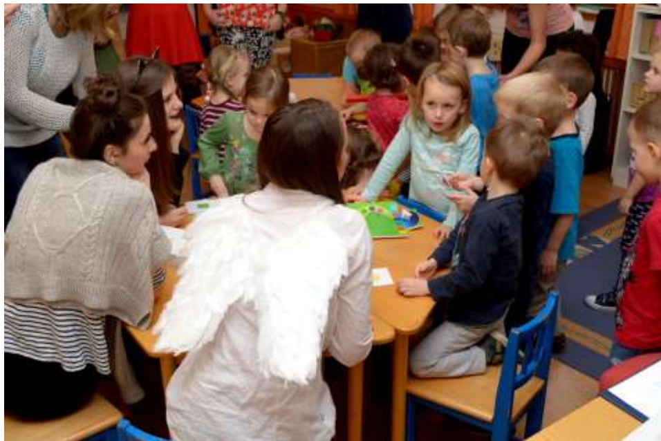
SZÁMALK-Szalézi SzKI – Látogatás az óvodában

Szerda este, rövid játék után egy egészen különleges élményben volt részünk. Egy frissen végzett csillagász jött hozzánk és egy roppant izgalmas témáról beszélt nekünk. „Mi volt a betlehemi csillag?” És szinte teljesen konkrét választ kaptunk a végére. A megoldás nem szupernóva robbanás vagy üstökös volt, hanem a Jupiter és a Szaturnusz bolygók együttállása, és az amúgy is ritka jelenséget még más csillagászati események kísérték. Az előadás után még kimentünk a szabad ég alá, és bolyongtunk még egy kicsit a csillagképek erdejében.