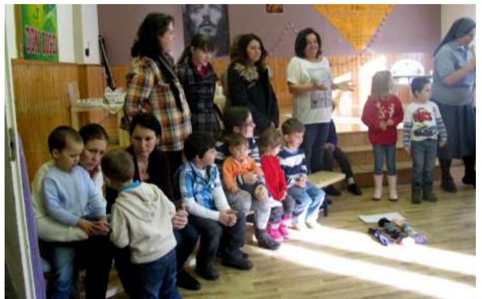
Mogyoród – Laura Vicuña ünnepe