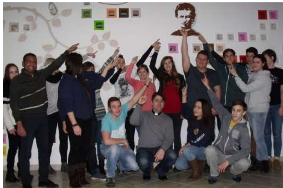
Kazincbarcika, Szalézi Szent Ferenc Gimnázium – Újraszínezzve

akik idén is megfogadták: utoljára vágjanak bele ilyen embert próbálóan nagy feladatba. A bál nyitóműsorát az Ifjúsági Ének- és Zenekar adta Tompa István vezetésével. Az ízletes vacsora után pedig jött a tánc, szinte mindig tele volt a parkett.