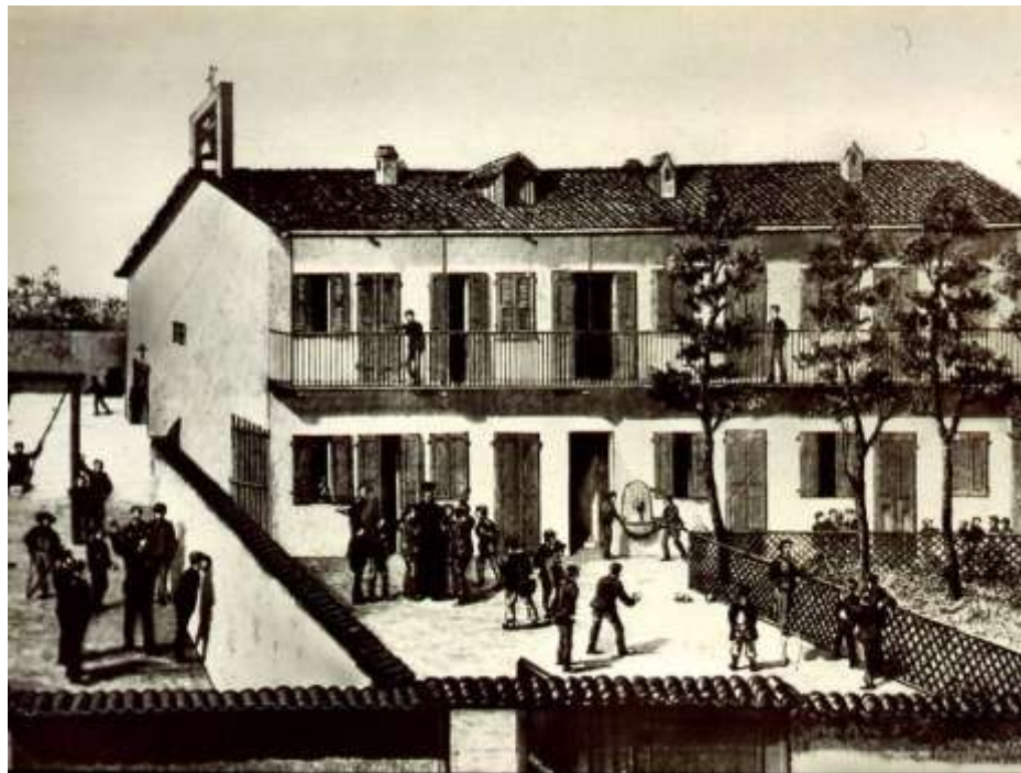
A kápolna bejárata az épület bal oldalán, hátul volt található