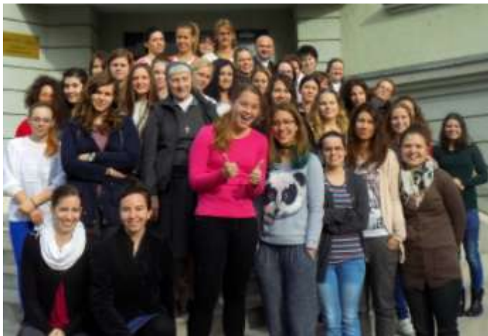
Eger – Lelkigyakorlatos kollégisták