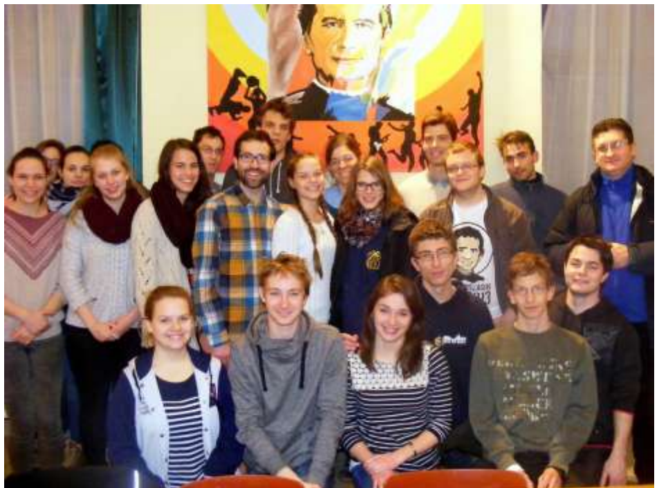
Az óbudai animátorok egy hétvégét töltöttek Balassagyarmaton