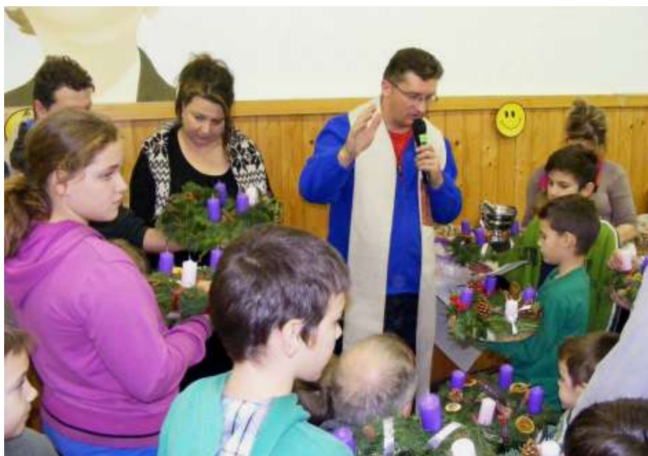
Óbuda – Adventi koszorúk megáldása

Végül 50 db koszorúalap beszerzésére szavaztunk. Kora délutánra megérkeztek az érdeklődő vendégek is, akik hamar feltalálták magukat és pillanatok alatt belemerültek a nagy munkába. Sorban készültek a szebbnél-szebb adventi koszorúk. Nagyon jó hangulatban telt a délután. Az óvodáskorúaktól egészen az idősebb testvérekig minden generáció jelen volt és kipróbálta kreativitását, ügyességét. Többen most készítették először koszorút. A koszorúk és ajtódísz alkotások mellett falatozni, teázgatni és beszélgetni is volt lehetőség, ami igen családiassá tette a készüléket. A lelkes animátorok a gyerekeknek több tepsi mézeskalácsot sütöttek, és a kisült formákat már együtt díszítették ki. Ezen kívül kézművességre is volt lehetőség. Robert atya időről időre megáldotta az elkészült adventi koszorúkat, hogy azok majd ott-