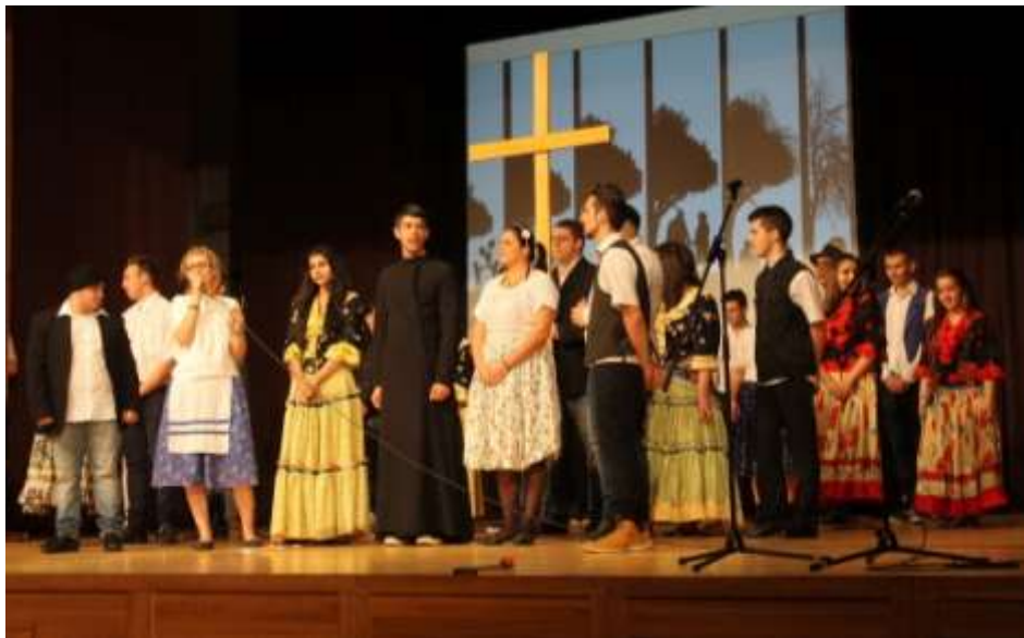
Kazincbarcika – A Don Bosco Középiskola ünnepi műsorából

A megemlékezést az Egressy Béni Művelődési Ház színháztermében folytattuk. Egy nagyon vidám és sok-sok lelket melegengető műsorszámmal teli „Ki-mit-tud?”-ot, a Szalézi Gálát tekinthették meg az iskola tanulói, tanárai és az eseményeken megjelent díszvendégek. Minden évben nagy izgalommal várjuk ezt a show-t, amelyet rengeteg felkészülés, próba és szervezés előz meg. Mind a szervezők, mind a fellépők remekeltek az idén. A megszokott, már-már hagyományosnak nevezhető műsorszámok mellett idén sok váratlan meglepetést is sikerült