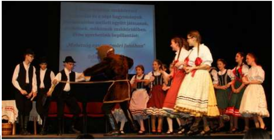
Óbuda – A Péter-Pál Iskola Don Bosco Gálája