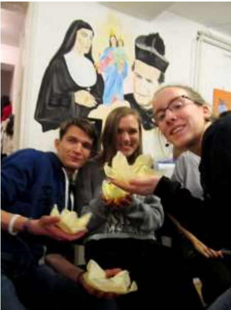
Pesthidegkút – Előszilveszter