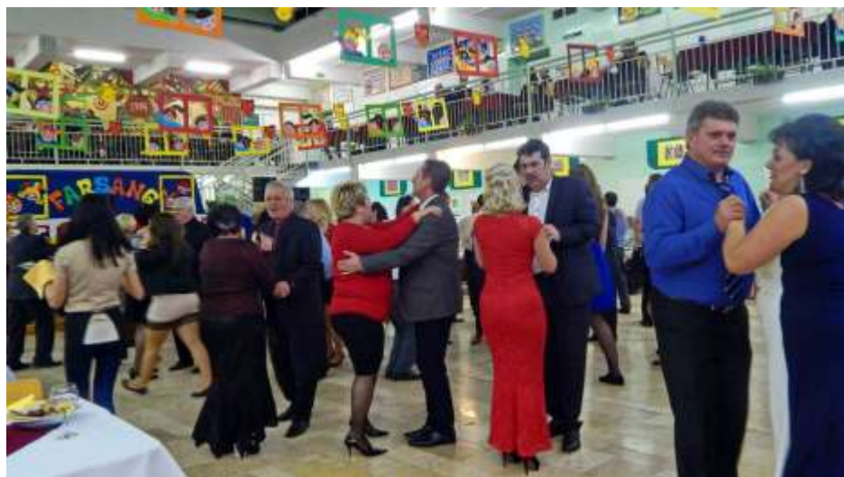
Kazincbarcika – Huszadik katolikus bál