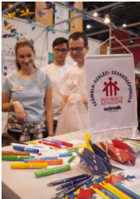
A SZÁMALK-Szalézi SZKI standja az idei Educatio kiállításon

Az ünnepség Quadros Lytton atya vetítéssel egybekötött előadásával és a fiatalok közös énekével kezdődött, majd a programok legvégén azzal is fejeződött be, így adva keretet az ünnepnek.