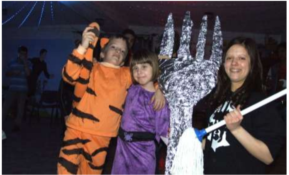
Pesthidegkút – Farsang az oratóriumban