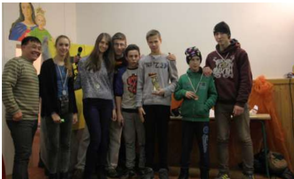
Óbuda – Csocsóbajnokság

honainkban világítsanak a hit, remény, szeretet és az öröm lángjaival, és vezessenek az úton Karácsony ünnepe felé. Este meglepődöttséggel konstatáltuk, hogy mind az ötven koszorú gazdára talált!