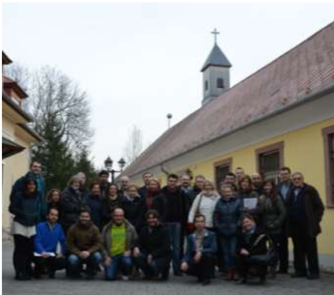
A nemzetközi találkozó résztvevői a magyar házigazdával