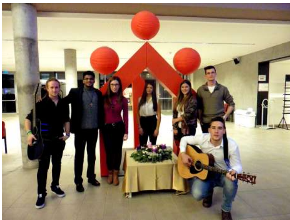
META-Don Bosco SZKI – Adventi gyertyagyűjtés

A műsort idén is Lytton atya szervezte, akinek a tavalyinál népesebb zenész csapatot sikerült maga köré gyűjteni. Már hetekkel korábban megkezdték a próbákat. Délután és este kellemes dallamok szűrődtek ki a szalézi szobából, így biz-