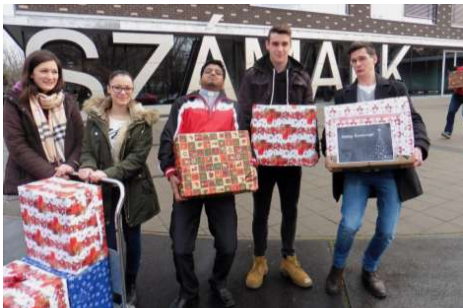
Pakolják a kazinbarcikai családok számára gyűjtött karácsonyi csomagokat