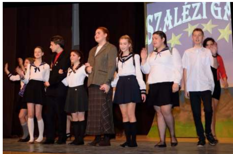
Kazincbarcika – A Szalézi Szent Ferenc Gimnázium Szalézi Gálájáról

Don Bosco Középiskola Névadójukat ünnepelték a Don Boscó-sok – A kazincbarcikai Don Bosco Általános Iskola, Szakiskola, Középiskola és Kollégium 2016. január 29-én tartotta névadója égi születésének ünnepét, szentmisével, ünnepi műsorral, jutalmazással és vendégfogadással. A rendezvény szentmisével kezdődött a Szent Család-templomban, ahová meghí-