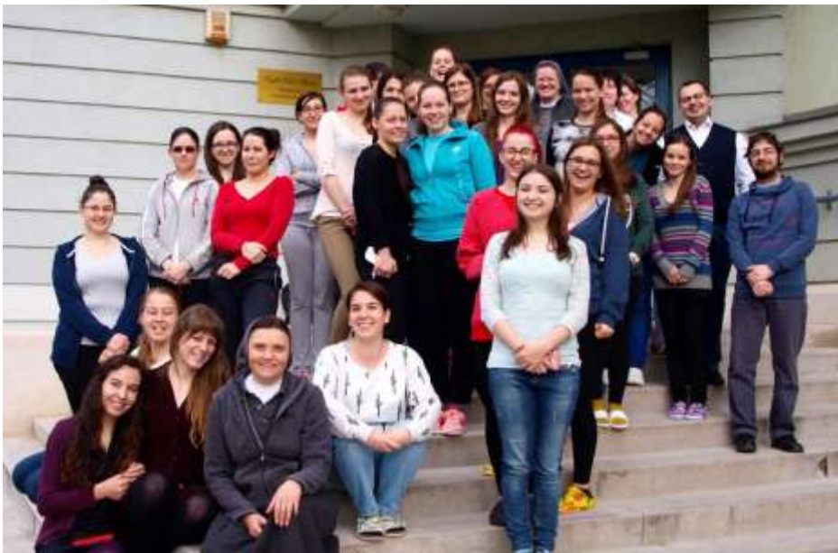
Eger – Élet GPS lelkigyakorlat

hány főbb összetevője a napnak. Ezek az elemek segítenek elmélyíteni a témát, ami Don Bosco vágya körül forog, hogy vigyázzon a fiatalok lelkére.