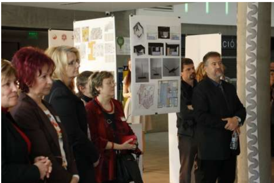
Számalk-Szalézi Szakgimnázium – Lakberendező kiállítás