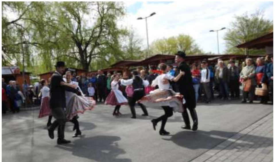
Kazincbarcika – Húsvéti termelői vásár

Országos Mezei Futóverseny – Idén is megrendezték Balassagyarmaton a Katolikus Iskolák Országos Mezei Futóversenyét március 24-én, ahol a Szalézi Szent Ferenc Gimnázium is részt vett korcsoportonként egy-egy csapattal. A rendezvényen összesen 436 futó állt rajt-hoz, és tanulóink ismét szép eredményeket értek el, a dobogó harmadik fokát foglalhatták el V. lány, valamint VI. lány és VI. fiú korcsoportban.