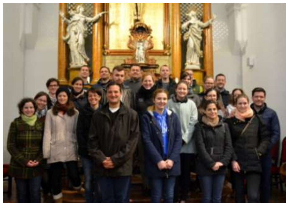
Pélföldszentkereszt – Fiatal felnőttek nagyböjti lelkigyakorlatának résztvevői

Több ügyességi feladatban is kipróbálhatták magukat a tanulók, persze már nem csak hagyományos játékokon, hanem korszerű technikát alkalmazva. Volt rekesztorony építés és triciklizés, de kipróbálhatták magukat íjászatban is. Elő-