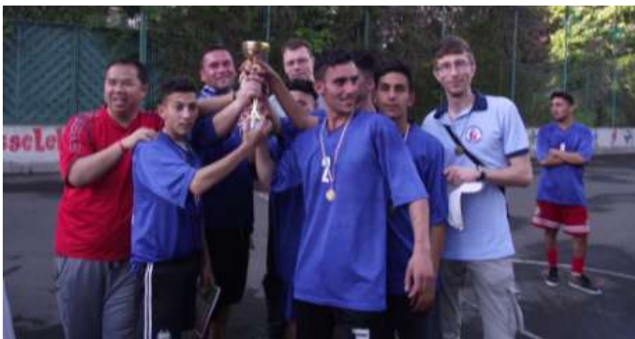
Óbuda – A Savio Focikupa felnőtt győztesei, a kazincbarcikai Don Boscó-sok

gott a nap! A gyerekek tornáján négy csapat indult, köztük oratóriumunk foci-csapatai (SCO I és SCO II), egy vegyes oratóriumi csapat (UFC), illetve a Zápor utcai iskola csapata. Míg a kis focisták a pályán játszottak, a többi gyerek számára állomásos játékokkal készültünk. Többfajta feladat is megjelent, mint például az ügyességi akadályverseny vagy a „pufi” evés időre.