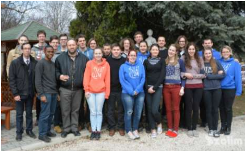
Péliföldszentkereszt – Ifjúsági nagyböjti lelkigyakorlat résztvevői