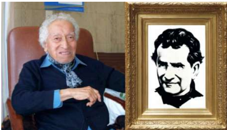
Jorge Mauchi szalézi atya egyik legismertebb művével