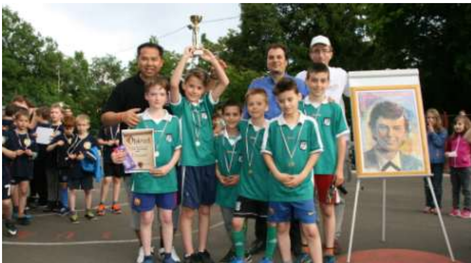
Óbuda – A Savio Focikupa gyermek kategóriájának győztesei, az UFC csapat

Savio focikupa és családi nap – A hagyományos Savio családi napunkat május 12-én tartottuk Óbudán, melyet a Savio focikupával kötöttünk össze. Ezen a pénteki napon a gyerek focistáké volt a főszerep, hiszen ekkor került sor az alsó tagozatosok küzdelmeire. Az időjárással a Jóisten kegyeibe fogadott minket, hiszen az előrejelzés nagy viharokat jósolt, amit az égen gyülekező sötét felhők alá is támasztottak, ám az óbudai szalézi pálya fölött – szinte csodaként – ragyo-