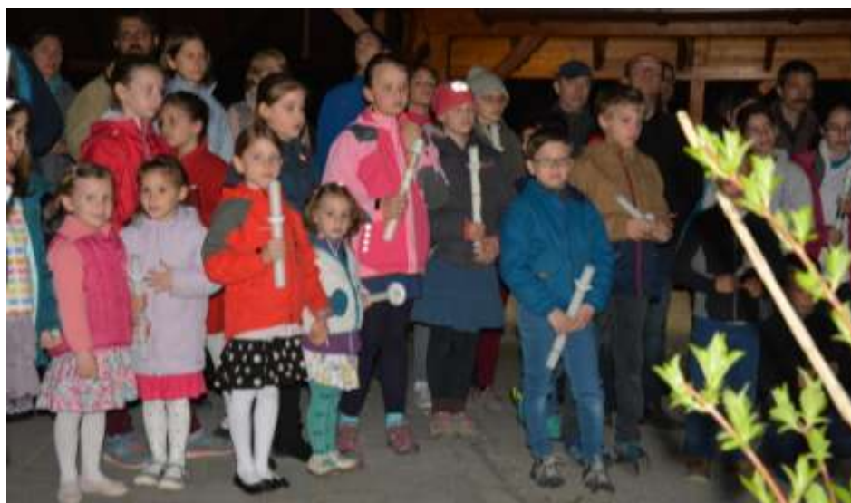
Pélföldszentkereszt – Családos nagyhét résztvevői húsvét vigíliáján