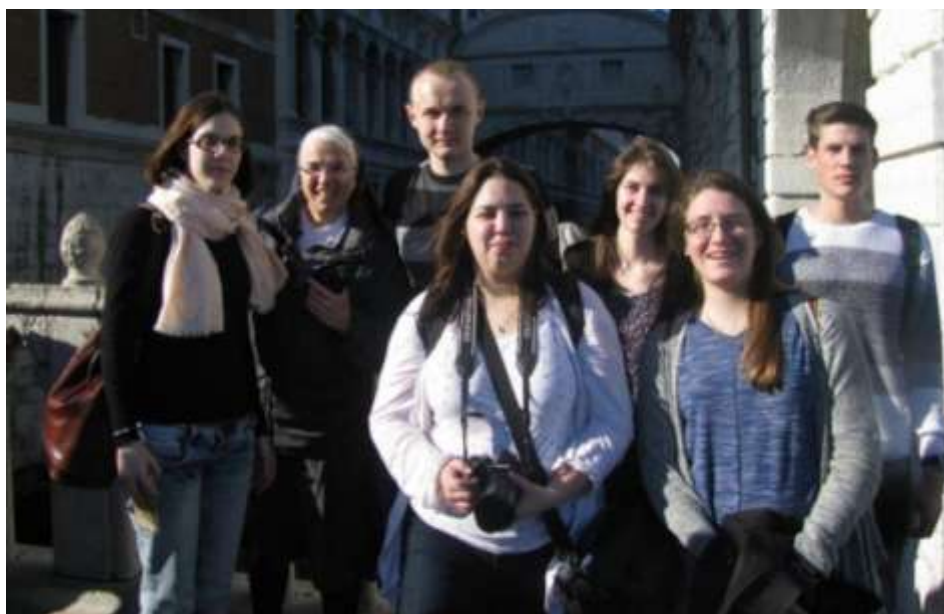
Mogoródi animátorok olaszországi kirándulása

elnevezésű lelkigyakorlatot. A program vezérfonalát a párkapcsolat témája adta, de számos egyéb téma is felmerült. Volt szó megtérésről, tisztaságról, önmagunk és mások szeretetének és tiszteletének fontosságáról, valamint a házasságról és a gyermeknevelésről, mint hivatásról.