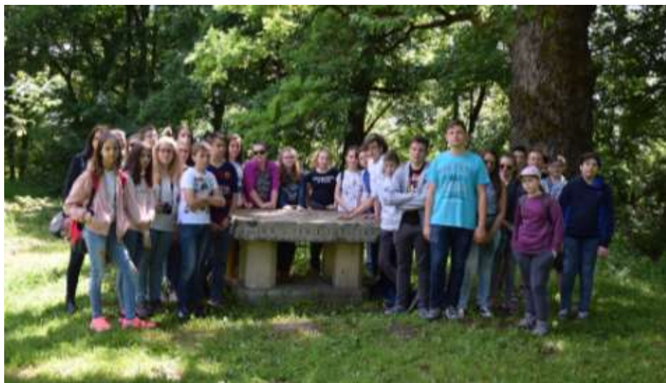
Nyergesújfalu – Határtalanul! Erdélyi körutazáson