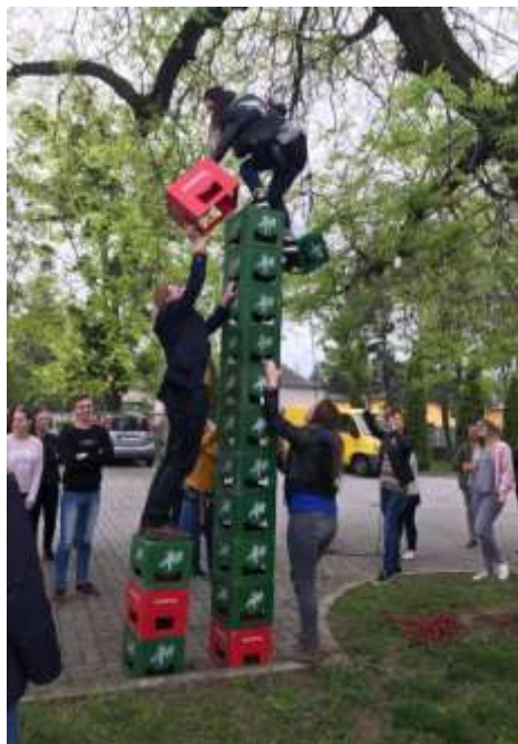
Nyergesújfalu – Diáknap a Zafféryban