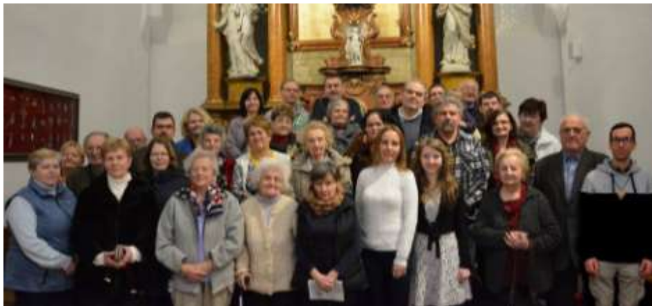
Péliföldszentkereszt – A böjtelői felnőtt lelkigyakorlat résztvevői

Szalézi lelkigyakorlat felnőtt fiataloknak – Idén először „Család vagyunk!” felhívással Péliföldszentkeresztre hívtuk a 24 év feletti fiatalokat március 17-19. között. Ábrahám Béla