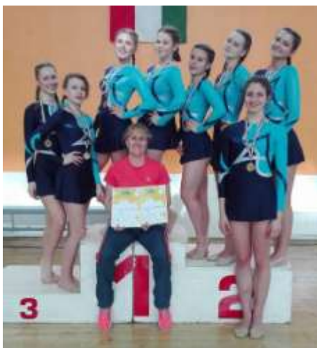
Szalézi Szent Ferenc Gimnázium – „Aranyos” tornászlányok