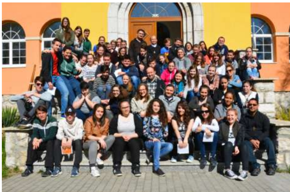
Pélföldszentkereszt – Serdülők nagyböjti lelki napjainak résztvevői