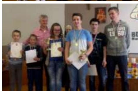
Mogoródi – A csocsóbajnokság győztesei