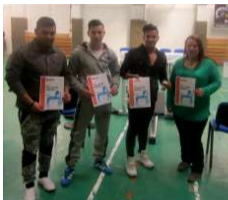
Don Bosco Szakközépiskola – A megyei fekvényomó bajnokság dobogósai