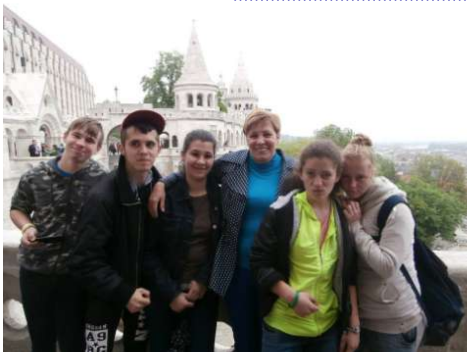
Kazincbarcikai diákok jutalomkirándulása Budapesten