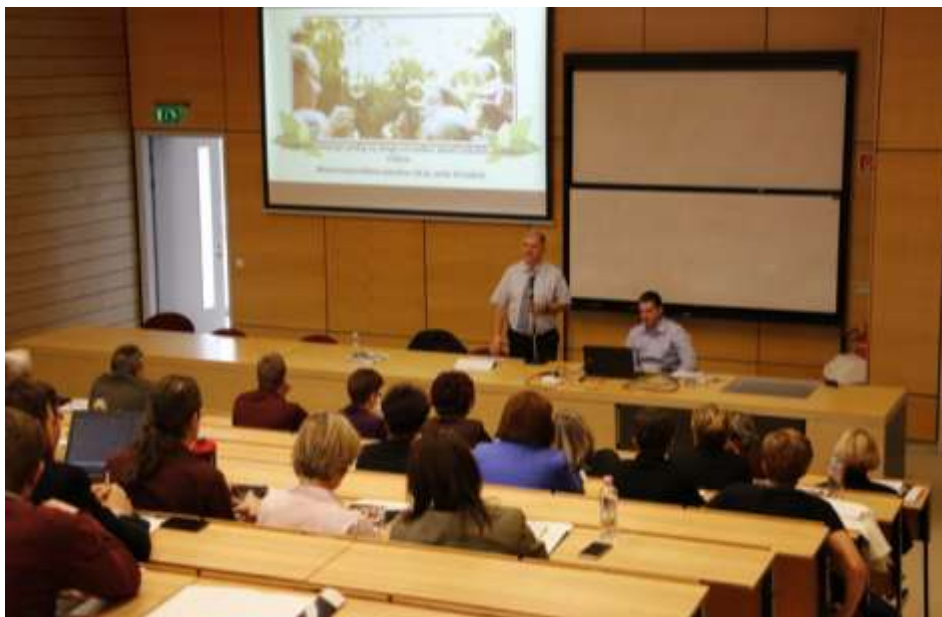
Számalk-Szalézi Szakgimnázium – Pedagógiai konferencia

Böjtelői lelkigyakorlat felnőtteknek – Ábrahám Béla szalézi tartományfőnök atya tartott lelkigyakorlatot a felnőtt korosztálynak Pélifyöldszentkereszten február 24–26. között „Termékeny szeretet” címmel családi és közösségi életünkről a családotokról szóló püspöki szinódus és pápai apostoli buzdítás, valamint a 2017-es szalézi strenna és rendfőnöki gondolatok alapján. A rendkívül jól előkészített