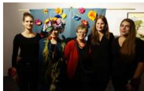
Magyar Festészet Napja, Női vonal VI. kiállítás megnyitó performance előadása