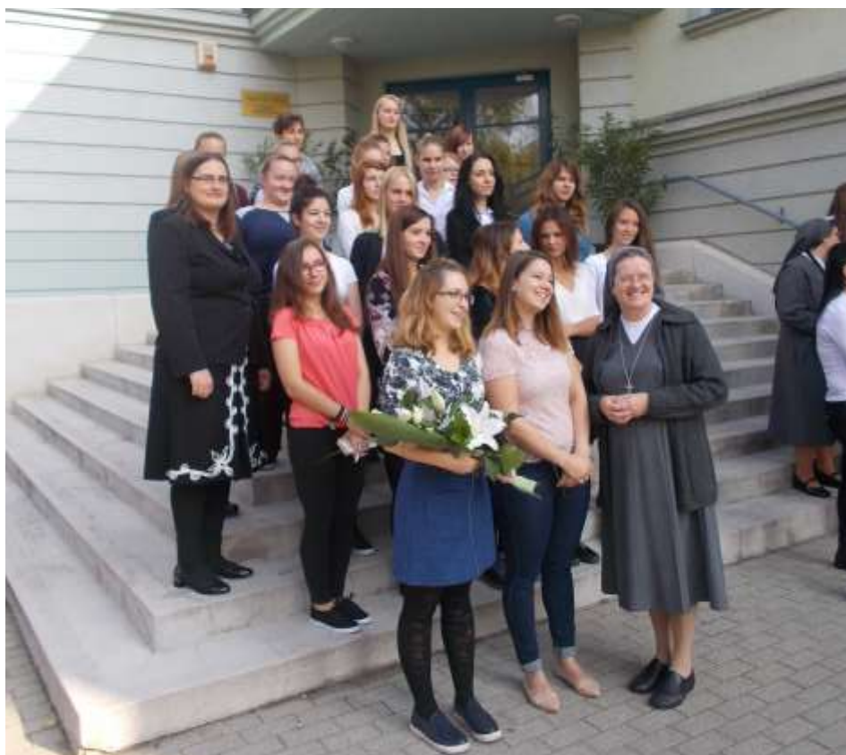
Eger – Kollégiumi ünnep

netét. Ünnepi műsorunk keretein belül felolvasták Semjén Zsolt miniszterelnökhelyettes és Balog Zoltán miniszter köszöntő sorait, majd a lányok hálaadó műsora következett. Ünnepségünk utolsó pontjaként fórumbeszélgetésre hívtuk az érsek atyát, aki örömmel válaszolt kérdéseinkre. Zárásként pedig közösen fogyasztottuk el az ebédet és az ünnepi tortát.