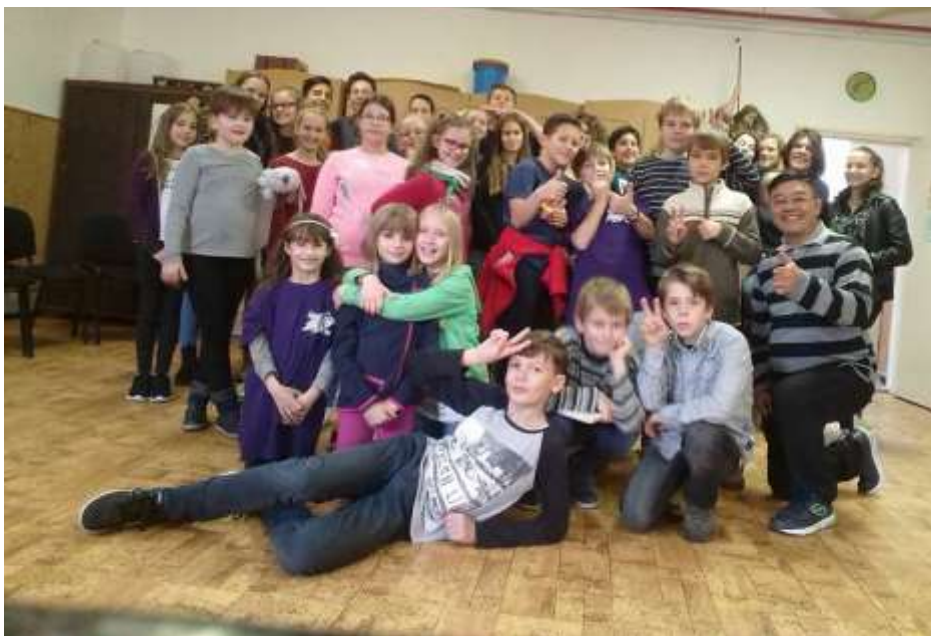
Újpest – Őszi játéknap

Őszi Játéknap – Ismét egy hatalmas őszi játéknapon vehettünk részt a nyergesi oratóriumban október 30-án. A téma „a