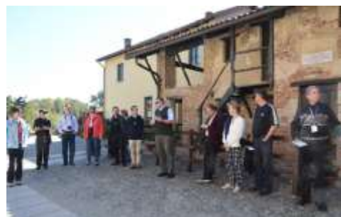
Colle Don Bosco