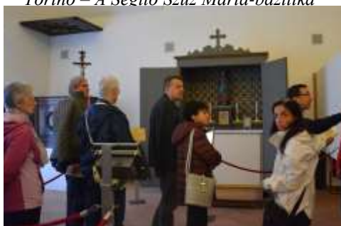
Torino – Don Bosco szobái