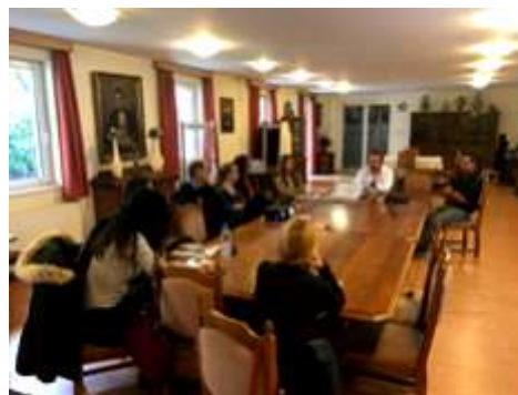
A JOB LABYRINTH projekt résztvevőinek látogatása a tartományfőnökségen