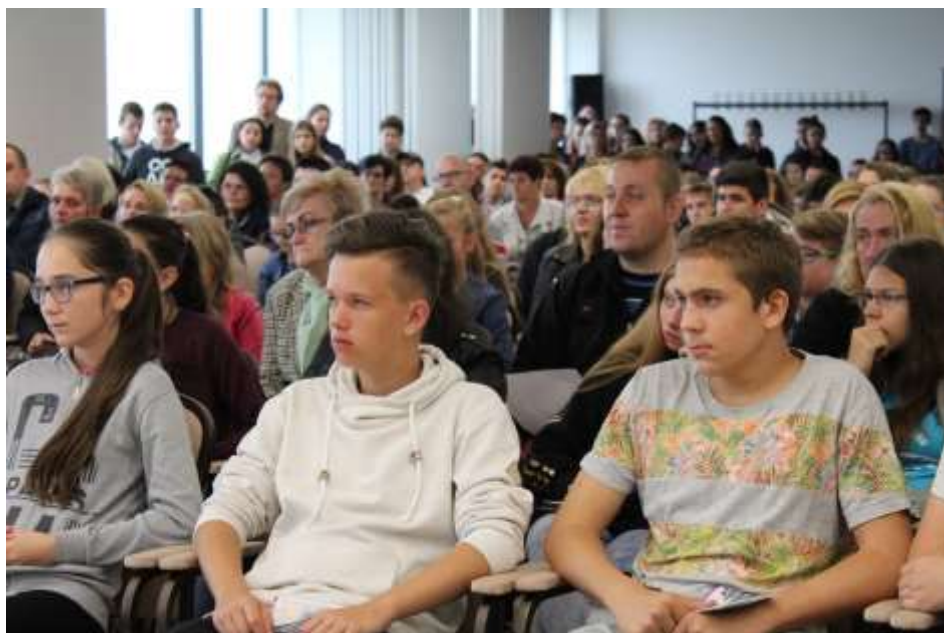
Kazincbarcika – Rendhagyó gimnáziumi nyílt nap