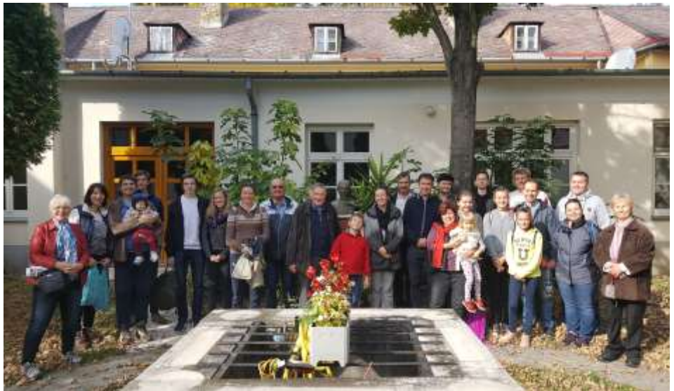
Péliföld-szentkereszt – Az újpesti énekkar kirándulása

Bansszal és sok jókedvvel vártuk a gyerekeket, és miután mindenki megérkezett, három csapatra oszlott a társaság. Így vettünk részt egy halottak napjához kapcsolódó akadályversenyen, ahol például rövid beszélgetés keretei között