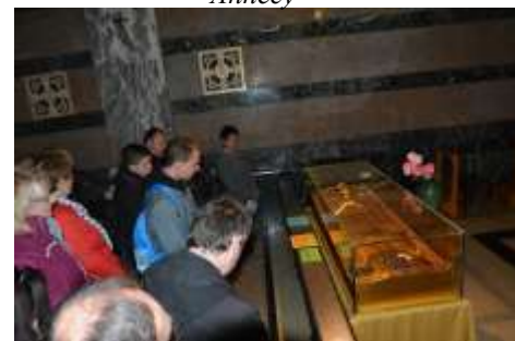
Annecy – Szalézi Szent Ferenc sírjánál

Harmadik állomásunk Chambérybe vezetett, ahol a Szalézi Szent Ferenc-székesegyházban szentmisén vettünk részt. A prédikáció központi gondolata a szalézi rend két példaadó szentjének az Oltáriszentséghez való viszonyát járta