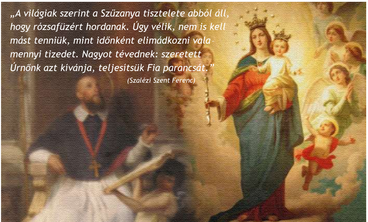
Szalézi Szent Ferenc és Szűz Mária a Keresztények Segítsége festményeinek montázsa a római Szent Szív Bazilikából