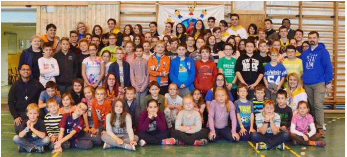
Nyergesújfalu – Őszi oratóriumi játéknappal