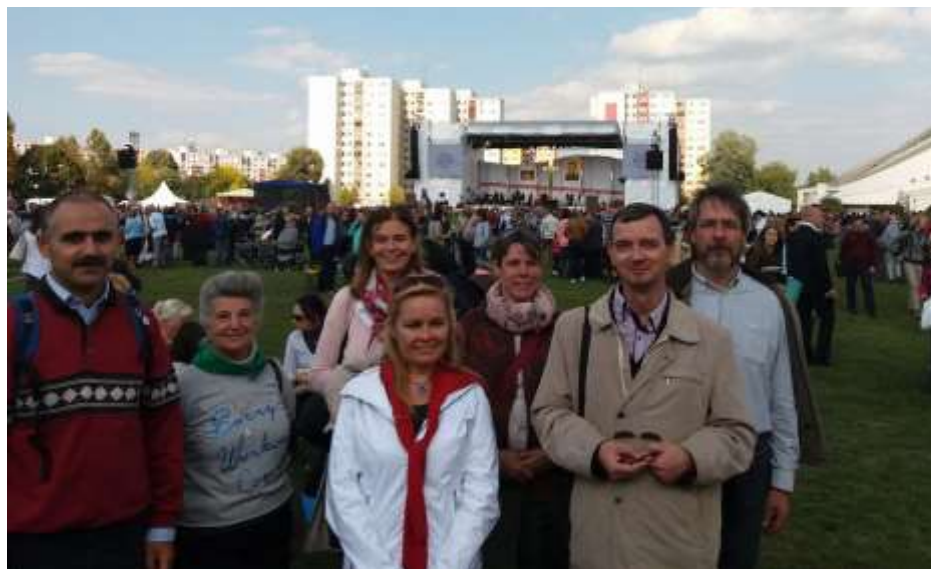
Óbudai szalézi munkatársak csoportja a boldoggá avatáson a régiós vezetővel

Már életében különleges népszerűsége vette őt körül, halála után pedig zarándokhely lett a kis temető, ahová eltemették. Titus Zeman vértanú személyében új pártfogónk van az új hivatásokért és a hivatás hűségének megőrzéséért. Imádkozunk Istenhez, kérjük régióink más mártírjaival együtt – Boldog Sándor Istvánval és a poznanai oratórium őt áldozatával (Franciszek Keszy és társai) – közbenjárását új szalézi hivatásokért!