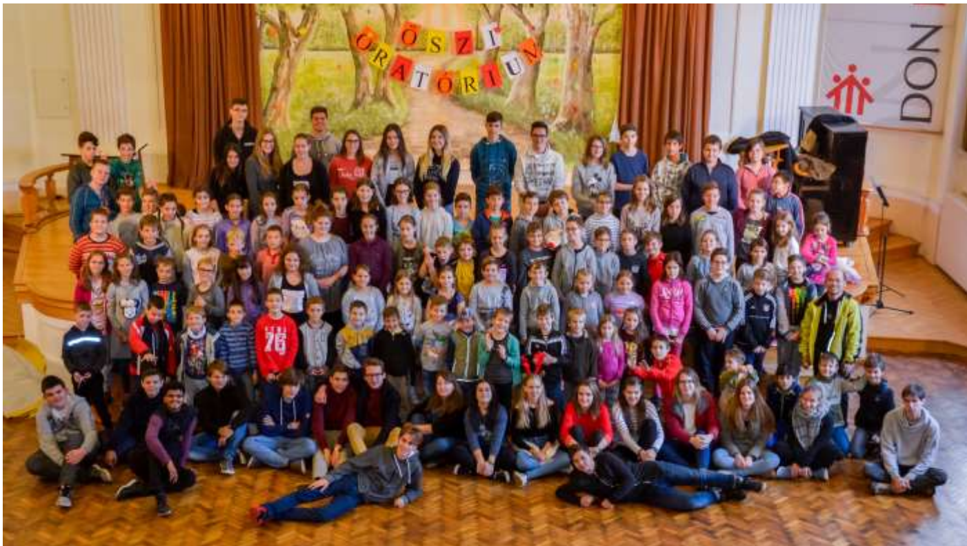
Szombathely – Őszi oratórium

atyának, hogy mindezt lehetővé tették. Sötétedés után az oratóristákkal kilátogattunk a temetőbe, ahol gitáros énekekkel és gyertyagyújtással emlékeztünk meg halottainkról. Don Bosco hagyományait követve gesztenyézéssel zártuk a napot, mellyel azok a kedves munkatársaink vártak minket, akik a kétnapos táborban meleg ebédet főztek nekünk.