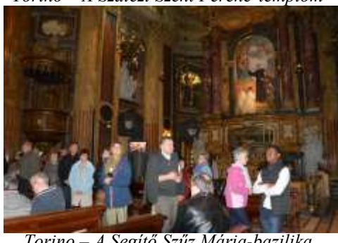
Torino – A Segítő Szűz Mária-bazilika