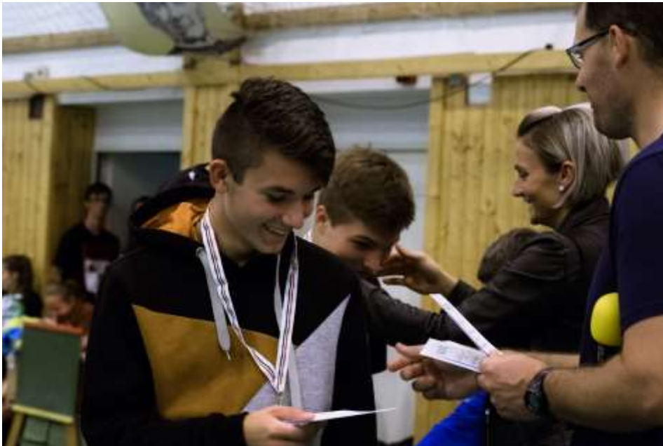
Nyergesújfalu – Őszi oratóriumi bajnokság

szerepet doktorához”, Szalézi Szent Ferenchez kötődött. A szeretet sokféleképpen megjelent a nap folyamán, mind az animációban, mind a műhelyekben.