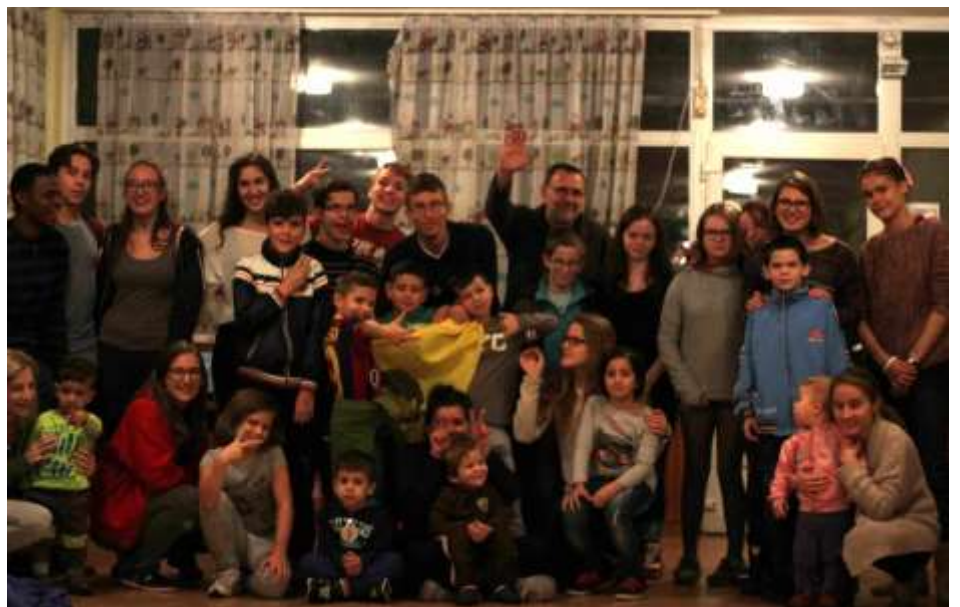
Óbuda – Játéknapp az anyaothonban