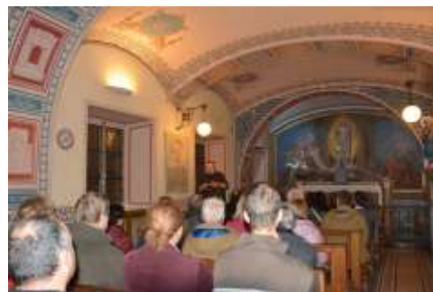
Torino – A Pinardi-kápolna

Az zarándoklaton harminckilenc fő vett részt, szaléziak, szalézi intézményekben dolgozók és más érdeklődők. Ez az öt nap ismét jó lehetőség volt, hogy a magyarországi Szalézi Család tagjai jobban megismerjék egymást. Az út fizikailag megterhelő volt, mégis nagyon jó hangulatban telt. Sok szellemi és lelki táplálékkal szolgált, és az, hogy ilyen rövid idő alatt ennyi helyen megfordultunk, érdekes és maradandó rácsodálkozásokkal ajándékozott meg bennünket (például az arisztokrata Szalézi Szent Ferenc gyermekkori otthonának gazdagsága után megtapasztaltuk a rendkívül szegény családból származó Bosco Szent János életkörülményeit). Ilyen rövid terjedelemben élményeinket összefoglalni lehetetlen; az út során szerzett tapasztalataink hosszú ideig elkísérnek minket.