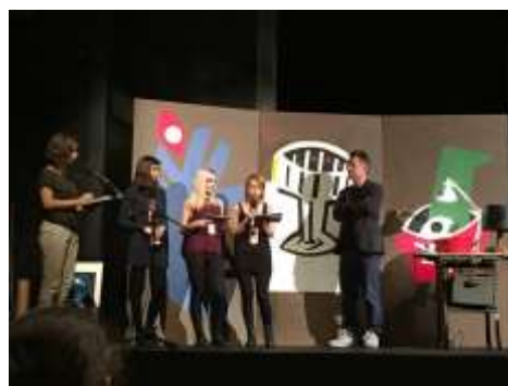
6. Primanima Nemzetközi Elsőfilmes Fesztivál diákzsűrije