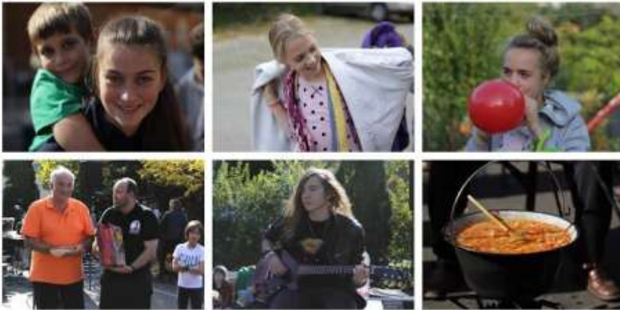
Óbuda – Lecsófeszt