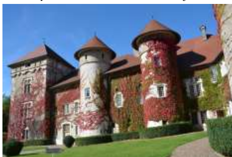
A Thorens kastély

A harmadik napot Annecyben kezdtük: ellátogattunk a vizitációs nővérek templomába, amely egy hegy tetején magasodik az óváros fölé. Bent jobboldalt a színes ablakok Chantal Szent Johanna, bal oldalon Szalézi Szent Ferenc életének jeleneteit ábrázolják; elöl kétoldalt a két szent sírja, szarkofágja található. Innen lesétáltunk a Szent Péter-székesegyházba, ahol Szalézi Szent Ferencet pappá szentelték.