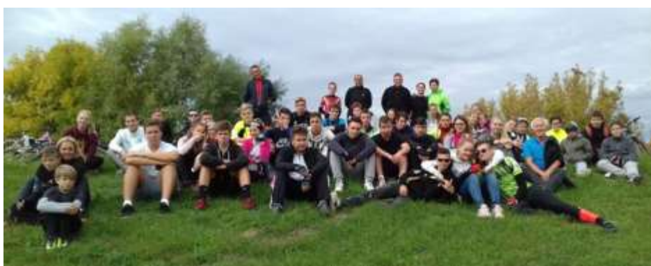
Kazincbarcika – Tisza-tavi kerékpártúra résztvevői