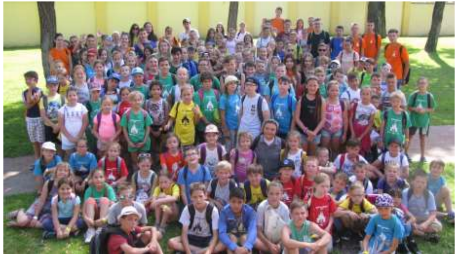
Mogyoród – Nyári oratórium

Első héten Garelli Bertalannal megtanultunk észrevenni másokat, Magone Misivel Don Bosco megmutatta nekünk, hogy egy találkozás a szeretettel megváltoztathat, Savio Domonkossal a szeretetnyelvekkel ismerkedtünk meg, végül pedig pénteken a Jézussal való találkozásban Don Bosco istenkapcsolatáról volt szó. Ezen a héten szerdán a Vadasparkot látogattuk meg a gyermekvasúttal. Itt Bogi, a Vadaspark egyik dolgozója mesélt sok érdekességet a kisebbeknek, miközben szinte végig követte őt egy aranyos kis muflon, akít az anyukája helyett ő nevelt éppen fel. A nagyobbak eközben izgalmas játékokban vehettek részt: satírozással kutathatták fel és gyűjthették össze a különböző állatok lábnyomait. A héten a gyerekek nagy örömeire vizes napot is tartottunk. Második héten Mária Keresztények Segítségével találkozhattunk az anyai szeretettel, Barolo grófnő megtanított minket arra, hogy a szeretet tud „nem” is mondani, Rua Misivel mindenben feleztünk, pénteken pedig egy lelki délelőtti keretében Don Bosco ve-