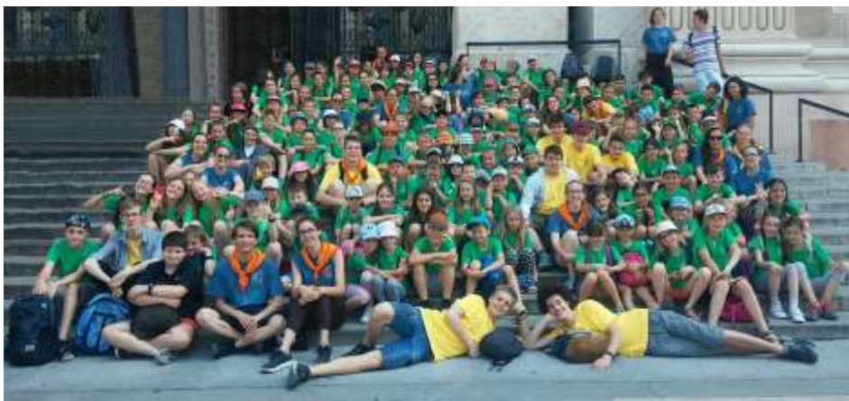
Pesthidegkút – Nyári oratórium