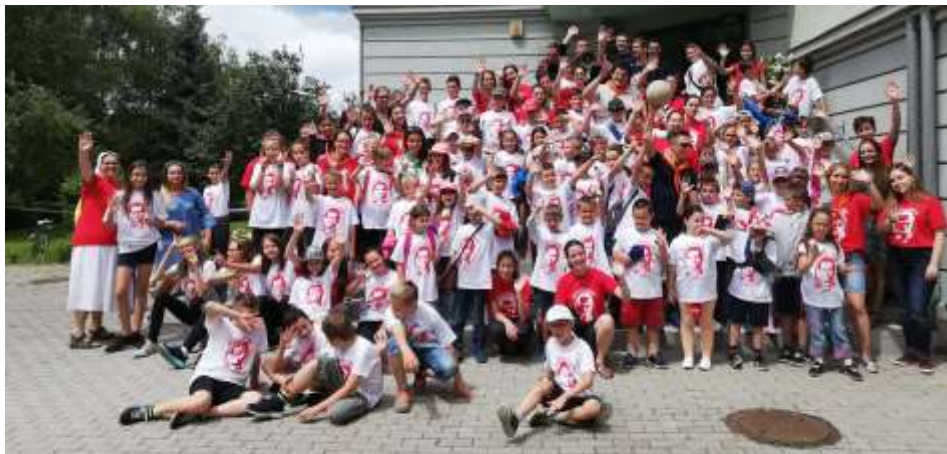
Eger – Nyári oratórium