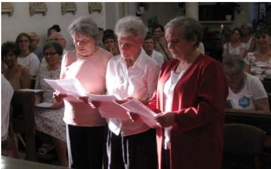
Clarisseum – Három új szalézi munkatárs tett ígéretet

ma, Szent Márton, Don Bosco, Kalkuttai Szent Teréz anya, Szent Kvirin, Boldog Rua Mihály, Savio Szent Domonkos.