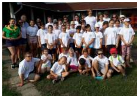
Nyári oratórium Oroszlányban

lünk találkozott. A második kirándulás során a Normafához vonatoztunk, ahol egy akadályversenyen vettek részt a csapatok, majd együtt métáztunk, fociztunk és játszottunk. Csütörtökön pedig a Szolár család segítségével mindenki saját