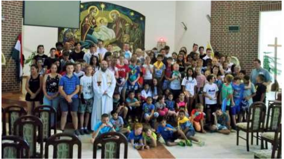
Kazincbarcika – Nyári oratóriumi tábor a Don Bosco Iskolában