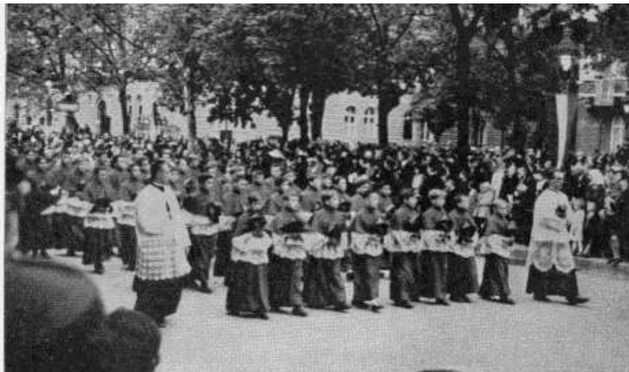
A „kis bíborosok” a szentségi körmeneten

Másnap, a Segítő Szűzanya ünnepén a hívek zsúfolásig megtöltötték a rendfőnök úr 7 órakor mondott miséje alatt a templomot. A szentmisén az ünnepő Segítő Szűz Mária Leánykongregáció énekkara énekelt. A napot felejthetetlené tette a kápolnában ritkán látott nagyszámú szentáldozás, s a rendfőnök úrnak a mise végén mondott szavai. A megható szavak után a jóságos atya a Segítő Szűzanya áldását adta az összes jelenlévő és távollévő szalézi munkatársakra, magyar hazánkra, hogy – szavai szerint – Mária országa újra nagy legyen, méltó fiainak lelki nagyságához. A jelenlevők keblét a meghatottság érzése némitották el. Sokan hangos zokogásban törtek ki.