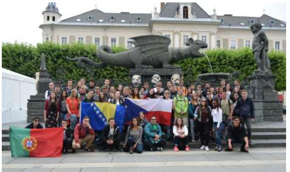
Nyergesújfalui fiatalok is részt vettek a klagenfurti nemzetközi táborban

Napközben mindig el voltunk látva érdekesebbnél érdekesebb programokkal. A másfél hét alatt nagyon sok ember történetét volt lehetőségünk meghallgatni. A