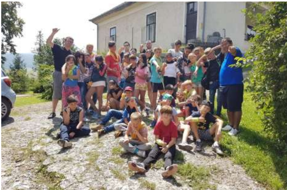
Dédestapolcsány – Kazincbarcikai Karitásztábor

is következnek, hiszen Don Bosco nem megy szabadságra.