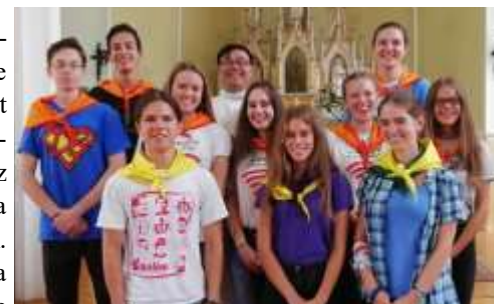
Újpest-Megyer – Új animátorok