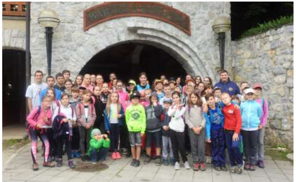
Kazincbarcika, Don Bosco Sportközpont – A tábor első hetének résztvevői