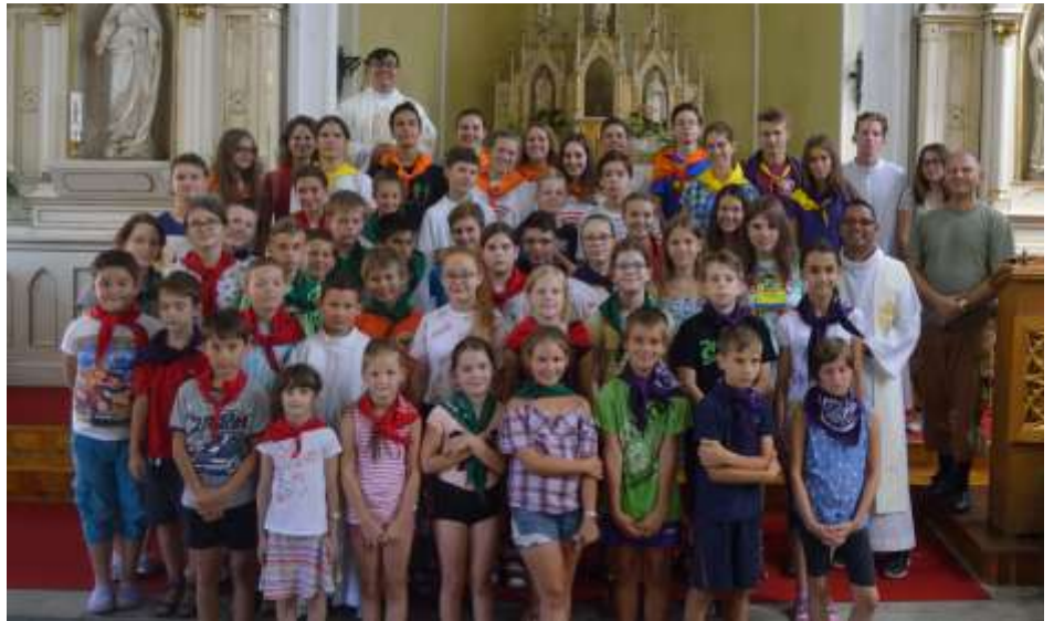
Újpest-Megyer – Nyári oratórium

Újpesti nyári oratórium 2018 – Nyári oratóriumunk második napközis hetét idén augusztus 6 és 10. között rendeztük meg. Öt együtt töltött napunk alatt alaposan megismerkedtünk Jézus és a samariyai asszony találkozásával Jákob kútjánál. A hétfői nap két kulcsszava a bátorság és a nyitottság volt, ezekre szükségünk is volt, hogy megismerkedjünk egymással