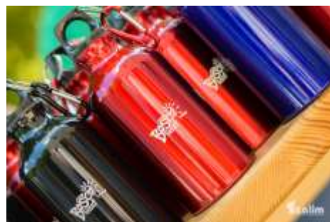
Fotók a hátsó borítón!