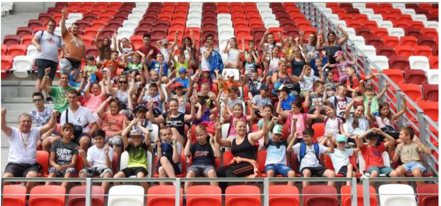
Kazincbarcika, Don Bosco Sportközpont – A tábor második hetének résztvevői a DVTK stadionban

A tábornak tulajdonképpen nincs vége, mivel egész nyáron minden szerdán jöhetnek az oratórium barátai, más táborok