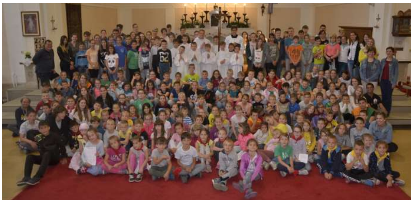
Szombathely – 26. Szalézi Nyári Oratórium.

Gyere velünk a Forráshoz! – Nagy sikerrel zárult az idei 26. Szombathelyi Szalézi Nyári Oratórium. A regisztráció elindulása után egy órán belül az összes hely elfogyott. A három hét alatt hetente több mint 190 gyerek zsvajva töltötte be a helyi szaléziak rendházát és udvarát. A résztvevőket korosztályonként csoportba soroltuk. Minden csoportnak volt vezetője, segítője és védőszentje is: Margit ma-