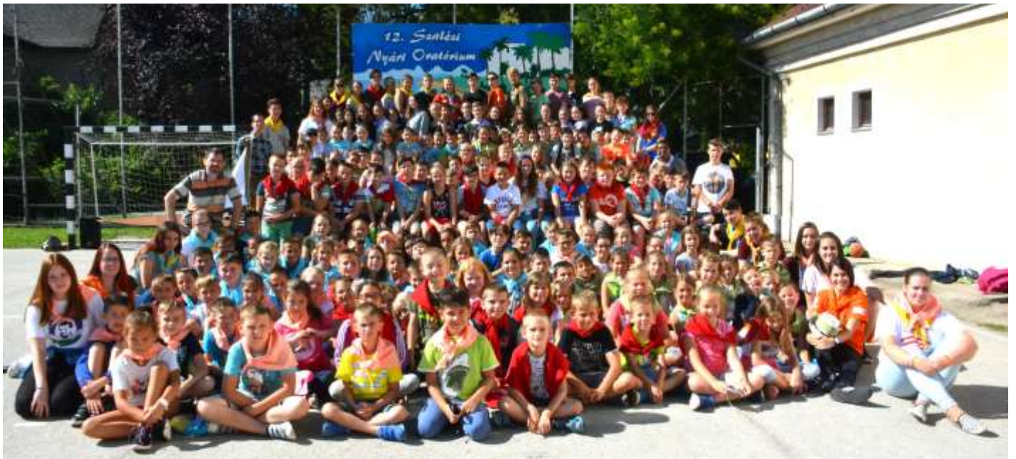
Nyergesújfalu – Nyári napközi oratórium első hetének résztvevői

Fedezd fel az öröm forrását! – Kalandokkal és felfedezésekkel teltek a június 25. és július 6. közötti hetek Nyergesújfalun, hiszen már tizenkettedik alkalommal került megrendezésre a Szalézi Nyári Oratórium, amelynek mottója idén ez volt: „Fedezd fel az öröm forrását!”