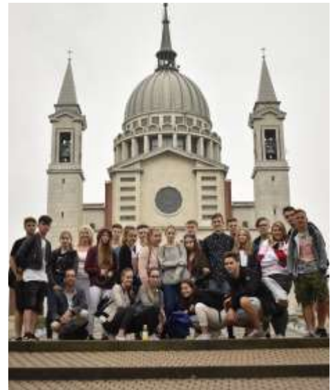
Osztálykirándulás Don Bosco nyomában