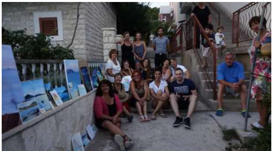
A SZÁMALK-Szalézi Szakgimnázium nyári alkotótábora Prvičben