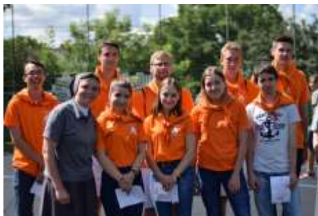
Az új mogyoródi animátorok

lünk találkozott. A második kirándulás során a Normafához vonatoztunk, ahol egy akadályversenyen vettek részt a csapatok, majd együtt métáztunk, fociztunk és játszottunk. Csütörtökön pedig a Szolár család segítségével mindenki saját