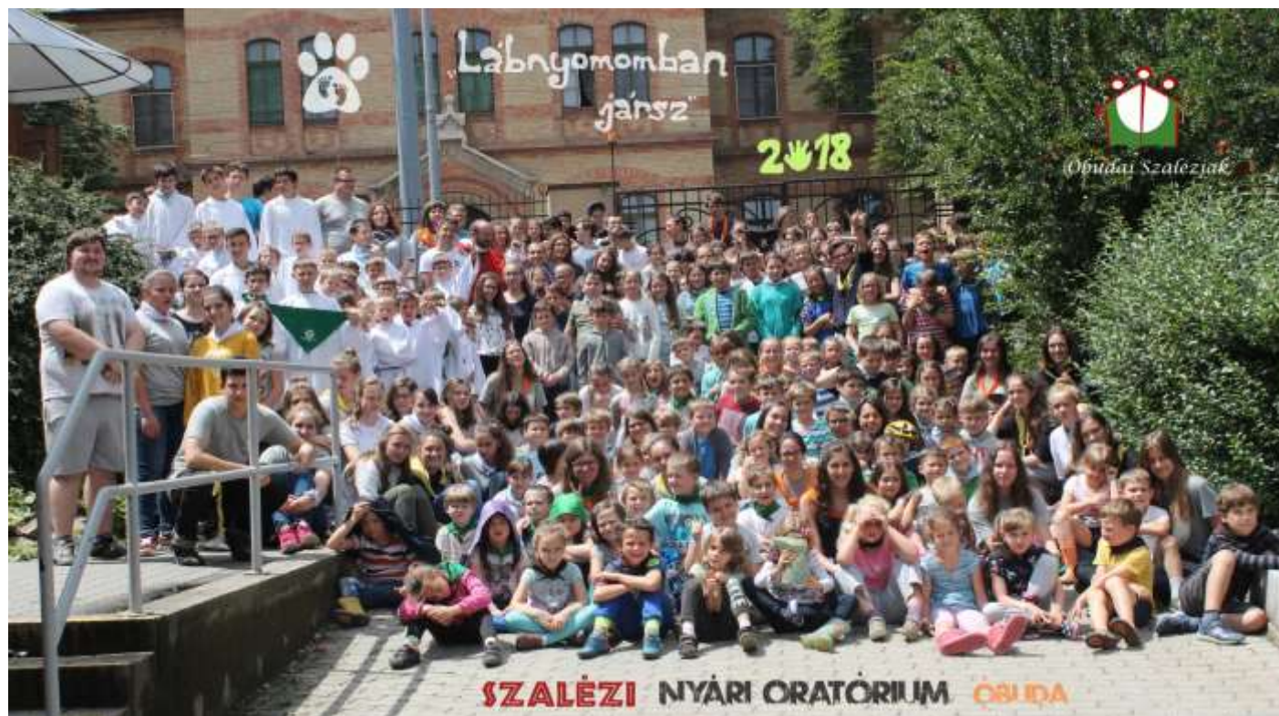
Óbuda – Nyári oratórium első hetének résztvevői

ebéd következett. A délutánt a zord időjárás miatt belső tereken folytattuk, ahol akadályversenyen vehettek részt a csoportok. Több nagyon izgalmas állomás is helyet kapott, mint például a folyosó-bowling, vagy az akadálypálya, ami szé-