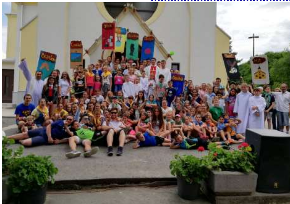
Kazincbarcika – Nyári oratórium a plébánián