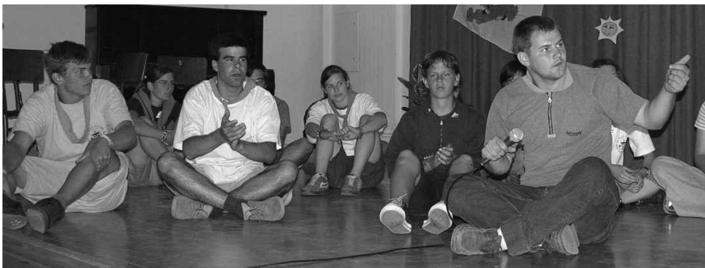
Az óbudai oratoristák szép számban jöttek el a találkozóra. Bemutatójuk sokoldalú tehetségükről árulkodott, különösen dinamikus és vidám volt.