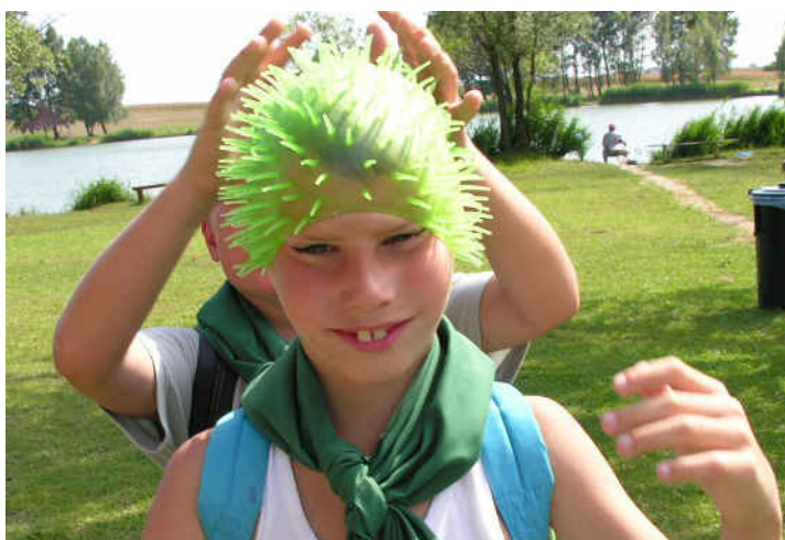
Nyergesújfalu ▼ ▲