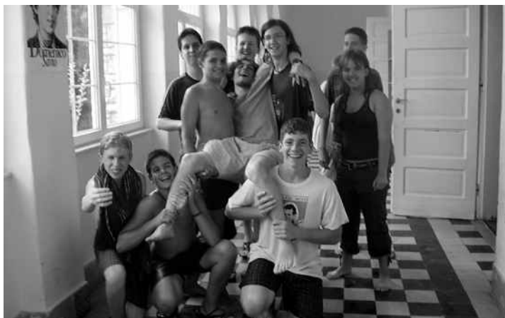
Egy animátor sem menekülhetett a vadócok karmaiból: ruhástól a ház előtt álló medencében végezték. Nem is nagyon ellenkeztek, hisz ez a nagy hőségben tulajdonképpen kimondottan jól esett mindenkinek.