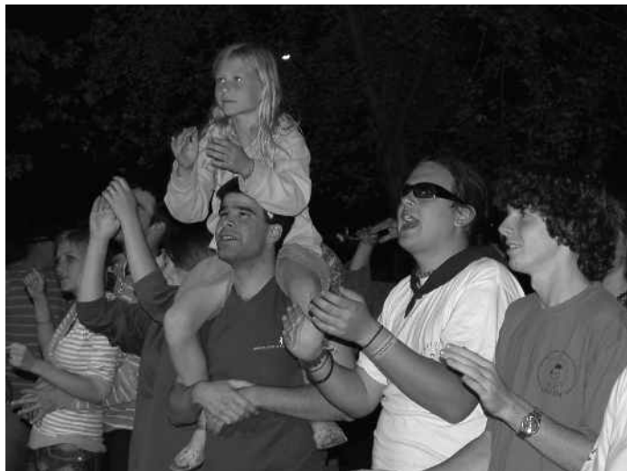
A Gável Testvérek külön üdvözölték a szalézi fiatalokat.