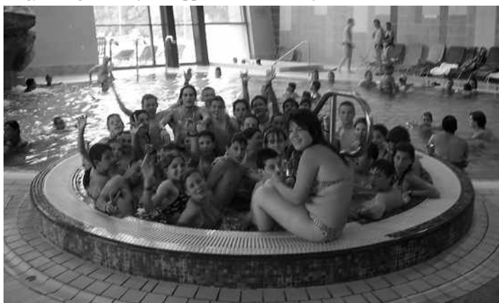
Negyvenen a jakuzziban! Ha nem is új Guinness-rekord, de az esztergomi élményfürdő vendégei számára bizonyára emlékezetes marad a Don Bosco-himnusz énekelő vadócok vidám csapata.