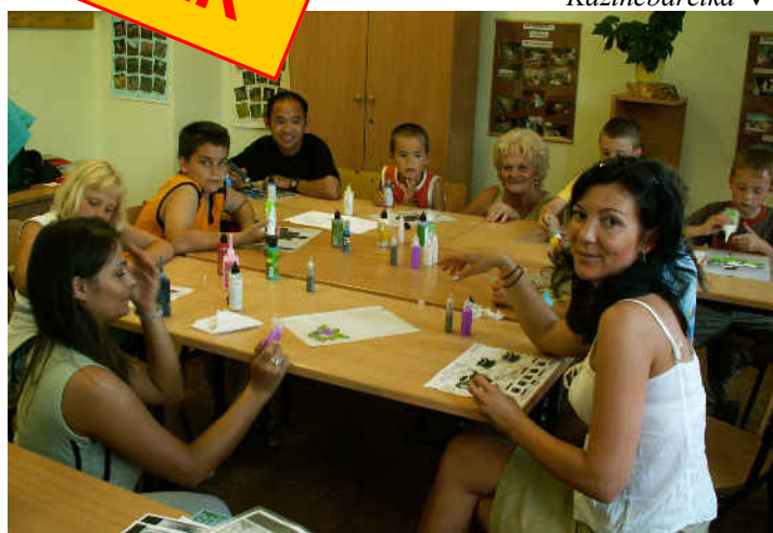
Pesthidegkút ▼ ▲