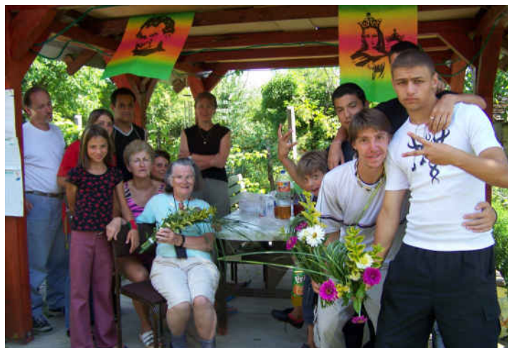
Pécs ▼ ▲