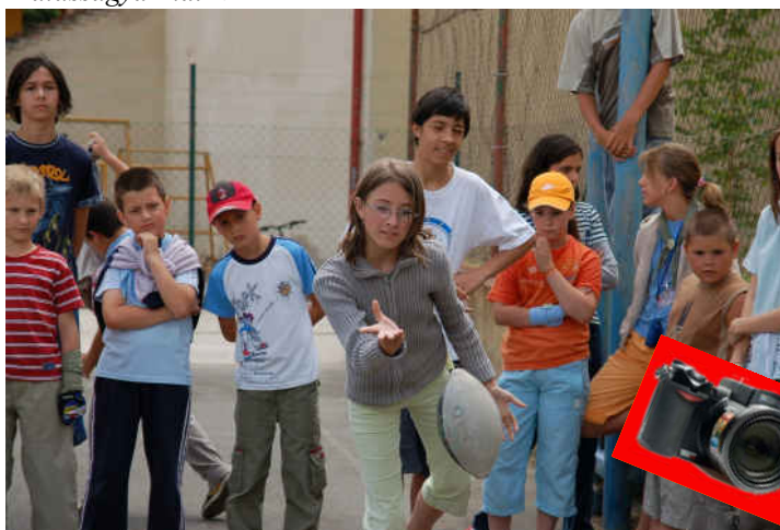
Balassagyarmat ▼ ▲