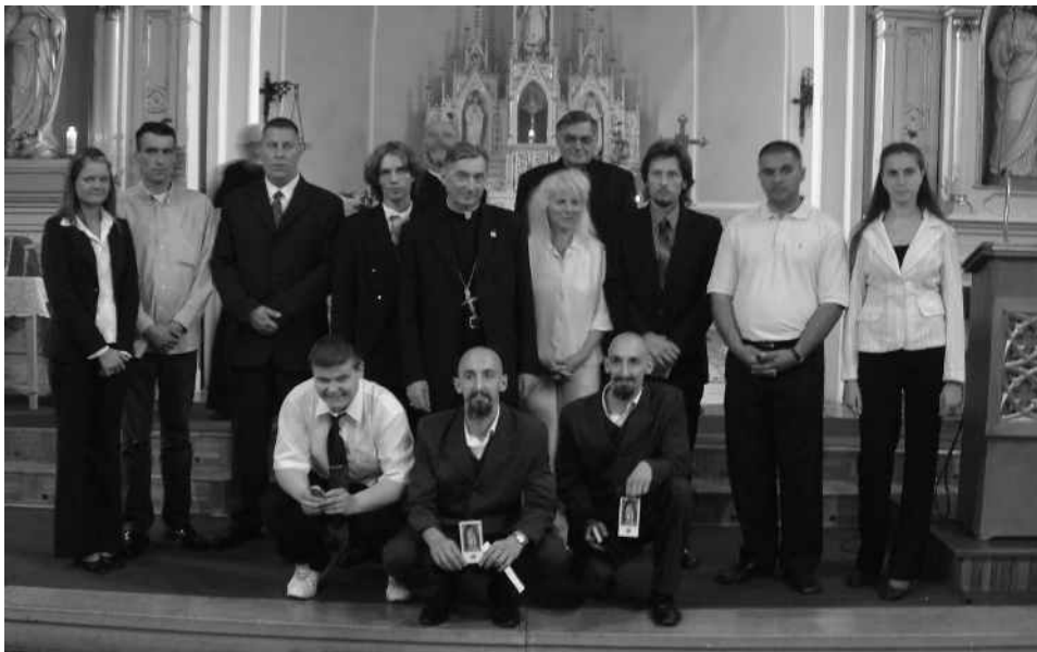
Az újpesti bérmálkozók a püspök atyával és a tartományfőnök atyával.

Elsőáldozás - május 29-én négy diák és egy tanárnő lett elsőáldozó Kazincbarcikán.