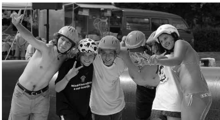
Strandfoci - kirááááá!