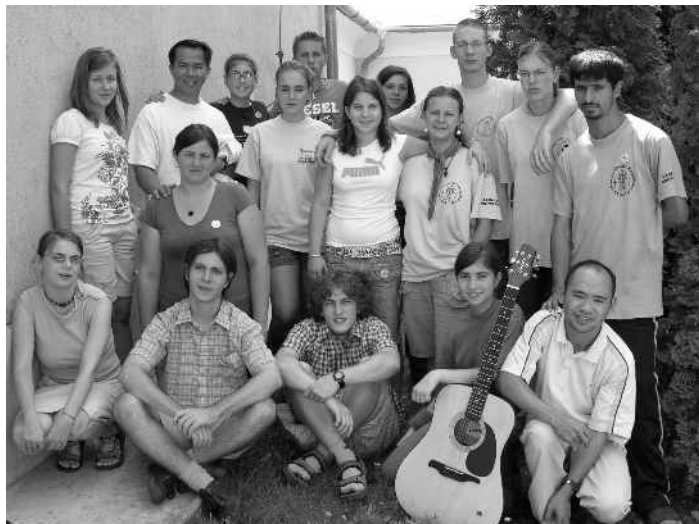
Animátoraink kicsi de lelkes csapata Péligődszentkeresztben.

A nyár kezdetén első alkalommal hirdettük a SZALIM találkozót az oratoristáknak. Ennek a találkozónak a szombathelyi szalézi rendház adott otthont, ami különösen szerencsés, hisz így még több fiatal megismerhette ennek a Budapesttől távol eső szalézi központnak a fiataljait és minden adottságát. A találkozón két napig ismerkedtek, játszottak, zenéltek és imádkoztak együtt az óbudai, balasagyarmati, nyergesújfalui, pécsi, albertfalvi és a házigazda szombathelyi oratórium fiataljai. Minden csoportnak alkalma volt megmutatni a többieknek, náluk hogyan zajlik az élet. Tarka bemutatkozó műsorokat, rövid filmeket, képes beszámolókat, énekes-táncos-játékos jeleneteket láthattunk, a nyári oratóriumok és évközi foglalkozások széles skáláját ismerhettük meg.