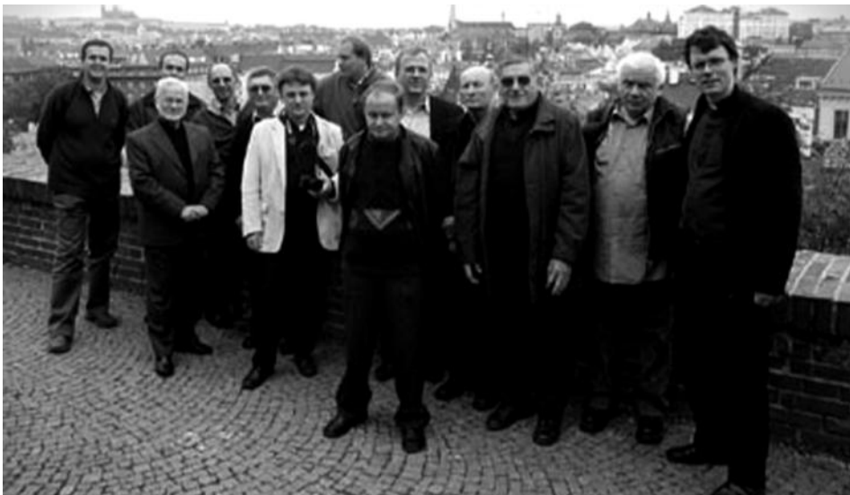
A prágai CIMEC csúcstalálkozó résztvevői.