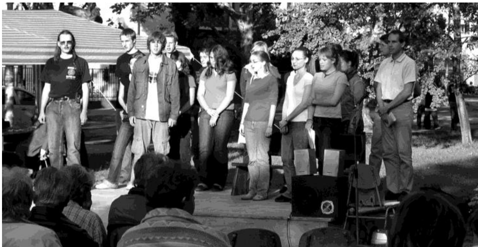
Városmisszió - Albertfalva