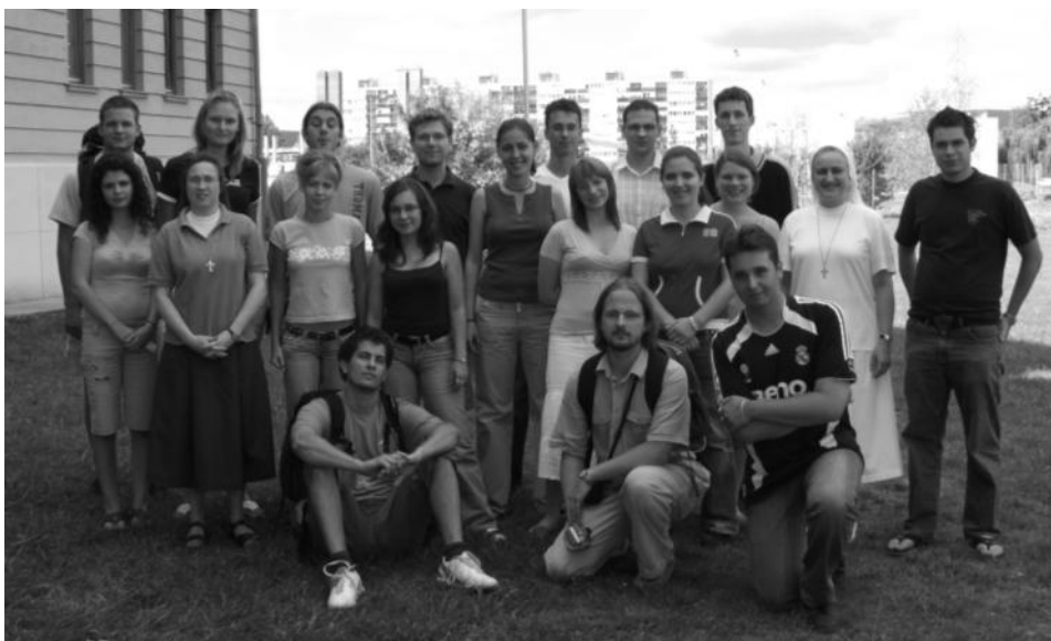
„Kolis-tábor” az egeri leánykollégium és az óbudai fiúkollégium lakóinak ismerkedése.

A hétvégén felhívták figyelmünket egy új vírusra, ami manapság igen elterjedt, ez pedig nem más, mint az UMFCÉ , vagyis