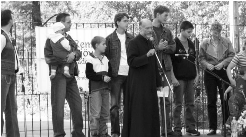
Városmisszió - Újpest-Megyer

minden megvolt egy szuper kis kiránduláshoz! Elvonatoztunk Szilvásváradra, és körülbelül 2-3 órán keresztül vándoroltunk kissé gyors tempóban hegynek felfele, és teljesen kifáradva értünk fel egy tisztásra. Itt szendvicset ettünk, énekelünk, játszottunk, és részt vettünk egy igazán bensőséges és felemelő erdei szentmisén. Lélekben megnyugodva és testben megpihenve indultunk volna vissza, amikor szóltak, hogy rossz felé tartunk, és a másik irányba kell mennünk. Már ekkor sejtettük, hogy itt valaki valamit máshogy tervezett, mint amit mi gyanítottunk. Hát újra útnak eredtünk, aztán csak mentünk, mentünk és mentünk. Az utunkba eső hegyeket megmásztuk, megcsodáltuk a mesés kilátást, és reméltük, hogy végre már hazafelé tartunk.