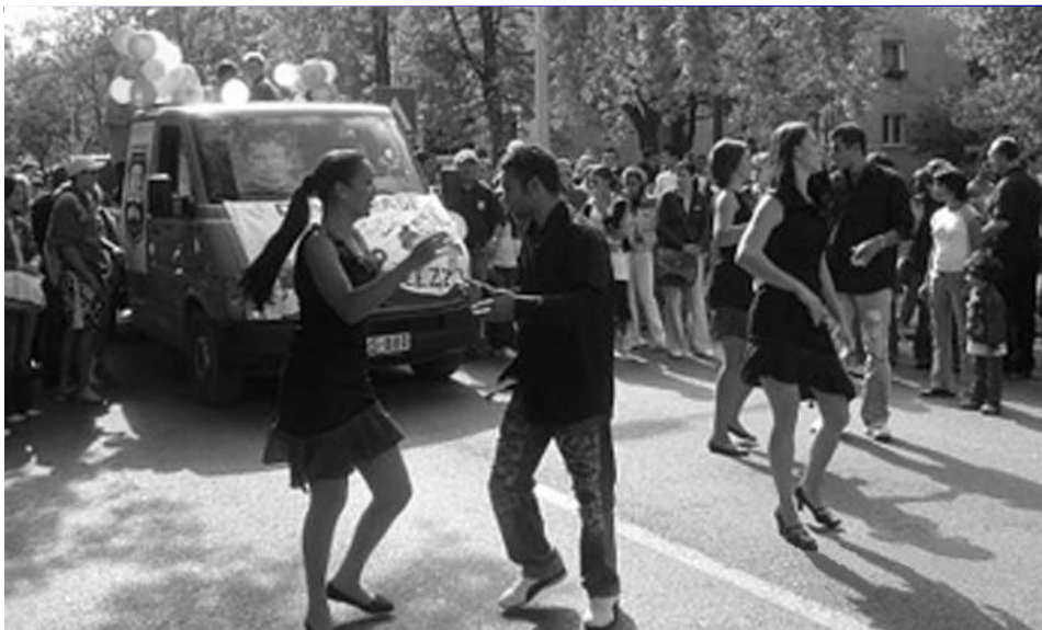
Diákpárádé - A Don Bosco Középiskola szeptember 13-án első alkalommal vett részt azon a kamionos felvonuláson és játékos vetélkedőn, amelyen hat kazincbarcikai középiskola mérte össze tudását és ügyességét.

kollégistáknak. Minden alkalommal más-más diák tekintheti meg az előadást jutalomként. Kálmán Imre Csárdáskirálynő című operettjét mi, lánykollégisták nézhettük meg. A következő előadás Gogol Revizora lesz.