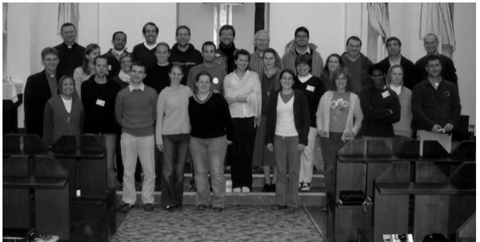
Az európai SZALIM közgyűlésének résztvevői a krakkói szalézi szeminárium kápolnájában.

A levelek teljes szövege és a boldoggá-avatással kapcsolatos egyéb iratok elolvashatók a www.donbosco.es honlapon, ahol ebből a különleges alkalmából egy új aloldalt alakítottak ki. (ANS – Madrid)