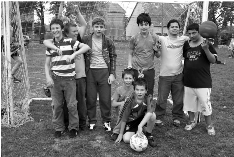
A pécsi oratórium csapata.