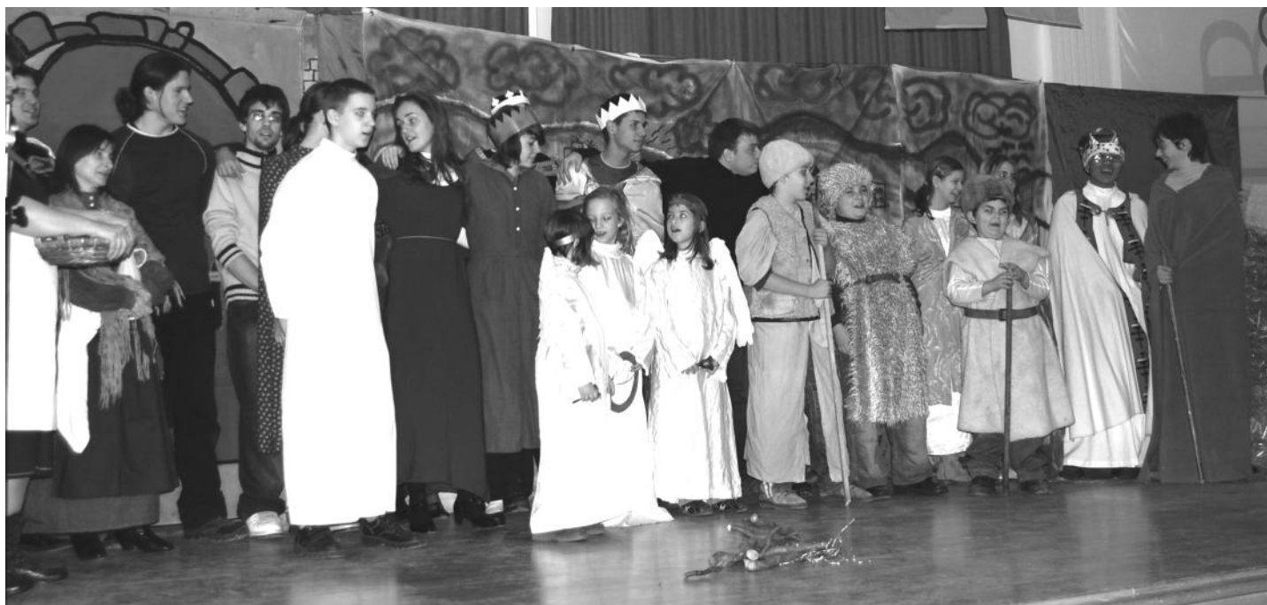
Szombathely - a Szent Erzsébet karácsonya című színdarab szereplői