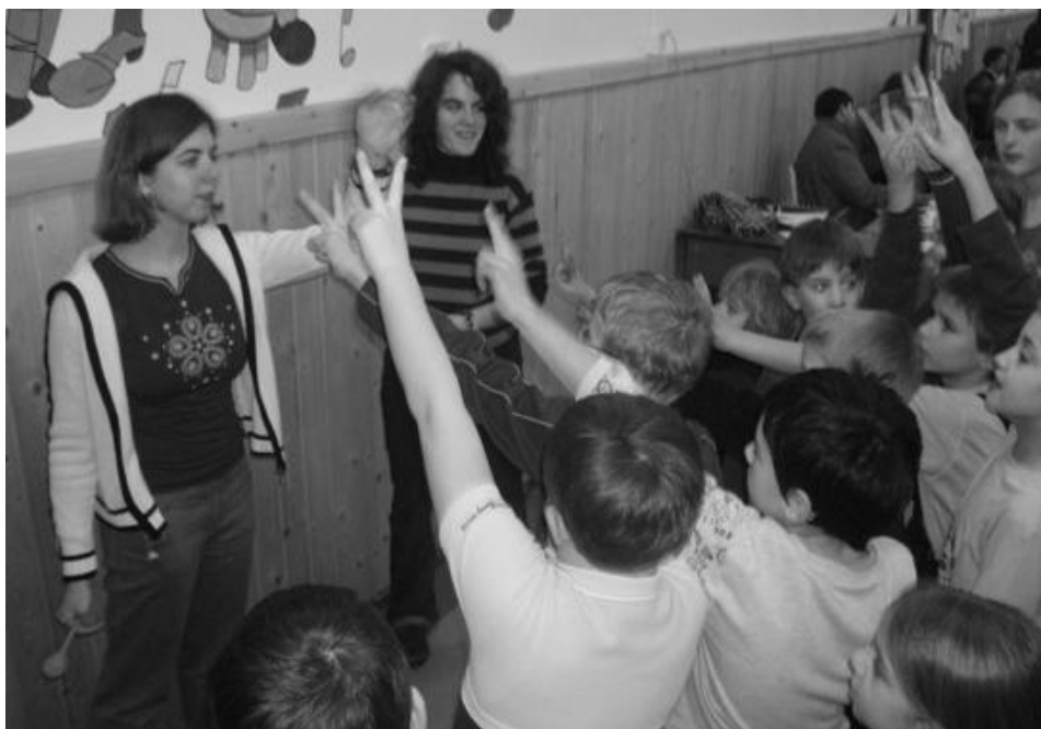
Animátorok és gyerekek - családi nap az óbudai oratóriumban

A legfontosabb az egészben az, hogy ez a program összehozta az oratoristák szüleit és az óbudai szalézi szerzetesi közösséget. Ez a félig ünnepélyes alkalom megfelelő légkört biztosított ahhoz, hogy fogalmat alkossunk a családi háttérrel, amelyből az oratóriumot látogató gyerekek érkeznek. Másfelől, a szülők is elégedettek voltak a törekvéseinkkel. Sokuknak ez alkalom volt arra, hogy első kézből jussanak érte-