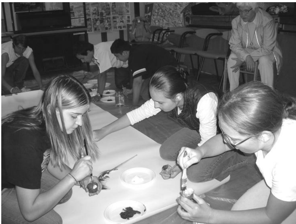
Készülnek a festmények a pécsi napköziben

Előtte hagyományosan egy héten keresztül, „angyalkázás” tette örömtelibbé a várakozás idejét. Apró „szeretet-ajándékokkal” kedveskedtünk egy-egy titokban kiválasztott személynek. Az „angyal” és „védenca” a keddi ünnepség után talált egymásra, csak ekkor derült fény a jövő kilétére. A karácsonyi ajándékozás most is a közös karácsonyfa, és egy gyönyörű