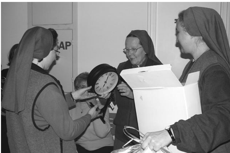
Az egri nővérek órát kaptak ajándékba

„Murál Morál” a Don Bosco napköziben - Tavaly ilyentéjt két pécsi lány kiment Nicaraguába, ahol megismerkedett egy új nevelési móddal - nagy falfelületek közös kifestésének technikájával. Hazaérkezéskor a lelkesedéstől és tenni akarástól fűtött úti beszámolót tartottak. A hallgatóság köréből rögtön partnereket kerestek a megvalósításhoz. Akadt is nyolc csapat, aki vállalkozott a feladatra, köztük a Don Bosco napközi mellett újonnan megalakult Kallódó Gyermekéért alapítvány is. Tavasztól őszig a vezetők képzése zajlott. Így csak elejtett szavakból hallottunk erről a titokzatos nevű társaságról - „Murál Morál” - ami falfestéssel való nevelést takar. De eljött az ősz, és kezdődött a közös munka. Két fő témát dolgozunk fel: az első az egyetemes emberi jogok, a máso-