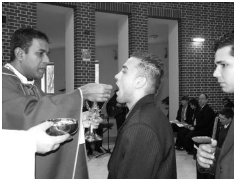
Elsőáldozáshoz járulnak a kazincbarcikai Don Bosco Szakiskola diákjai