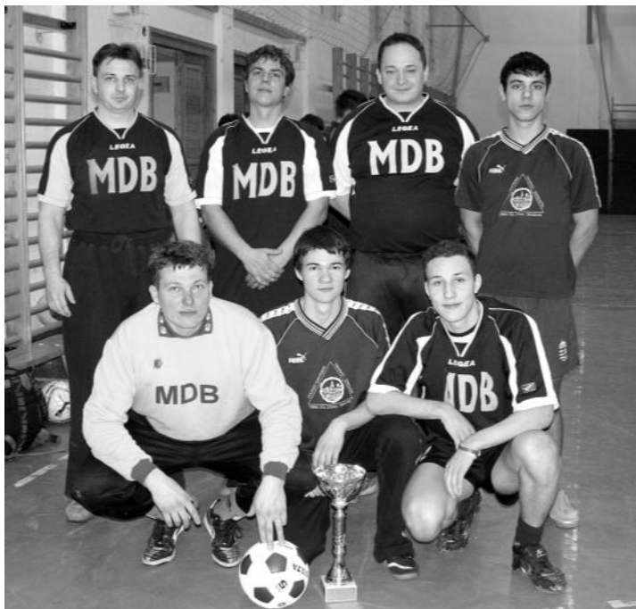
Idén a Megyeri Don Bosco csapat vihette haza a kupát