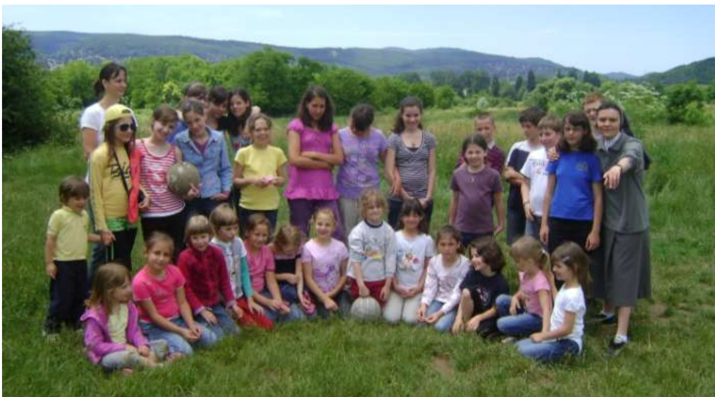
Pesthidegkút - a napközi résztvevőinek hagyományos kirándulása a Gercsére.

Nyári tábor - A pécsi Don Bosco Napközi nyári tábora az idén Kővágószőlősen zajlott, Péctől mindössze 20