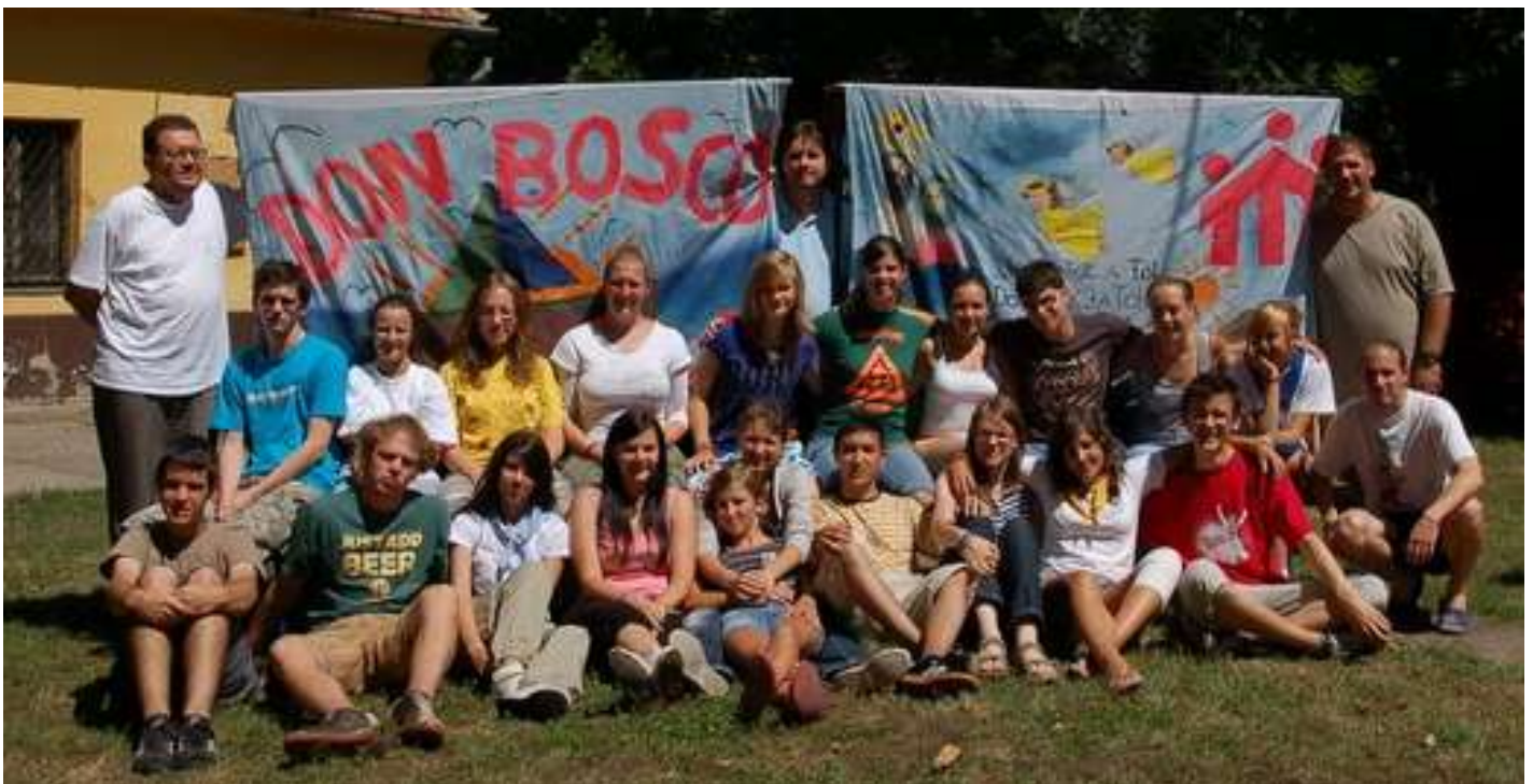
A STÉG témája: "Aki énekel kétszeresen imádkozik" - arról szólt, hogyan válhatunk jobb animátorokká.