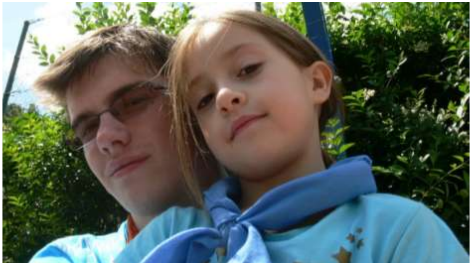
Óbudai animátor egy táborozóval - idén is nagyon sokan jelentkeztek..

A nyári oratórium mindkét hetére idén is nagyon sokan, kb. 180-an jelentkeztek. A két hét alatt Micimackónak és barátainak tulajdonságait, történeteit ismertük meg. A már hagyományosnak tekinthető rendszert követve 3 korosztályban 3 színnek megfelelően kerültek csoportokba a gyerekek, így életkoruknak megfelelő beszélgetésen, bajnokságokon vehettek részt, mégis egymásért küzdöttek a kicsik és a