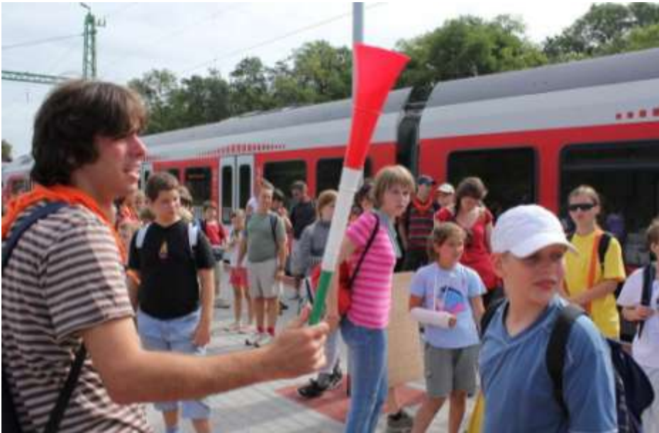
Albertfala - Csillagtábor minden nap más helyszínen.

Csillagtábor 2010. - Idén is augusztus utolsó hetében, (augusztus 23-27.) került megrendezésre a Csillagtábor Albertfalván, mintegy ötven gyermek részvételével. Ez azért is nagy örömhír, mert ez lényegesen több, mint az előző évben!!!! Csak így tovább! ☺