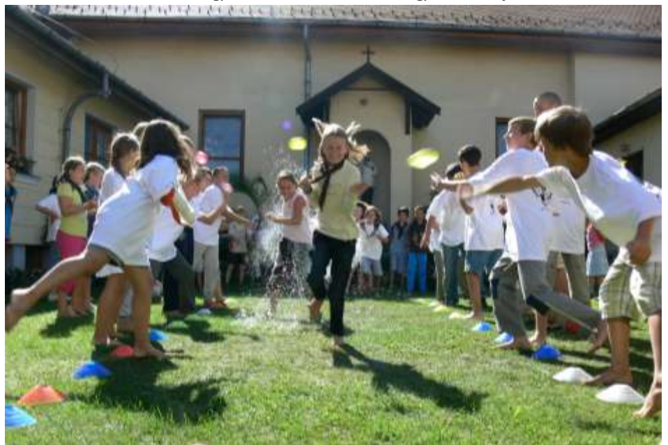
Óbudai nyári napközi - vizes játékok a rendház udvarán.