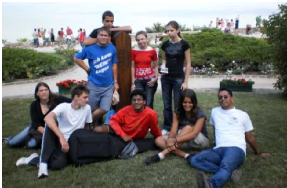
Az újpesti fiatalok a Balaton mellett táboroztak.

Augusztus 2-án, hétfőn délelőtt indultunk, rengeteg táskával, egész hétre elég ennivalóval, játékokkal és nem kevés jókedvvel felszerelve. A tábor témája a 2010-es strenna volt: „Uram, látni akarjuk Jézust!”. E köré épültek a naponta tartott csoportbeszélgetések és önálló gondolkodtató feladatok. Egyik délután Tihanyba mentünk és ott tartottuk a beszélgetést sok vidám játékkal egybeköt-