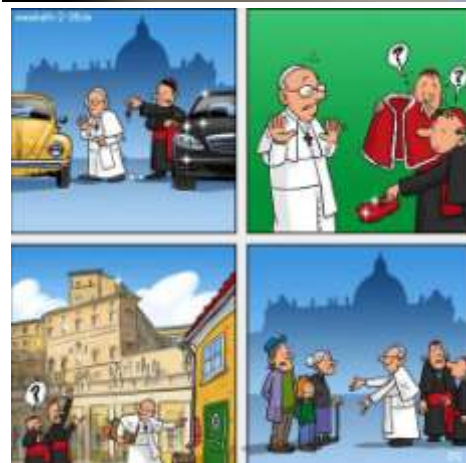
Az osztrák szaléziak hozzászólása: Látszik, hogy Don Bosco iskolájába járt...

Március 19-én ünnepi szentmise bemutatásával kezdődik meg hivatalosan Ferenc pápa péteri szolgálata. A 266. pápát eljöttek megtisztelni a világ hatalmasai, de kívánsága az volt, hogy a kicsinyek is ott legyenek mellette, ezért egy Buenos Aires-i cartoleros, papírgyűjtő fiatal is jelen volt a díszvendégek között. Pascual Chávez, szalézi rendfőnök ezen a napon köszönti Ferenc pápát péteri szolgálata megkezdése alkalmából, kifejezi a Szalézi Társaság háláját és biztosítja odaadásáról. Egy Segítő Szűz Mária-szobrot ajándékoz a Szentatynak és meghívja Torinóba 2015. május 24-re, a Segítő Szűz Mária ünnepére, amikor Bosco Szent János születésének kétszázadik évfordulóját ünnepli majd a Szalézi Csa-