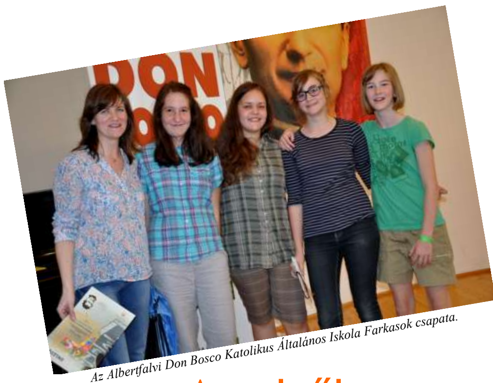
Az Albertfalvi Don Bosco Katolikus Általános Iskola Farkasok csapata.