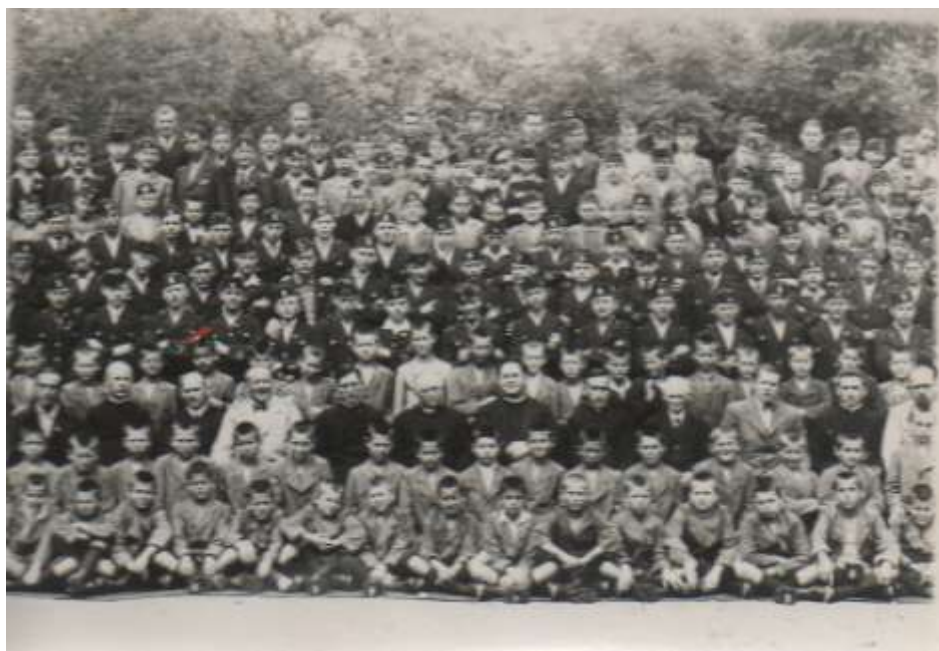
Esztergom-Táborban a fiúk között.