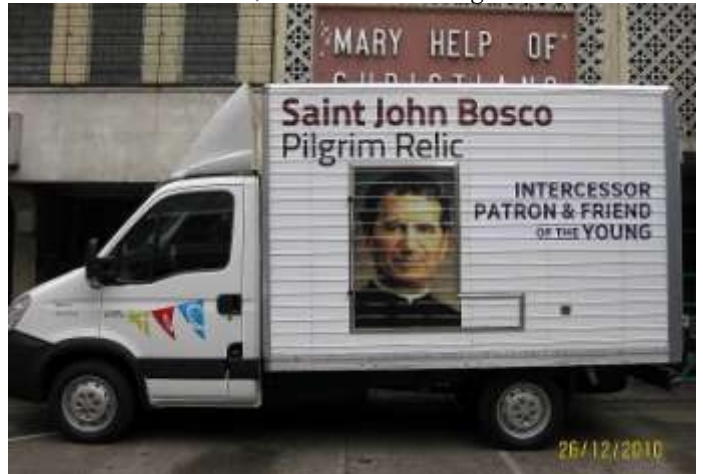
Az ereklye szállítására kialakított speciális tehergépkocsi.