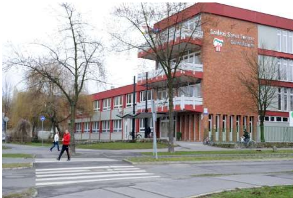
Kazincbarcika - A Szalézi Szent Ferenc Gimnázium felújított épülete.

A fentiek kívül bővelkedtünk oratóriumi programokban is. Volt lacikonyha, játékok, keresztút az animátorok vezetésével, ifjúsági és ministráns keresztút, szülinapokat is ünnepeltünk, készül-