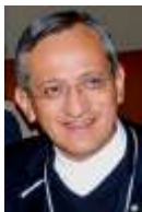
Don Pascual Chávez Villanueva rendfőnök