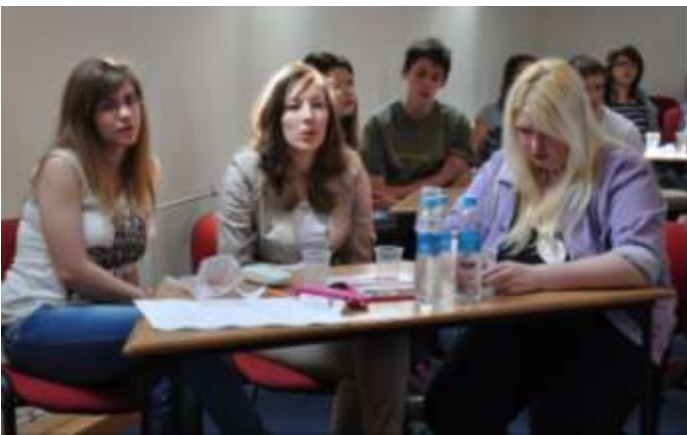
A negyedik tagjuk megsérült, de így is majdnem dobogósak lettek – a Feltörekvők csapat a kazincbarcikai Szalézi Szent Ferenc Gimnáziumból.