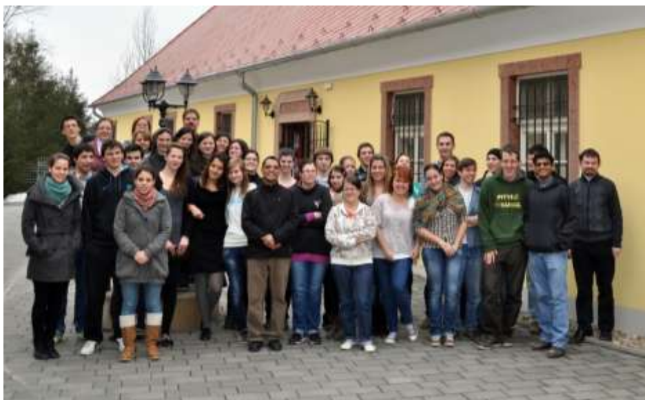
Péliföldszentkereszt - A nagyböjti ifjúsági lelkigyakorlat résztvevői.

ben imádkozni valakiért vagy valamiért, akivel vagy amivel nehezen foglalkozol, majd imád jelképeként egy kis pohár vizet kellett önteni egy tálba, ezzel egyesítve az imát a többiekével.