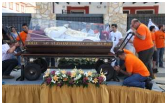
A kocsit mindkét oldalról húzható, 90 fokban elforgatható, úton és templomi szőnyegekön egyaránt könnyen gördül.