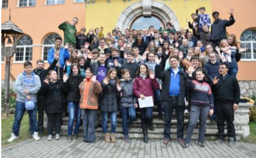
Péliföldszentkereszt - a serdülők nagybőjti lelki napjainak résztvevői.