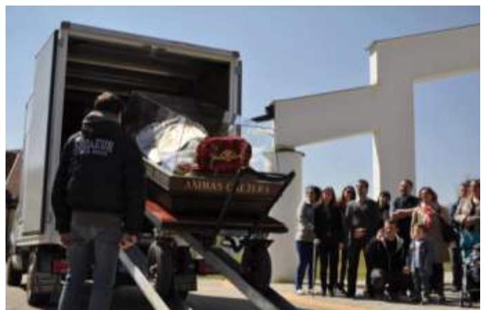
Az urnát egy külön erre a célra tervezett kis kocsin mozgatják.