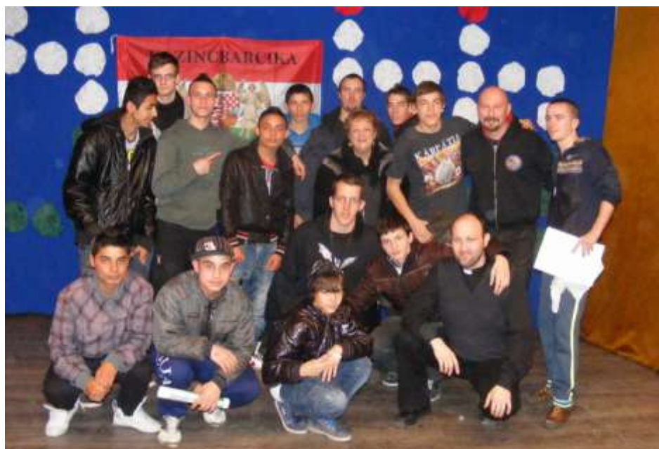
Kazincbarcika - Zászlószentelés Herbolyán.

Visszaérkezve a plébánián meleg tea és szendvicsek vártak minket. Energiára szükség is volt a megterhelő feladatok után, így nem meglepő, hogy volt, akinek farkasétvágyát csak 17 szendvics tudta csillapítani. Teli gyomorral újult erővel ment a játék: a roverino lelkes résztvevőkre talált, a várakozók meg folytatták a bevezető játékokat. A soron következő keresztúton nem minden állomást elméltünk végig, de sokat emelt a színvo-