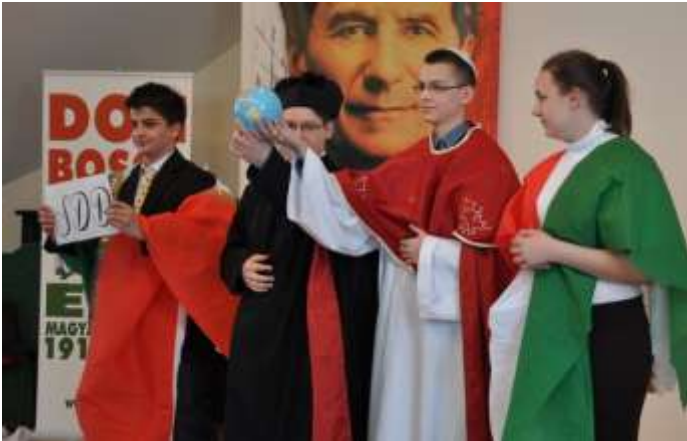
A második helyezett keszthelyi Ranolder János Római Katolikus Általános Iskola Fiore csapatának látványos némajátéka.