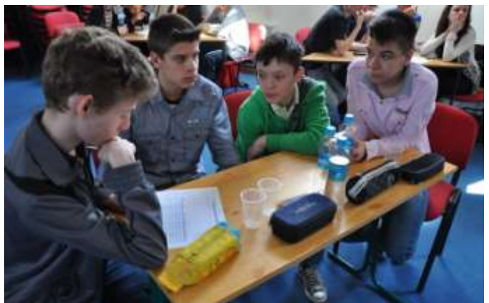
Komoly fejtörést okozó feladatok is voltak – a Don Odobá csapat a nyergesújfalvai Szalézi-Irinyi Középiskolából.