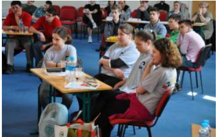
Feszülten figyel a harmadik helyezett Szürkék csapat Albertfalváról.