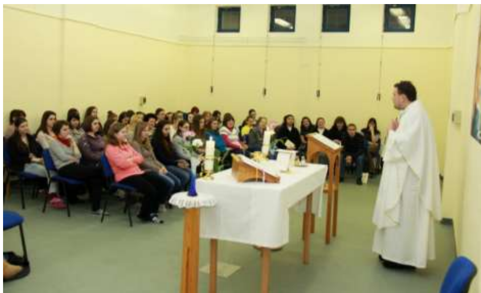
Eger - Don Bosco mise a kollégiumban.

tünk a nagyhét programjaira, a húsvétra. Hagományaink tiszteletben tartása mellett húsvét vasárnapján minden gyermek, aki a szentmisén jelen volt, csokitojással térhetett haza.