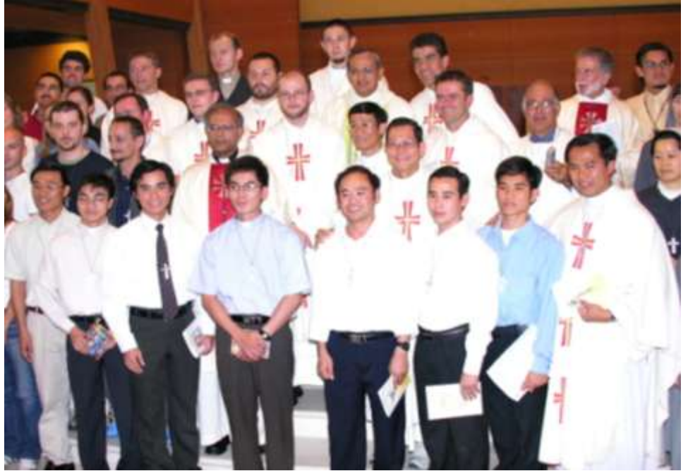
A rendfőnök útnak indítja a misszionáriusok csoportját - Colle don Bosco 2005-ben.

Az első vietnami misszionáriusok 1999-ben hagyták el az országot és napjainkban már minden kontinensen megtalálhatjuk őket. Az utóbbi években itt található a