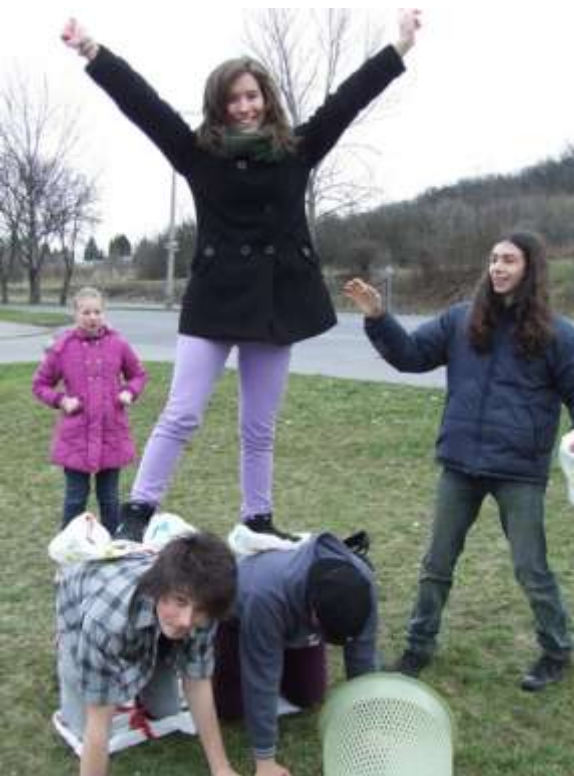
Kazincbarcika - Ifjúsági találkozó a plébánián.