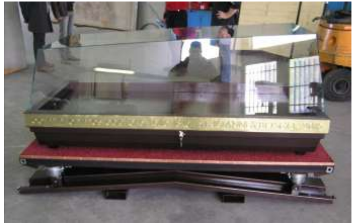
Az urnát tartalmazó, 8 mm-es edzett üvegből készült láda.

Az ereklye szállítását Roberto Bertoli és a torinói Missioni Don Bosco végzi több, külön erre a célra kialakított kisteherautóval. Ezek a gépkocsik mindig kettesével járnak, hogy ha az egyik meghibásodna, a másik zavartalanul folytathassa útját. Az ereklyét két hivatásos gépkocsivezetőből álló személyzet kíséri, akik egyben biztonsági őrök is, valamint ők gondoskodnak az urnát szállító kocsit műszaki állapotáról, szerelik a kerekeket, ha szükséges, és az eltervezett helyre állítják az ereklyét.