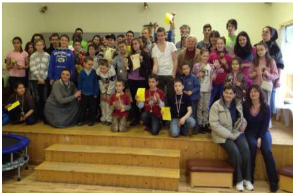
Mogyoród — A csocsóbajnokság résztvevői és szervezői.