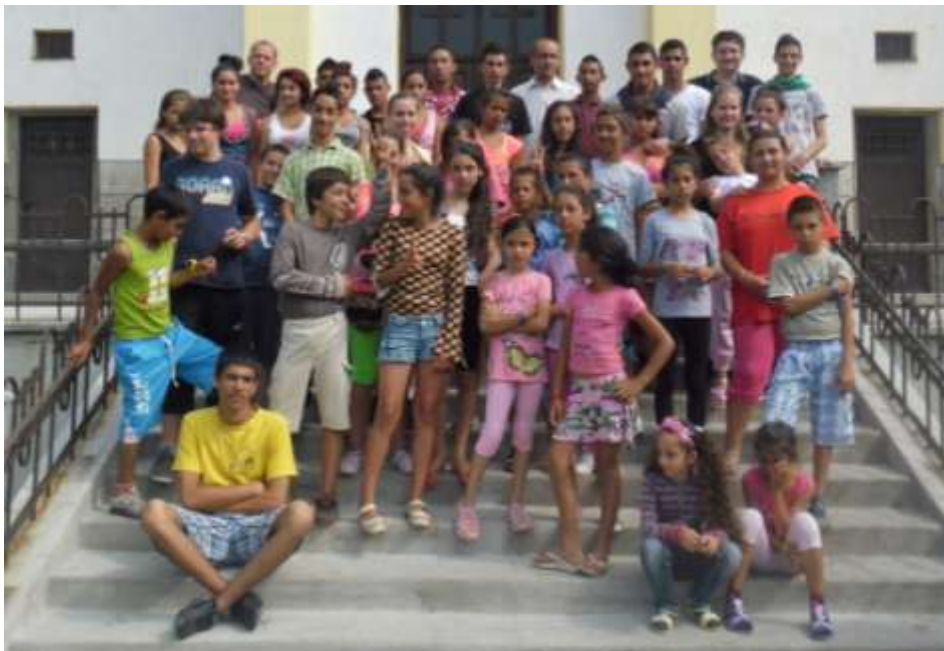
Nyári napközi oratórium Balajton

volt. Meg voltak szeppe. De az ismerkedős játékok után feloldódott a hangulat, sok új barátságot kötöttek és a csendet lassan nevetés váltotta fel, napról napra hangosabbak lettek. Hetente kétszer volt szentmise, egy nyitó és egy záró. Délutánoként volt kézműves foglalkozás és jutott idő a szabad tevékenységekre is. Sokan megtanultak egykerekűzni, gólyalábazni. A Szalézi Szent Ferenc Gimnáziumba is átmentünk a gyerekekkel, ahol érdekes kémiai és biológiai kísérleteket láthattak. Gimnáziumi tanáraink benéztek hozzánk napközben, segítettek, előadást tartottak. Kirándulni is voltunk. Első héten a nagyok mentek a Mohosi tavakhoz, lápokhoz, második héten pedig mi a kicsikkel a Lázberci-tónál sétáltunk az Upponyi-szorozhoz. Voltak vizes játékok, ami a nagy meleg-