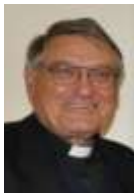
Előttünk jártak P. Havasi József SDB rovata