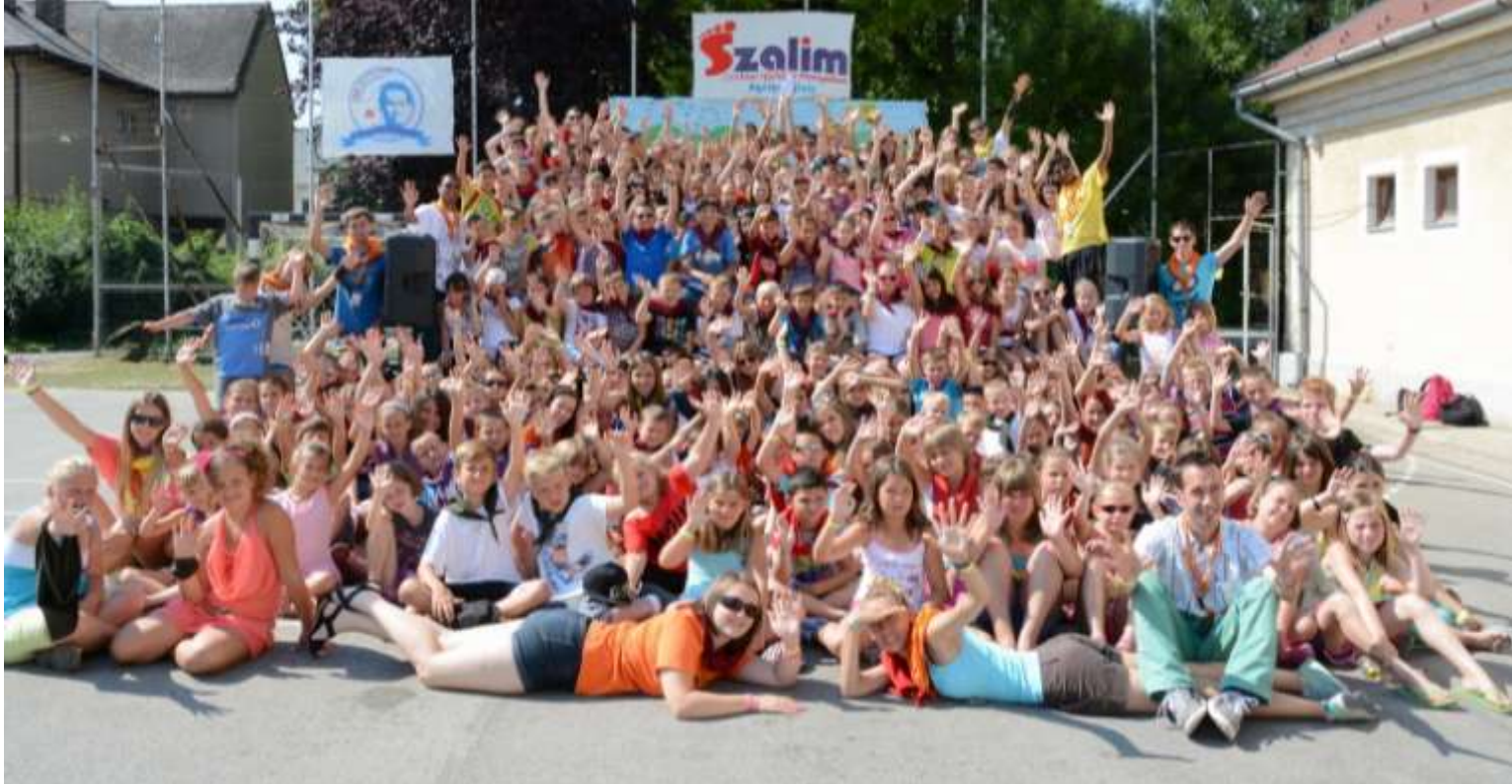
Nyergesújfalun túlléptük a bűvös kétszázat! Résztevőkben, kalandokban és vidámságban nem volt hiány

záróprogram egy misével kezdődött, amit Pali atya tartott. Felolvasta nekünk Don Bosco levelét, melyben jó tanácsokat kaptunk a nyárra. Ezután következett a záróműsor, amin a gyerekek bemutatták, mit tudnak. A végén a csapatok megajándékozták az animátorokat, és végül közösen eresztettük fel léggömbjeinket, melyeken üzenetet írtunk Don Boscónak.