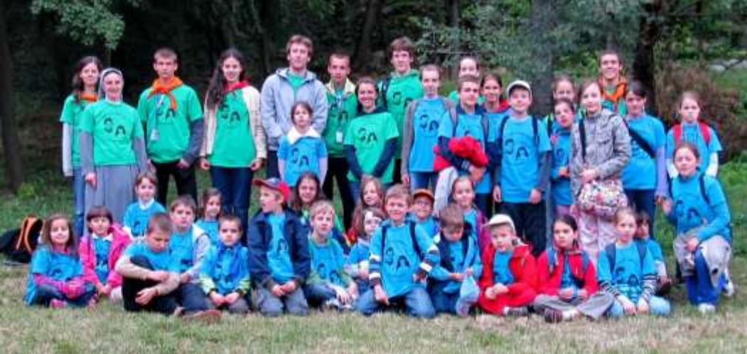
A pesthidegkúti nyári napközi oratórium