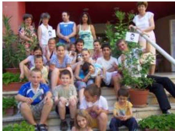
Pécs - a napközisek

Az animátorok segítségével minden nap felelevenítettük egy kis részletet a szaléziak letelepedésének történetéből. Játékból és szórakozásból nem volt hiány: sorversenyek, csapatversenyek, akadályversenyek, különböző tematikájú műhelyek, bajnokságok, számháború és az idén debütáló „Egy perc és nyersz” játék csak egy része annak a program-