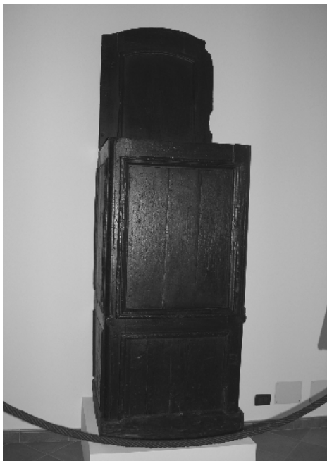
A pulpitus, ahonnan Don Bosco jóéjszakái elhangzottak

Mondatát nagy nevetés követte. Ezután folytatta beszédét: