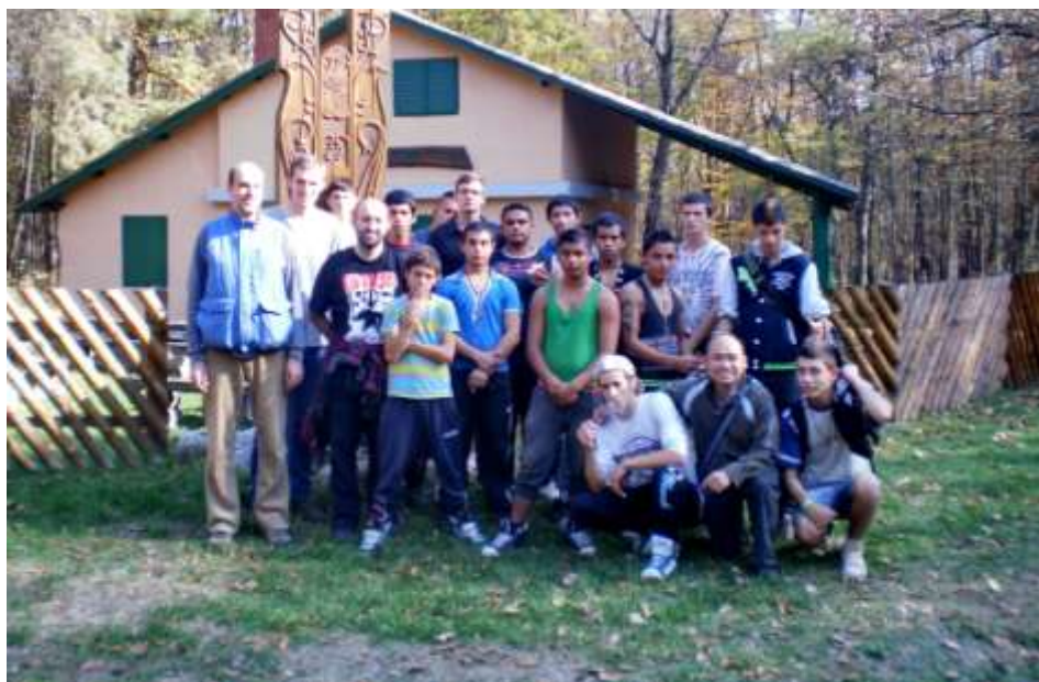
Kazincbarcikán a kollégisták kéthetente kirándulásokat tesznek a környéken