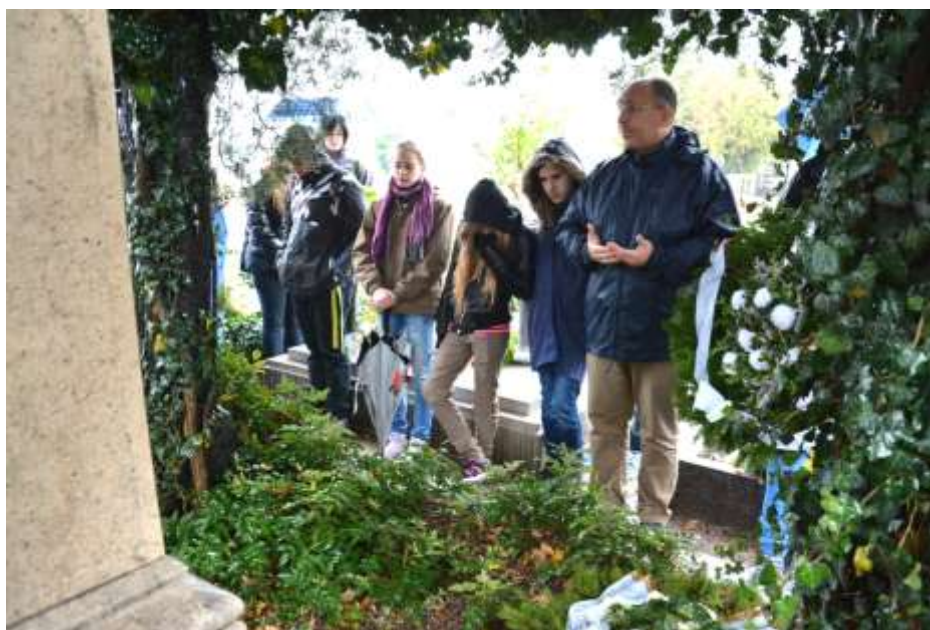
A szalézi iskolák diákjainak képviselői gyalogosan zarándokoltak el Nyergesújfaluról Péliföldszentkeresztre a szaléziak letelepedésének tiszteletére.

Sándor István üveglak – Nyergesújfalun a Szent Mihály-templom sekrestyéje fölött új üveglak pompázik: Bol-