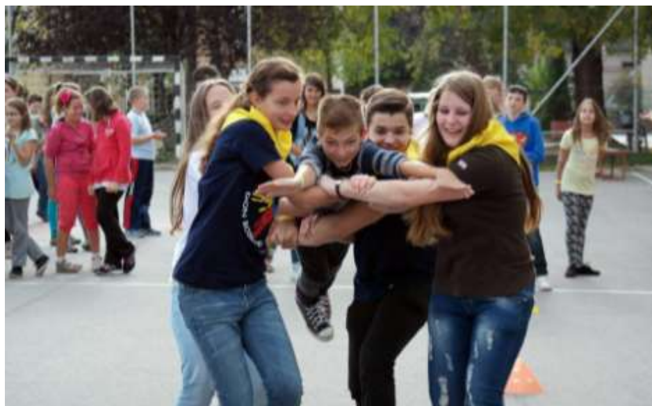
Nyergesújfalu – Az őszi oratóriumi játéknapokon összesen 137 helyi és környékbeli kisdíák vett részt.

Őszi szünet oratóriumi játéknappal – Nyergesújfalun ismét gyermekzsivajtól volt hangos a Szalézi-Irinyi Középiskola az őszi szünet első két napján: a ragyogó napsütésben, szinte nyári-as melegben összesen 137 általános iskolás korú gyermek érkezett, nem csak helyből, hanem a környékbeli településekről is az őszi oratóriumi játéknapokra.