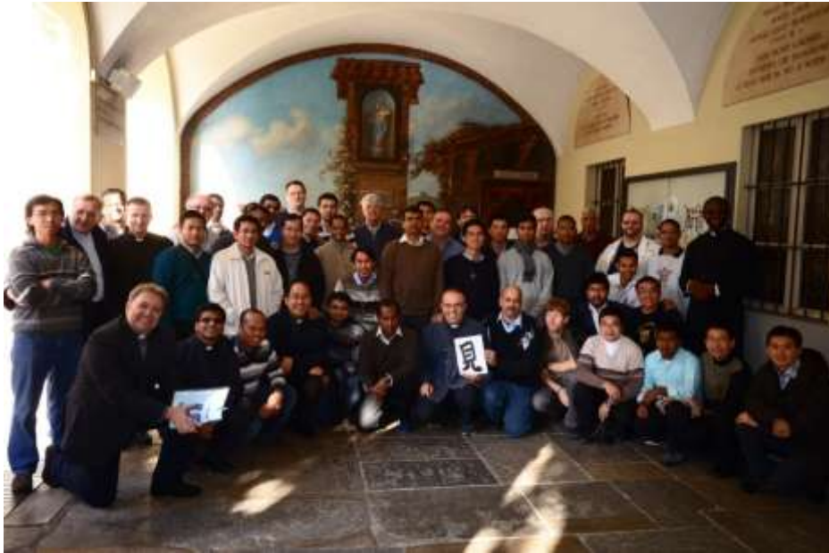
Torino — A hazánkban szolgáló tizenegy misszionárius közül idén kilencen vettek részt a találkozón.