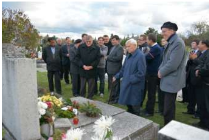
Derűs emlékezés a régiekre