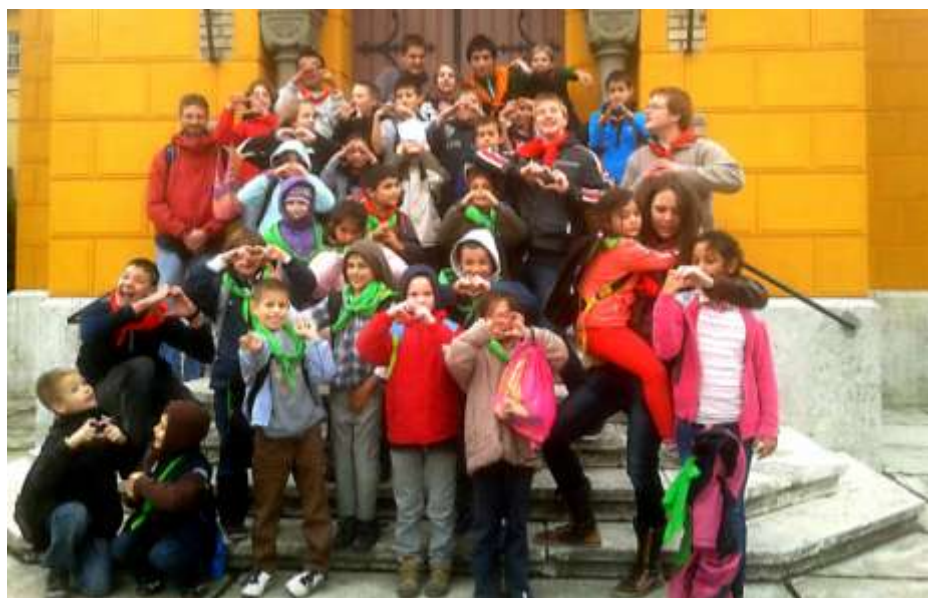
Óbuda – Őszi oratórium családias légkörben