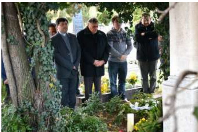
Zafféry atya sírjánál a nyergesújfalvai temetőben