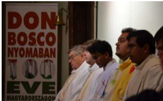
Don Bosco nyomában 100 éve...