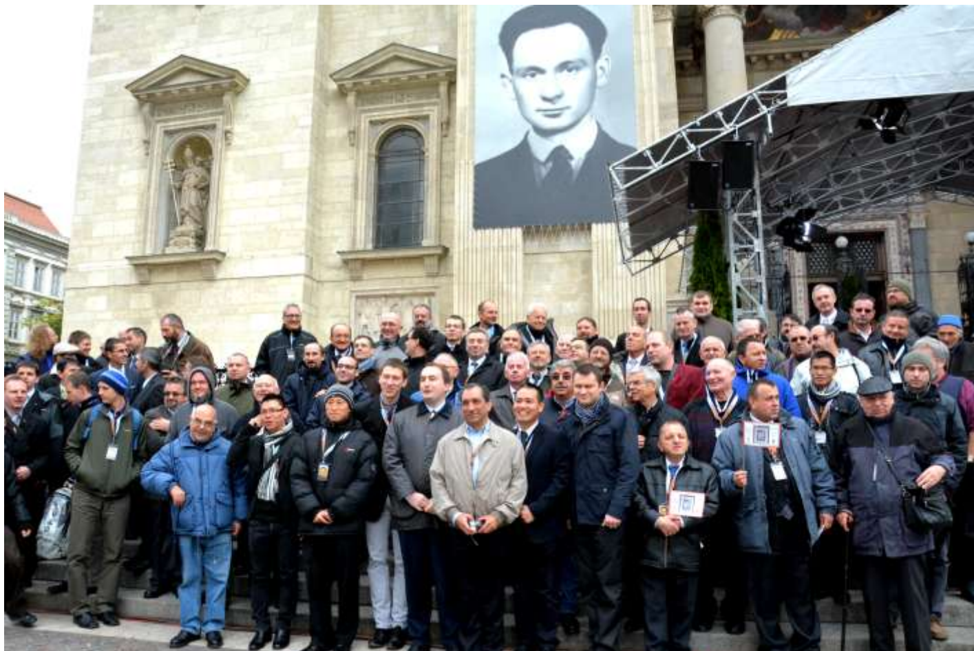
A szalézi testvérek Sándor István boldoggá avatásán

Ez a találkozó volt az egyik válasz a rendfőnök felhívására, hogy megünnepeljék Sándor István boldoggá avatásának ajándékát, megújítsák elkötelezettségüket és elősegítsék a szalézi testvéri hivatások kialakulását és megélését.