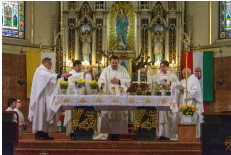
Ünnepi ráadás a máriaremetei kegytemplomban

A mai ünnep – nyilván nemcsak nekem, hanem sokunknak – a felelevenítés, rácsodálkozás és a megújulás ünnepe volt. Viszszatekintő vizsgálódás, emlékezet, ihlet. Kölesőnévé Kossuth Lajos frappáns hasonlatát, amellyel Széchenyi István gróf tiszteletének adózott: ujjainkat megpróbáltuk a „kor ütőerére” tenni, hogy megérthessük annak nemes „lüktetését”. Meggyőződésem szerint ugyanis innen, az 1913. november 6-i szalézi bevonulást előkészítő és az azt követő események, körülmények, a résztvevő személyek és lelkiségük felfedezéséből jelentős kegyelmi erő nyerhető saját identitásunk értékelésére és mélyebb megalapozására. A centenáriumi év már eddig is számos fronton bizonyította előttem, hogy a magyar szalézi ös- és hőskor lelkületének hatása lehet és van korunkra.