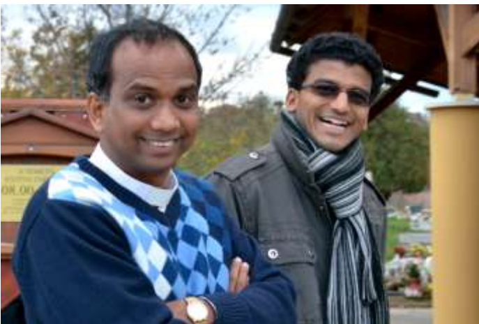
A misszionáriusok is „magyarként” ünnepeltek.