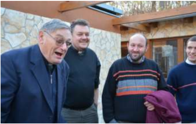
A szalézi vidámság nem csak reklámszlogen.