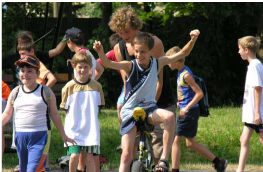
SZALIM „road-show” Szombathelyen