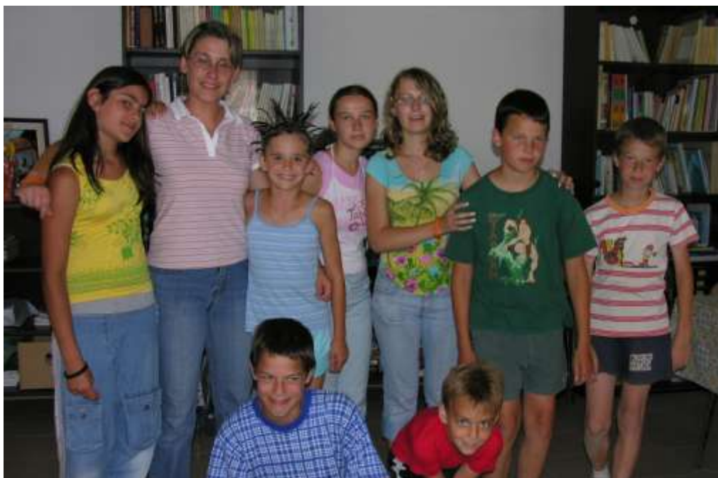
Animátor a gyerekekkel a mogyoródi nyári napköziben