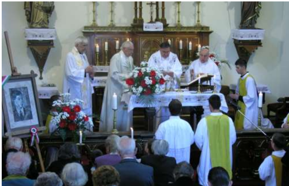
Clarisseum - emlékmise Sándor István és a szalézi áldozatok tiszteletére