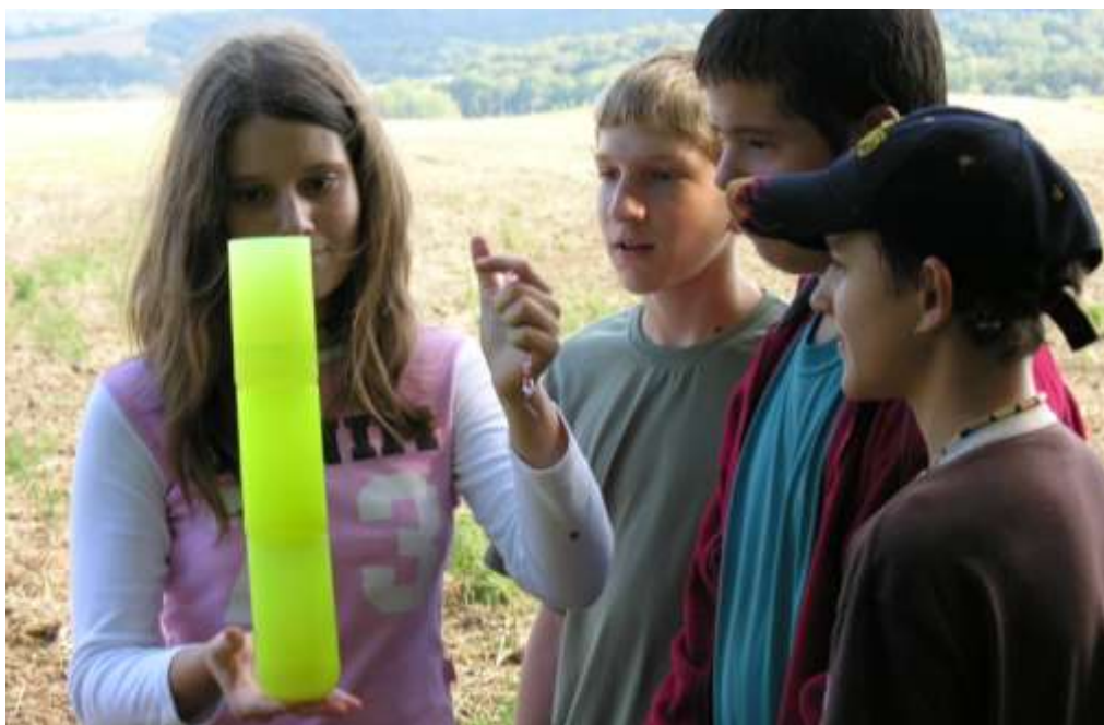
A Szalézi-Irinyi Középiskola tanulójának gólyatábora Pélifyöldszentkereszten