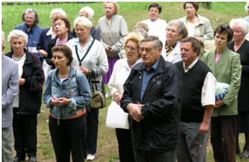
Szalézi munkatársak lelkigyakorlata Péliföldszentkereszten