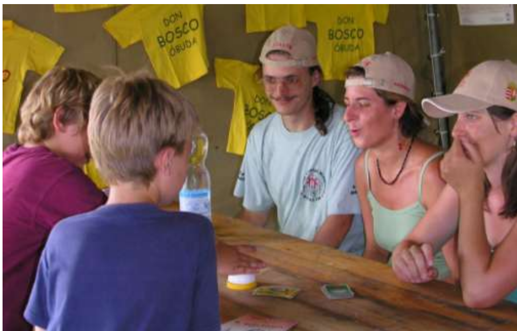
Animátorok az apostagi „Ladik” fesztiválon