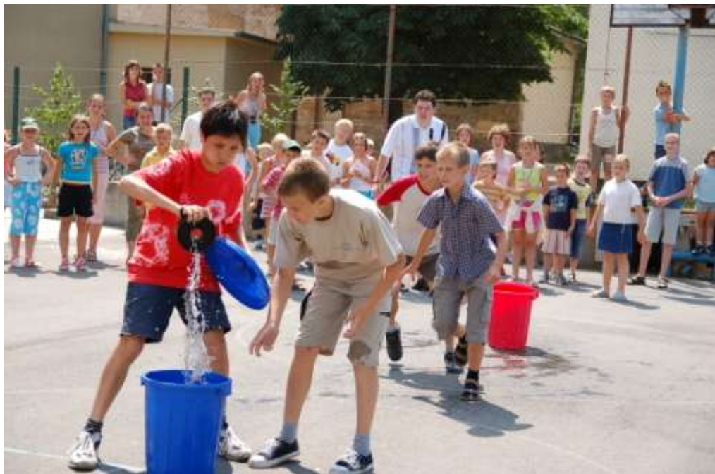
Nyári napközi Balassagyarmaton