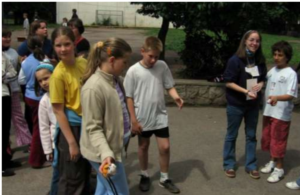
Vidámság napja Albertfalván