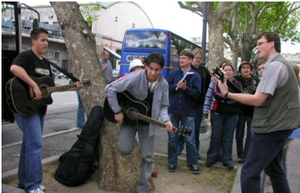
A nyergesújfalui sport-oratórium kirándulása Triesztbe