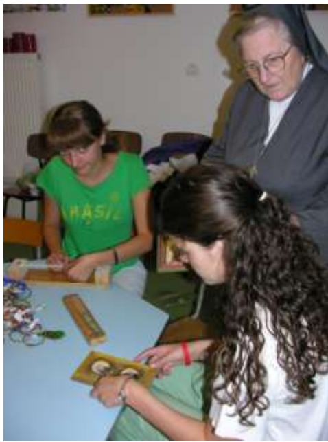
Kézműveskedés a mogyoródi nyári napköziben