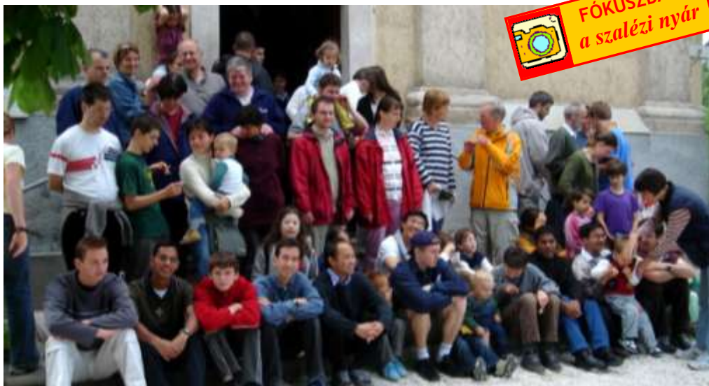
Óbudai családok pünkösdje Péليفöldszentkereszten