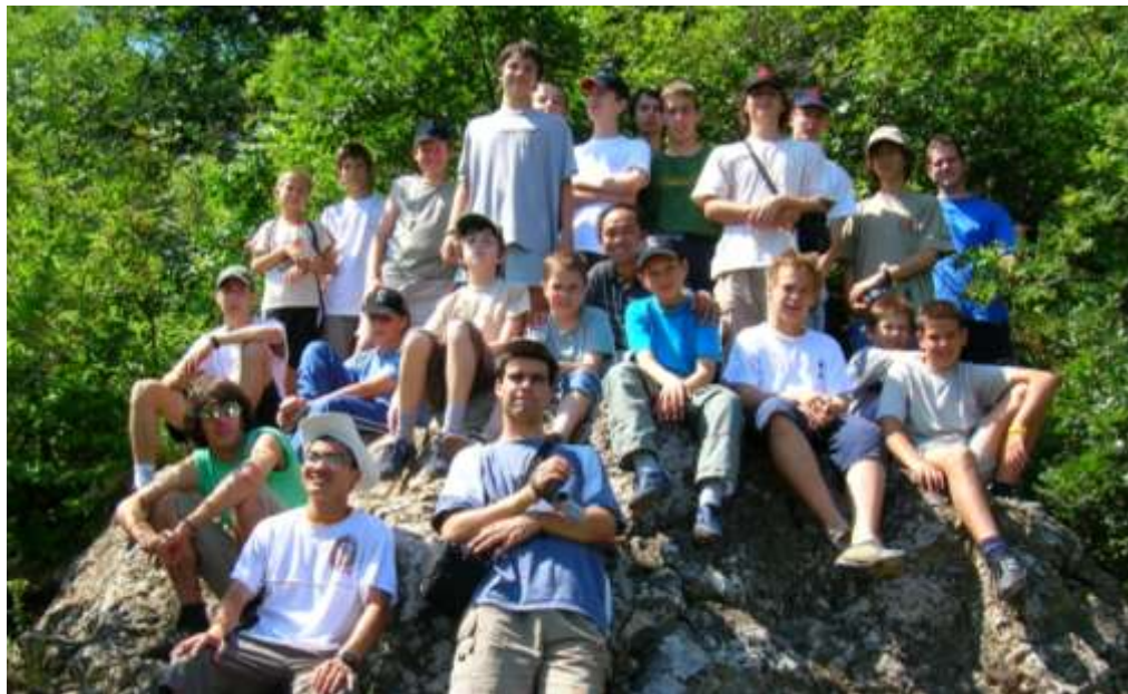
Ministránstábor Péليفöldszentkereszten - kirándulás Öregkőre