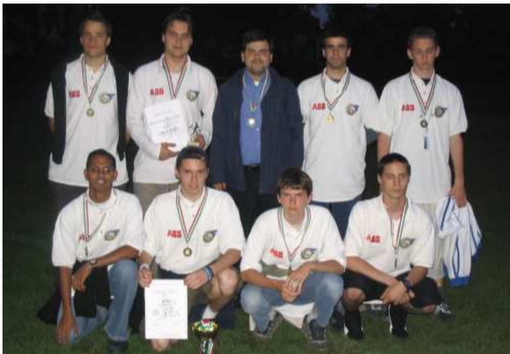
SCO - Szalézi Calcio Óbuda