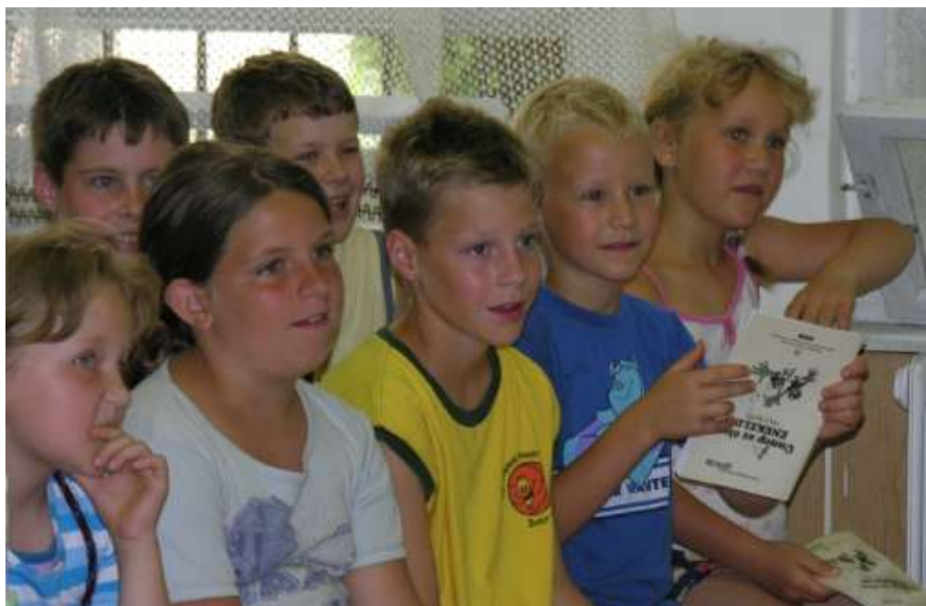
Nyári napközi Szombathelyen