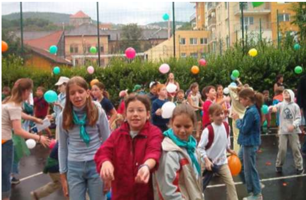
Nyári napközi Óbudán