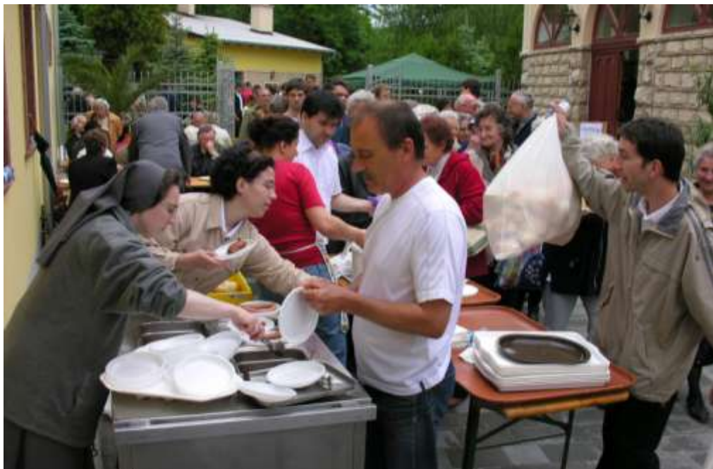
Együtt ünnepel a Szalézi Család - Segítő Szűz Mária búcsú Pélifyöldszentkereszten