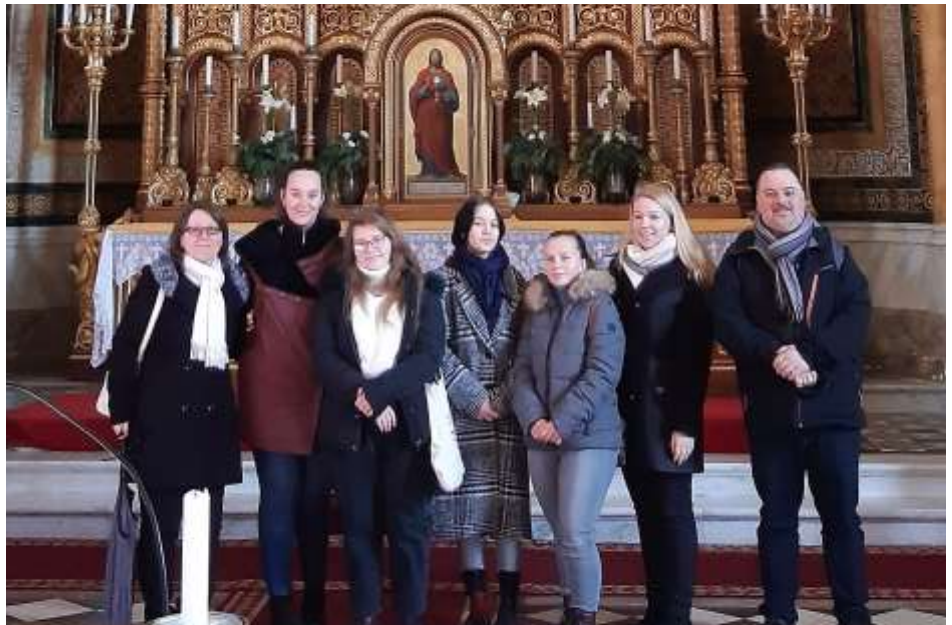
A vácszentlászlói és turai animátorok Fótton jártak

Több fiatal is azzal a céllal jött el erre a hétvégére, hogy kicsit csöndben legyen, Istenre figyeljen. Úgy gondolom, hogy mind a módszerek, mind a hely lehetővé tették ezt. Este jött minden lelkigyakorlat fénypontja: a szentségimádással egybekötött gyónási lehetőség. Számomra öröm volt látni a sok fiatalot, akik egymást váltva igyekeztek menni gyónni. Amikor