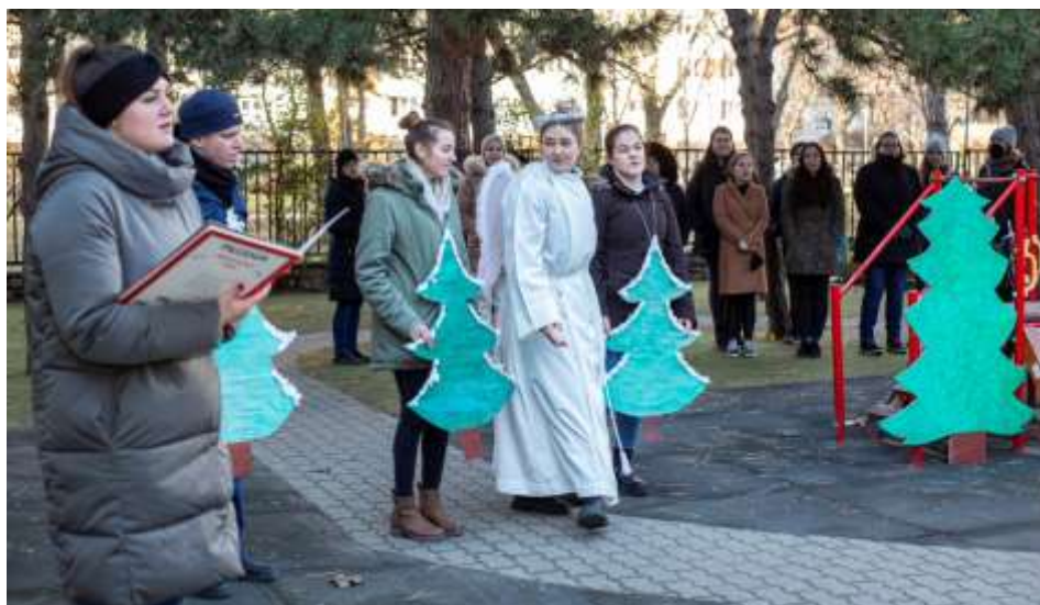
A SZÁMALK-Szalézi diákjai a közeli óvoda kicsinyeit örvendeztették meg

bennünket arra, hogy a csoda, amit várunk, közeledik. Ezúton is köszönjük ezt az élményt diákjainknak és a segítő tanároknak is!