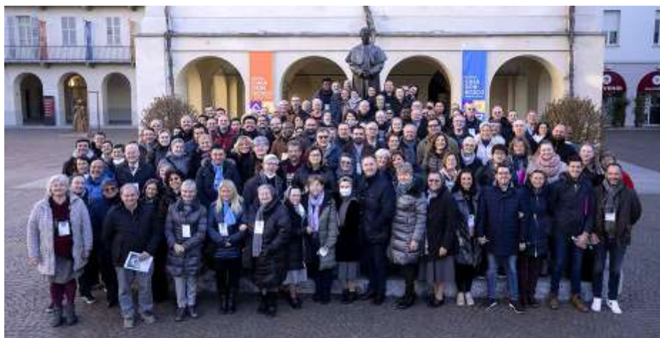
A Szalézi Család Lelkiségi Napjainak résztvevői