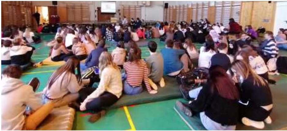
Nyergesújfalu – Don Bosco háziverseny

szülés jegyében zajlottak. Bár sok a beteg, mégis 44 csapat, mintegy 150 résztvevő jelentkezett két kategóriában, hogy Kahoot feladatsorban adjanak számot tudásukról. A mobiltelefonok csatlakozása után megkezdődött az 50 kérdésből álló versenyjáték, ahol négy lehetőség közül választhatták ki a résztvevő csapatok a helyes megoldást. Bár 30 másodpernyi ideje mindenkinek volt, de a gyors reakció előnyt jelentett. Az imádság keretezte hittan háziverseny közönségben, vidámságban, összpontosításban, egymásra figyelésben telt, melynek végén kínálásként pogácsa és egyéb apró péksütemények kerültek az asztalra. Az eredményt a Don Bosco ünnepségen tudták meg a résztvevők.