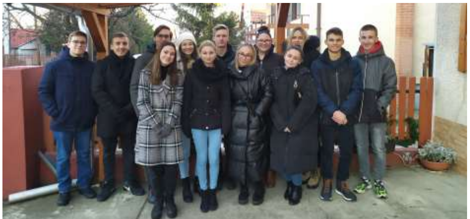
Balassagyarmati fiatalok „csoda csapata”

kijöttek, mindenki sugárzott az örömtől és a kegyelemtől.