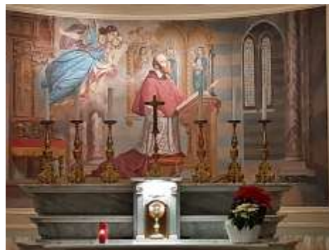
A Szalézi Szent Ferenc-templom oltárképe