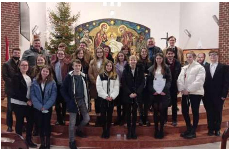
Kazincbarcika – Liturgikus felolvasó verseny résztvevői

A versenyzők először egy általuk választott részletet olvastak fel Szent Pál apostol valamelyik leveléből, majd egy rövid szünet után jött az úgynevezett „kötelező” szöveg: Máté evangéliumá-