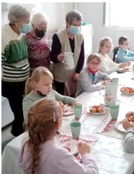
Clarisseum – Uzsonna a gyerekekkel

Hírek a Clarisseumból – Van nekünk is némi hírünk, bár kicsi a közösségünk, de éppen beleillünk egy nagy Családba... Tehát: az adventi készülődésünket idén egy kis szerdai imádsággal igyekeztünk