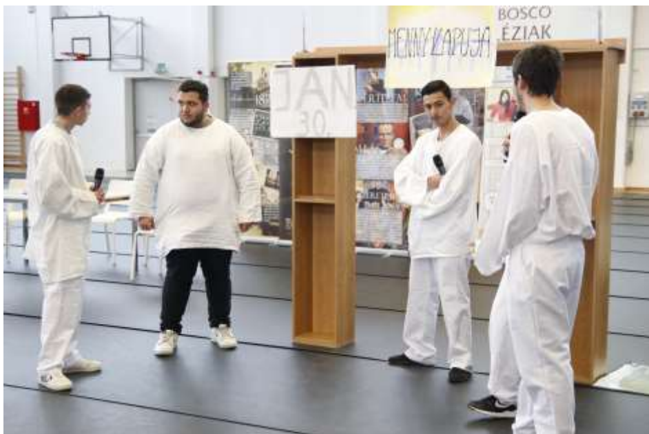
„Az angyalok szabadságra mennek” a kazincbarcikai kollégisták előadásában