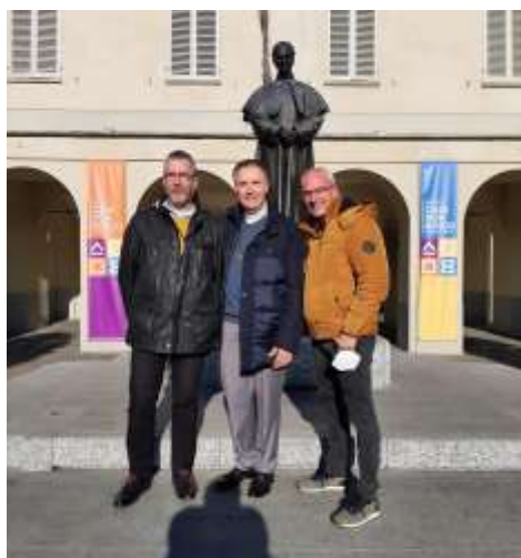
Kötelező közös kép Don Boscóval és tizedik utódjával