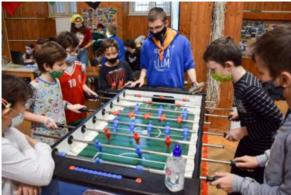
Óbuda – Don Bosco Csocsóbajnokság