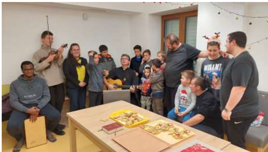
Kazincbarcika – Oratórium a város szívében