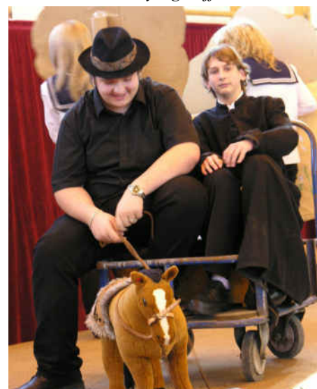
▼ Óbuda, központi ünnepség - a szombathelyi táncosok