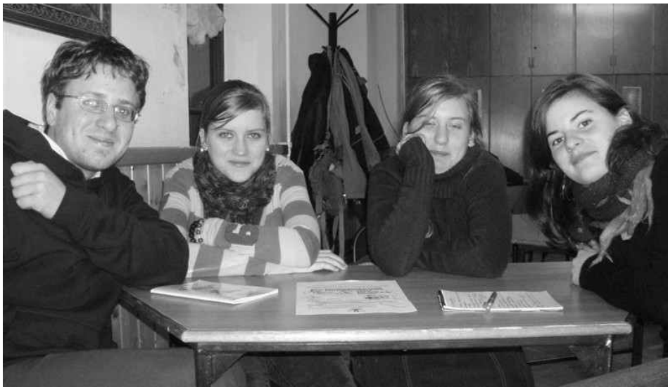
▲ Óbuda – Animátortalálkozó - Január 13-án az óbudai oratórium kultúrtermében találkoztak az aktív és a leendő szalézi animátorok. Ezzel a néhány órás közös programmal indult el az újoncok képzése és a tavaszi teendők rövid tisztázása.