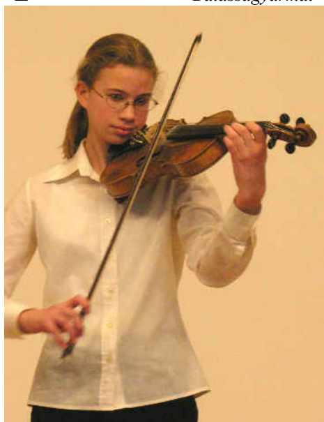
A Szent Péter és Pál iskola tanulója