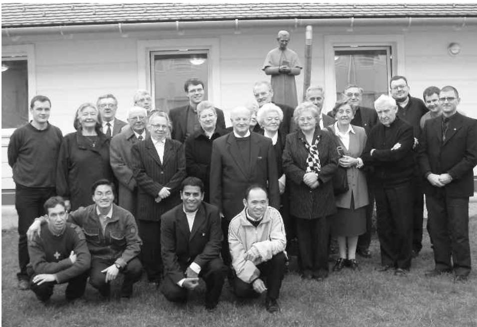
▲ Közös fotó a szaléziak és szülők találkozásáról

A február 10-én megrendezett farsangi bálunk idén nem várt érdeklődést és sikert hozott. A szereplők között voltak néptáncosaink, missziós rendtársaink, zenekarok és énekkarok. A rendezvényt élőzene kísérte, amely gondoskodott a talpalávalóról. A szünetben tombolára is sor került, ami még jobban felélénkítette a jelenlévő 180 ember hangulatát.