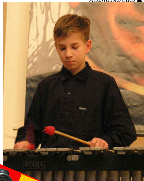
Szent Péter és Pál iskola tanulója