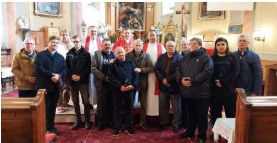
Kazincbarcikai férfi zarándoklat Abasárra