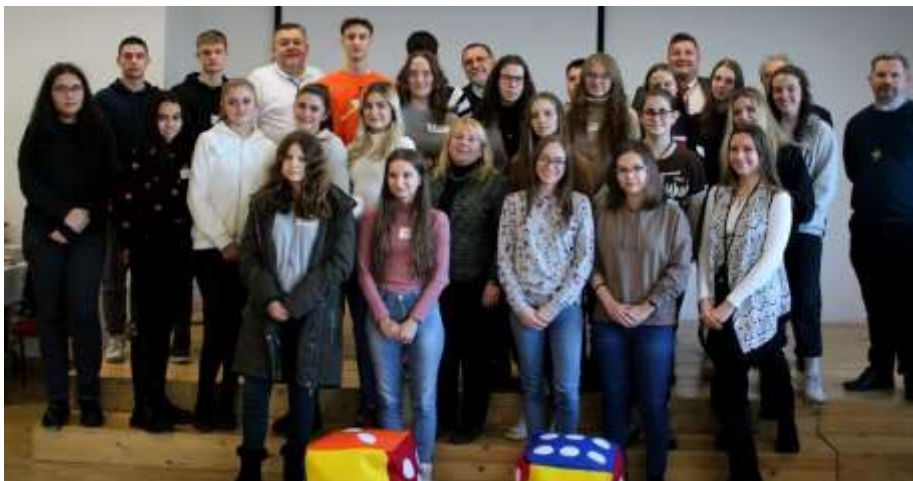
A kazincbarcikai Don Bosco verseny résztvevői

„Az evangélium a hit könyve, hitelesen őrzzi Jézus arcát és minket is élő hitre akar elvezetni” – ezzel a mottóval indult 2023. január 26-án, csütörtökön 17 órától a bibliakör Kazincbarcikán, a Don Bosco Sportközpont emeleti termében. Az alkalmakat P. Ábrahám Béla szalézi rendház-igazgató vezeti. A két januári bevezető előadás után öt interaktív előadás következik, amelynek keretében közösségi feldolgozással ismerhetik meg a jelenlévők