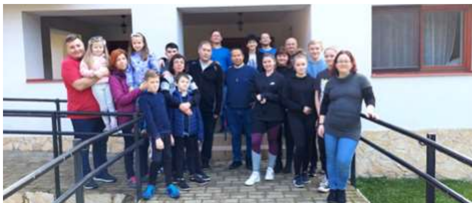
Kazinbarcikai egyházközség őszi családós tábora