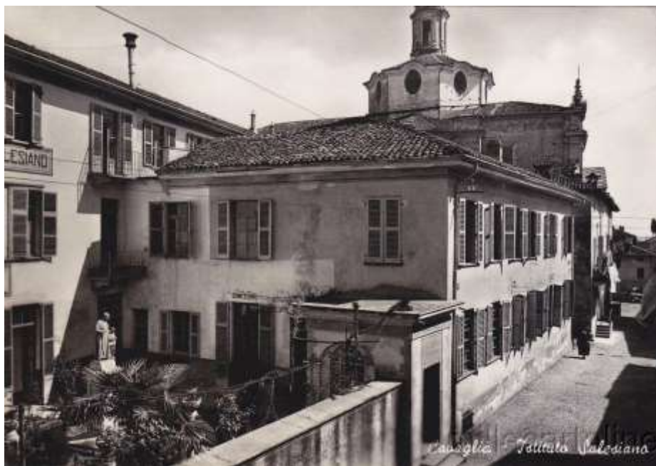
Ebből az épületből indult 110 éve a magyar szalézi mű.