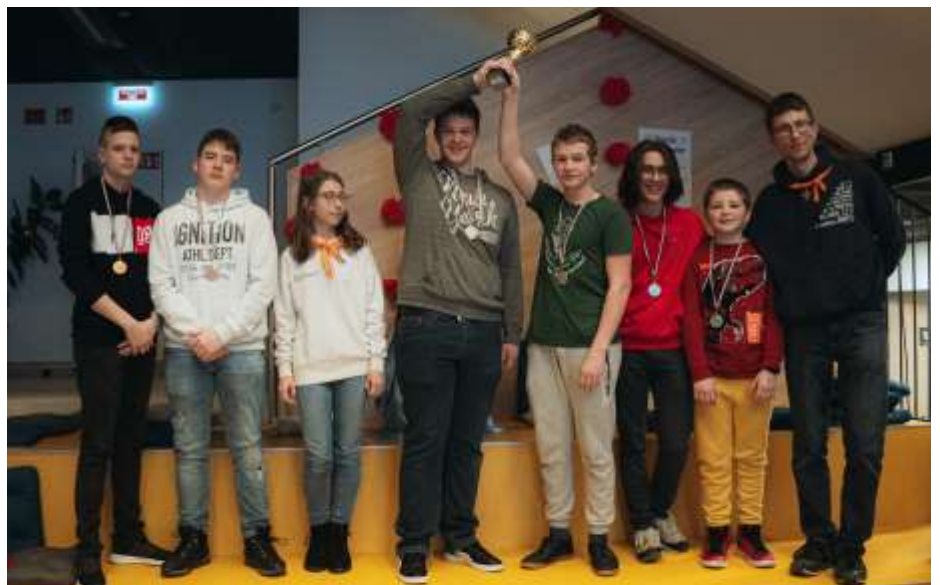
Óbuda – A XII. Don Bosco Csocsóbajnokság legjobbjai