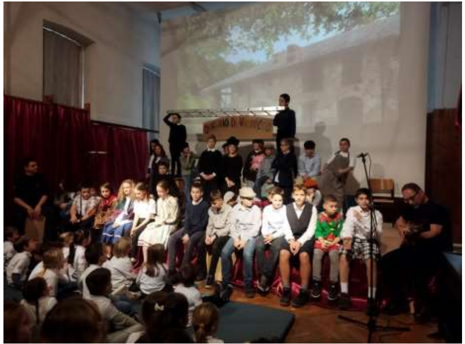
Az ünnepi műsor része volt egy kedves színdarab Don Boscóról

Konkrét példája ennek az Óbudai Szent Péter és Pál Szalézi Általános Iskola és Óvoda. A mintegy 300 gyermeket szám- láló intézmény idén január 27-én tartotta a hagyományos Don Bosco napot, mely- nek keretében az iskolai osztályok külön- böző produkciókat adnak elő a tanáraik- nak és a szüleiknek. Volt szerencsém részlet venni ezen az ünnepségen, amely valóságos csoda volt. Az egy dolog, hogy a műsorban szinte minden óvodás és diák szerepet kapott. Az már egy má- sik, ahogy, amilyen lelkesedéssel, örömmel és szívvel vetették bele magukat az ünnepi előadásba.