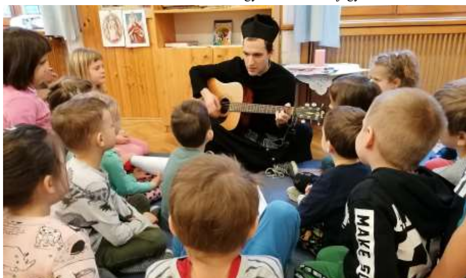
Egy mai Don Bosco az óbudai óvodások között