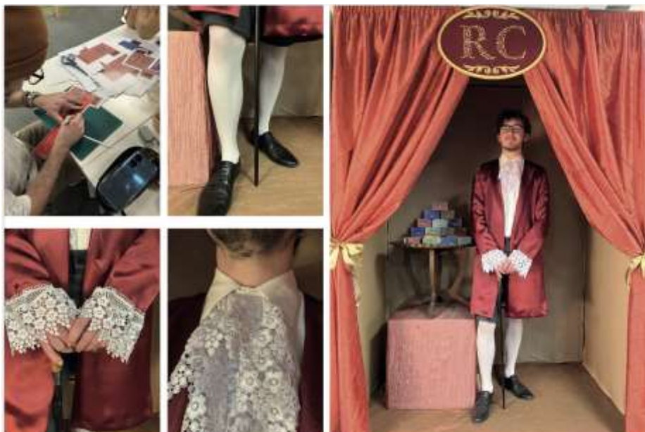
Viselettörténeti vizsgamunka a SZÁMALK-Szalézi Technikum és Szakgimnáziumban