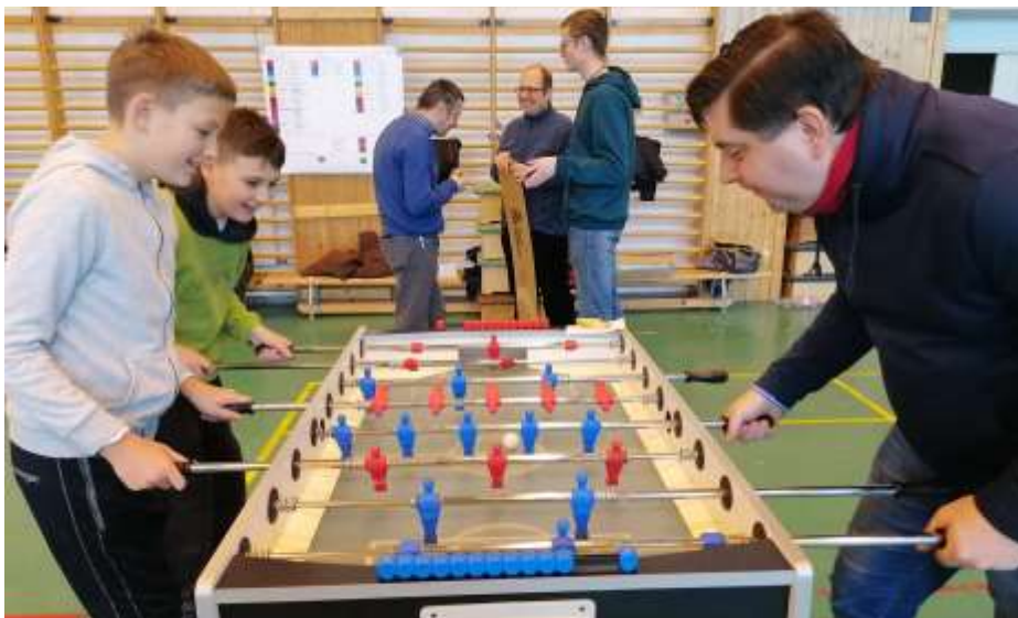
Nyergesújfalun a KINCS Kupával kezdték a farsangot

Karácsonyi időszak Balassagyarmaton – A balassagyarmati Don Bosco Oratórium a november-decemberi időszakban is jobbnál jobb programokkal várta a gyerekeket és az animátorokat egyaránt. Ebben az időszakban elkezdődtek a próbák a karácsonyi kántálásra, Jézuskavárásra és a betlehemezésre, amelyekben többnyire az animátorok szerepeltek, a kántálás esetében a temp-