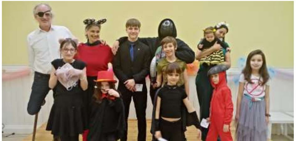
Clarisseum – I. Claris Farsangi Mulatságok