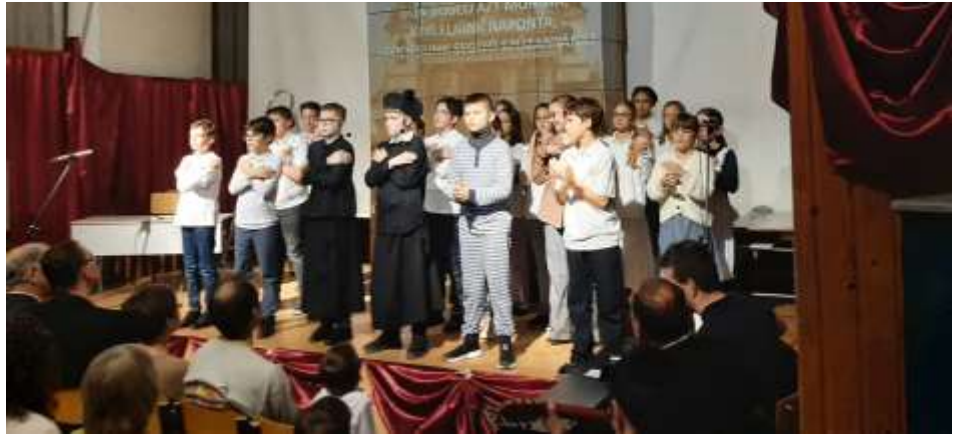
A Péter-Pál iskola tanulói jelentet mutatnak be Don Bosco életéből

Iskolánk és óvodánk közössége egy egész hetet szentelt a Don Bosco emléknapi alkalmából tartott gálára, egy hétig betekintést kaphattak Don Bosco életéből és tanításaiba.