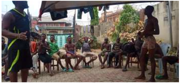
A szaléziak foglalkoznak az utcán élő fiatalokkal Lagóban