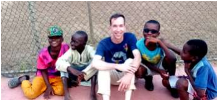
Ashaiman (Ghána) környékén

támogatja az iskoláinkat, főleg a tanárok fizetésével, hiszen az iskola az állam szerepét veszi át, sőt, magasabb színvonalon tanít, így országos szintű a beiskolázás, már nem csak utcagyerekek laknak a szaléziak intézményeiben, hanem kollégisták is, akik akár tandíjat is fizetnek. Így könnyebb is az integráció számukra, erre ügyesen figyelnek a szaléziak: minden tanuló egyenruhát kap, érdekes volt látni a különböző napok különbö-