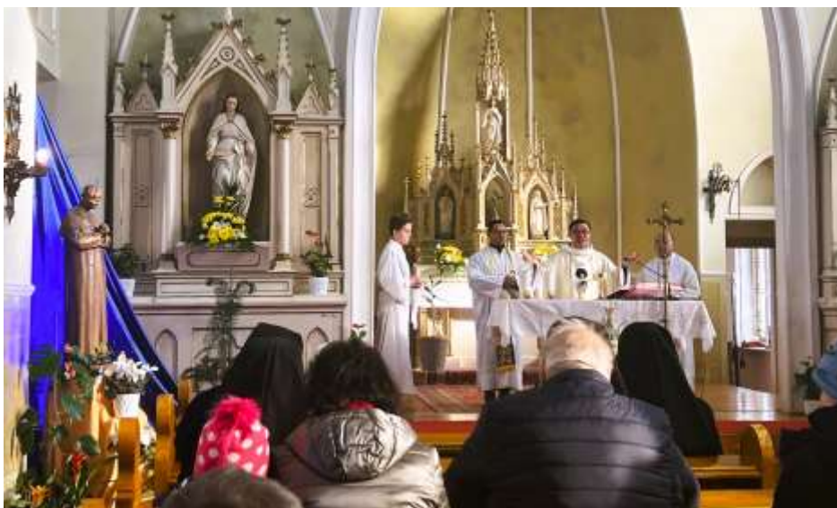
Újpest-Megyer – Ünnepi szentmise Bosco Szent János tiszteletére

Clarisseumi hírek – A Korniss Klára Gyermekekotthonból 2023. december 10-én kiköltöztek a nehéz sorsú lányok. Az épületből folyamatosan pakoltak, és hamarosan következhet a teljes épületgyűjtés, a főépület, valamint az udvaron található cserkészház, műhely és iskolaépület átvé-