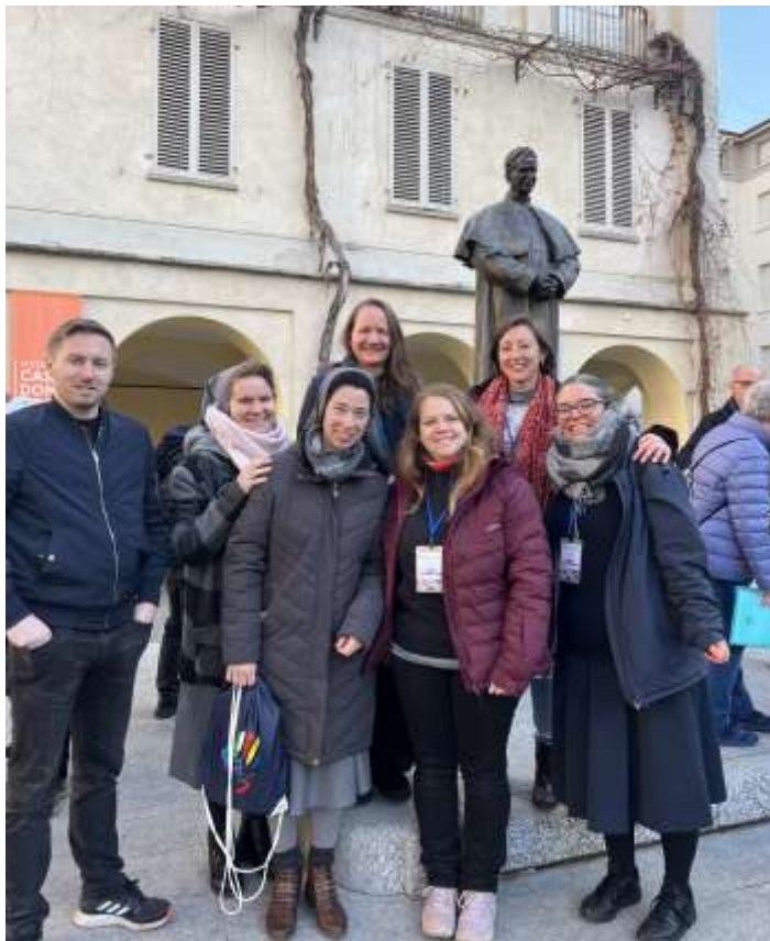
A magyar küldöttség Don Boscónál

nök a négy nap alatt végig velünk volt, közvetlensége, megosztott gondolatai mindenkit inspiráltak. A rendfőnök atya bemutatta a 2024-es évre meghirdetett strennát, majd fő feladatunkként azt kérte, hogy a hitünket, mint lángot őrizzük, mutassunk példát és ezzel kínáljuk fel az értékeinket másoknak is, mint részükre is lehetséges választást.