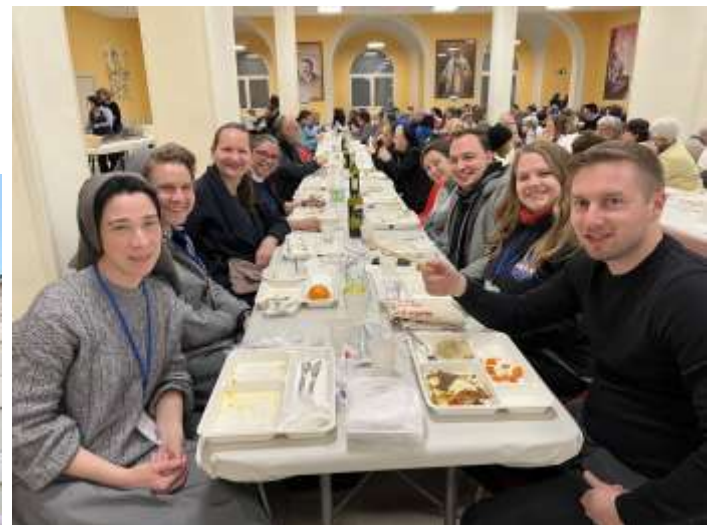
Közös ebéd Valdoccóban