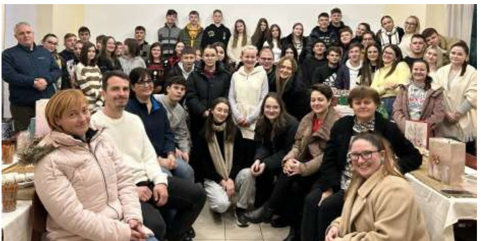
A balassagyarmati oratórium lelkes csapata