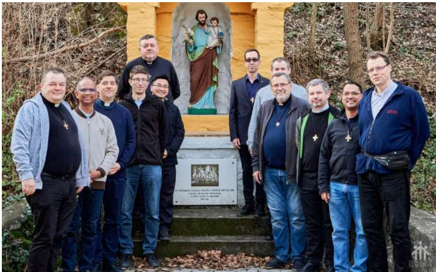
Pélföldszentkereszten tartották meg február 25. és március 1. között a 13. Tartományi Káptalant., amelyen tizenkét választott illetve hivatalból jelen lévő szerzetes vett részt