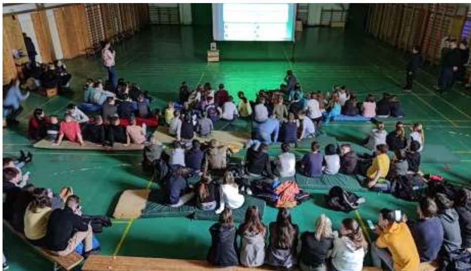
Nyergesújfalu – Don Bosco házi verseny a Zafféryban

December 8-án, Szűz Mária szeplőtelen fogantatásának ünnepén egy különleges oratóriumi nappal készültek a szaléziak, ahol részesei lehettünk egy adventi lelki műhelynek, meghitt, ünnepi szentmise és Szent Miklós érkezésének is egy igazán szívhez szóló színielőadással. Mindezekkel párhuzamosan már nagyban zajlottak az előkészületek a szinte már hagyománnyá vált pásztorjátékra/misztériumjátékra. A 2023-as évben két kiváló animátorunk és egy szalézi munkatárs főszervezésével és rengeteg segítséget nyújtó kéznek hála sikerült egy maradandó emlékekkel bíró, szentesti