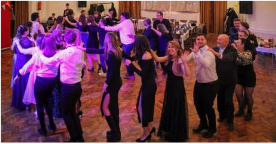
Szombathely – Ifjúsági bál az animátorok szervezésében

produkciónal előállni a nézőknek, melyben körülbelül harminc elszánt, kitaró és szerepelni vágyó gyermek mutatta meg tudását. Innen is köszönjük minden animátornak, munkatársnak, szülőnek, felnőttnek a munkáját legyen szó ételkészítésről, díszletről, technikáról vagy éppen egy buzdító ölelésről!