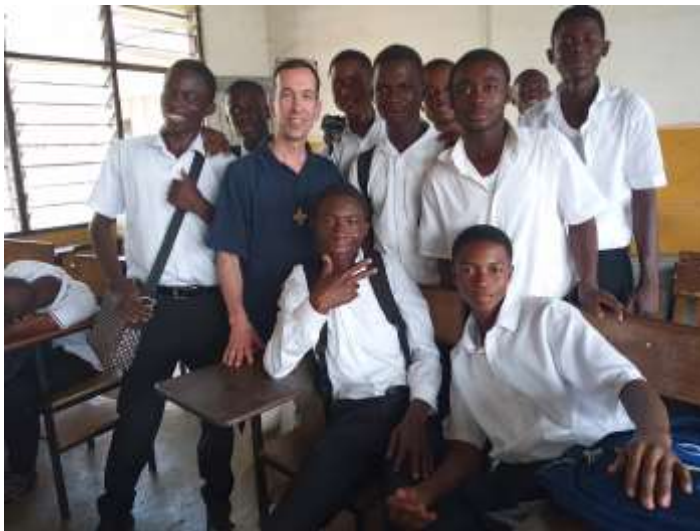
Odumasi (Ghána) környékén