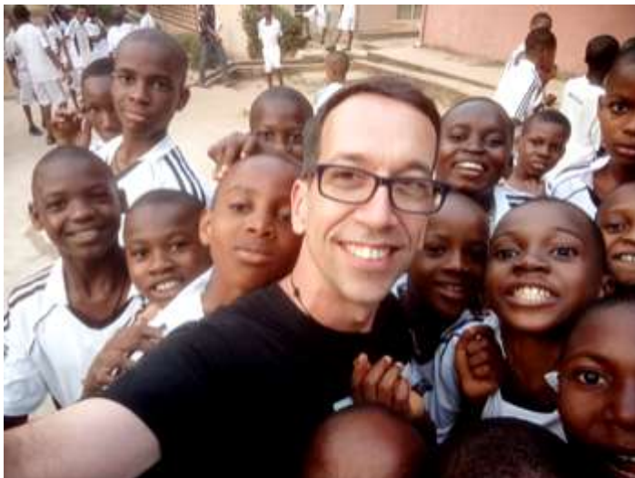
Don Bosco Secondary School, Ibolo Obosi – Onitsha