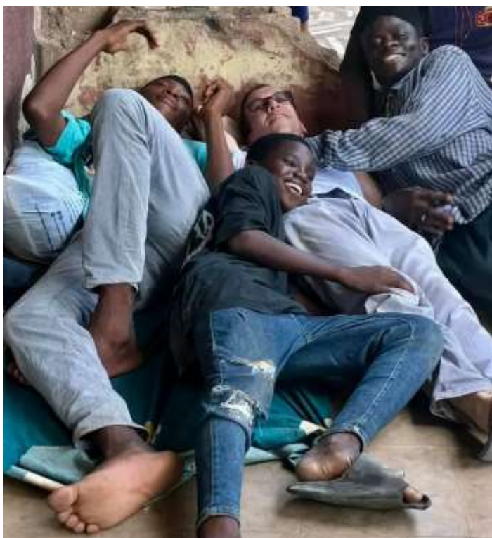
Utcagyerekek között Lagóban (Nigéria)