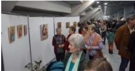
Festő szakos diákok kiállítása Kazincbarcikán