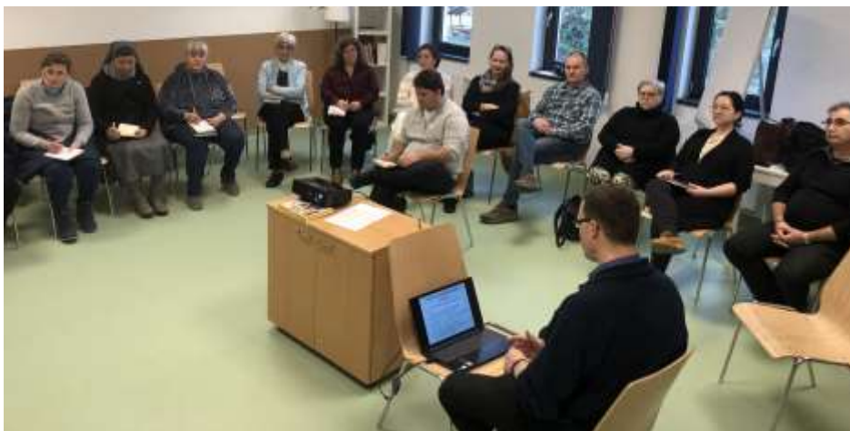
Lengyel Erzsébet SC