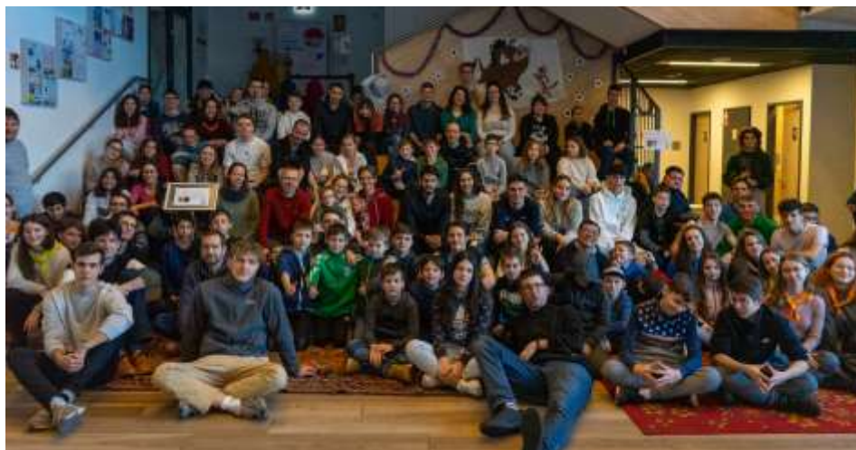
A XIII. Don Bosco Csocsóbajnokság résztvevői, a szervezők és a szurkolók

Óbudai Szent Péter és Pál Szalézi Általános Iskola és Óvoda