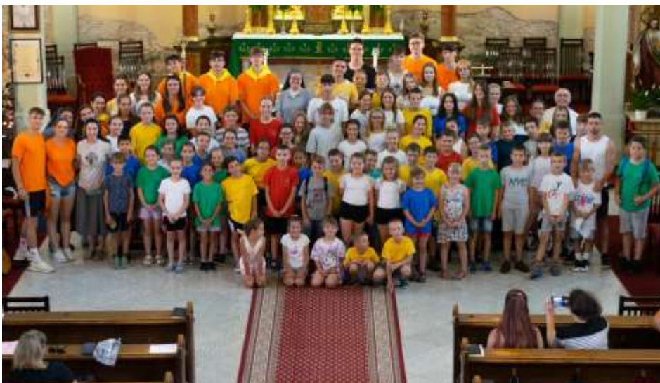
Mogyoródi Nyári Oratórium

A sok újdonság mellett a régi dolgok is megmaradtak. Sokat játszottunk, közösen imádkoztunk, voltunk kirándulni is Torda-