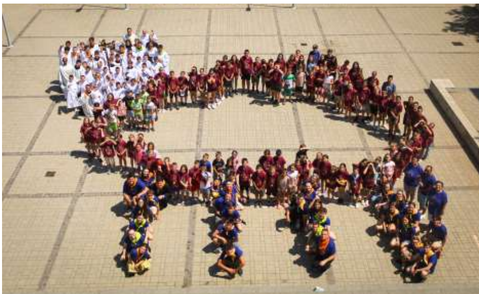
Szombathely – 32. Szalézi Nyári Oratórium

ra, amit sikeresen el is értünk, így elmondhatjuk, hogy a Balatont körbecikliztük, Istennek legyen hála!