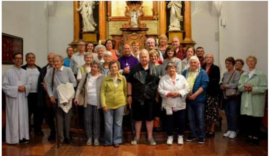
Az újpest-megyeri idősek csoportja Péli-földszentkeresztre zarándokolt

Végezetül átmentünk a Gerecse Natúrpark Látogatóközpontba. Ez egy csodálatos építmény, jó célra, csodálatos környezetben! És amint hallottuk Gézától a tájé-