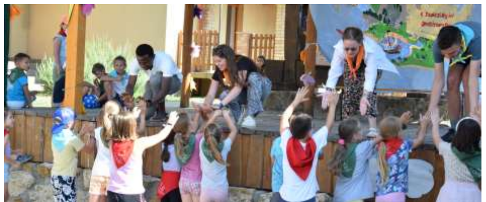
Baji Nyári Oratórium