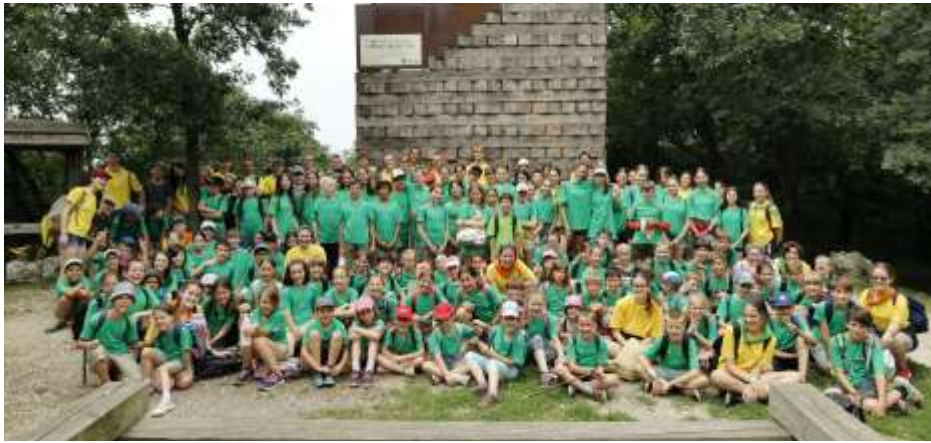
Pesthidegkúti Nyári Oratórium