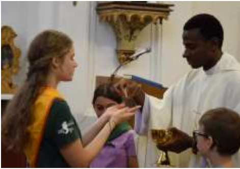
Animátor avatás Bajon

váltam animátorra a baji oratórium nyári táborában. Már nagyon vártam, hogy megkapjam a kendőmet, és büszkén mondhassam, hogy igen, lettem az animátori esküt. Számomra az animátorság egy erős kapcsolódópont Istenhez és az egyházhoz. Emlékeztet, hogy a hitem megélése nem egyedül rám és Istenre tartozik, mert keresztényként misszióm is van. Jézustól feladatult kaptam, hogy hirdessem az Ő szeretetét. Ennek a megerősítése az, hogy animátor lehetek. Hálás vagyok érte, hogy a szalézi közösség támaszt nyújt és erőt ad hozzá. Szerintem csodálatos dolog, hogy együtt élhetjük meg Isten kegyelmét és végtelen szeretetét.