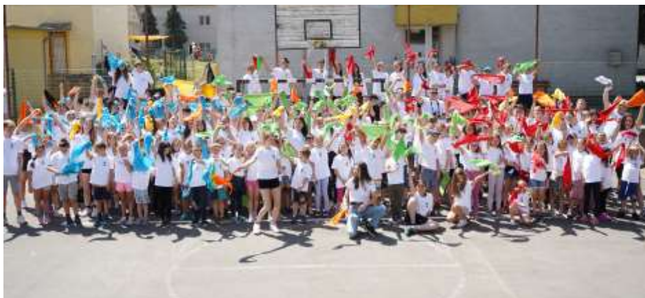
Balassagyarmati Nyári Oratórium

Merj állati nagyot álmodni! – Idén a Balassagyarmati Don Bosco Oratórium kéthetes nyári tábora július 1. és 12. között került megrendezésre. A gyerekekkel és az animátorokkal összesen körülbelül 250-en vettünk részt rajta és élményekkel teli két hetet töltöttünk együtt. Ebben az évben, a strenna alapján, az álmok és a célok álltak a táborunk középpontjában. Ezekről gondolkodhattunk a jelenetek és a napi imák során, és ezekről beszélgethettünk a csoportpercek alatt. Mindezek töltötték ki a délelőttiakat, majd