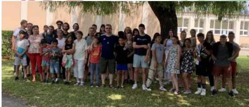
Nyárindító tanodai tábor Kazincbarcikán