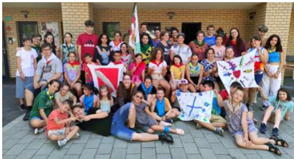
Óbuda – Tücsök tábor

nyárba, kezdve június utolsó hetével, amikor ismét megrendezésre került a Tücsök tábor. Hétfőn reggel vártuk az évközi oratóriumokban már megismert társaságot (akik közül többen anyaotthonból vagy nehezebb helyzetben lévő családokból érkeztek). A lelkes segítőknek hála szeretetteljes, családi légkör alakult ki a hét során. Különös hangsúlyt fektettünk arra, hogy a gyerekek jobban megtanulják felfedezni a magukban, illetve másokban rejlő értékeket és visszaszorítani a gúnyolódást. Ezt a színdarabokkal próbáltuk beléjük csepegtetni, melyek „A három testőr” című könyv alapján lettek bemutatva. A tábor különféle programjai is erre a vonalra épültek. Bevezettek minket a vívás rejtelmibe, sőt, mi magunk is megpróbálkozhattunk a sporttal; különböző helyekre látogattunk el, kézműveskedtünk, csoportperceken vehettünk részt. A hét fénypontja talán a látogatásunk volt Péli-földszentkeresztre, ahol egy kis lelki feltöltődés után még a tóban is csobbantunk egyet. Persze, nem