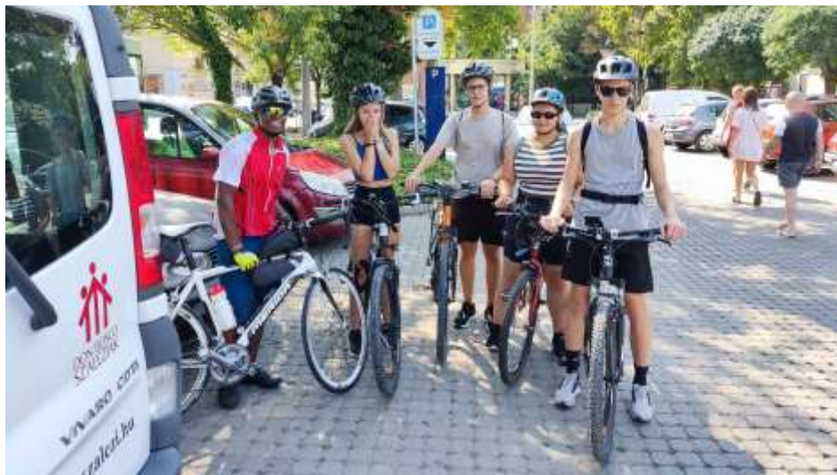
Nyergesújfalu – Bringával a Balaton körül

Mindezek után folytattuk utunkat Siófok-