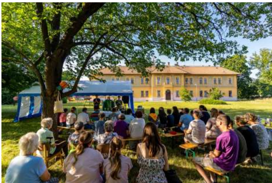
Családi nap a Clarisseumban