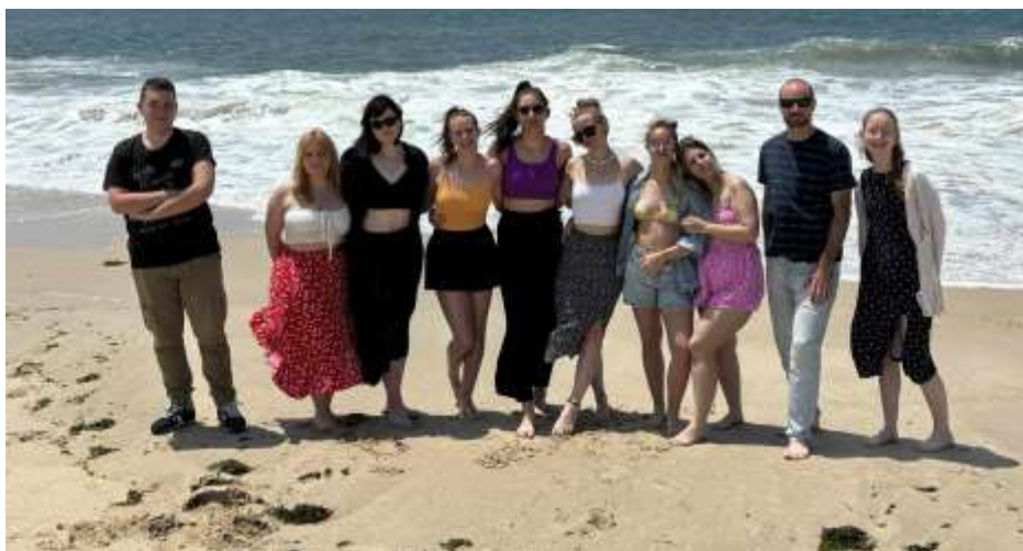
Metások portugáliai gyakorlaton

ge repülőre szállt és meg sem állt Faenzaig, a fajanszok városáig.