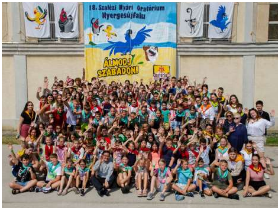
Nyergesújfalu – 18. Szalézi Nyári Oratórium

11 perc alatt be is telt! Egy hét lázas készülődés után aztán pontban július 1-én elstartolt a 18. Szalézi Nyári Oratórium Nyergesújfalu. „Álmodj szabadon!” – hangzott a mottónk az idei évben. Rióba álmodtuk magunkat ebben a két hétben, és már az első nap is szuper karneváli hangulatban telt a főszereplővel, Azúrral, „aki” egy kék papagáj, és barátaival. A csoportbeosztásokat követően szentmisével kezdtük az igen tartalmas hetet, amit ízletes meleg ebéd követett. A délután folyamán pedig izgalmas játékokon vettünk részt, megismertük egymást és bepillantást nyerhettünk az előttünk álló eseményekbe.