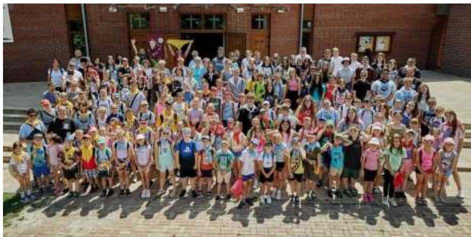
Kazincbarcikai nyári tábor

A hitnap keretében délelőtt templomi vetélkedő került lebonyolításra négy, illetve ötállomásos játékos vetélkedő keretében, melynek állomásai a Szent Család-templom, Avilai Szent Teréz-templom, református templom, görögkatolikus templom, Don Bosco Sportköz-