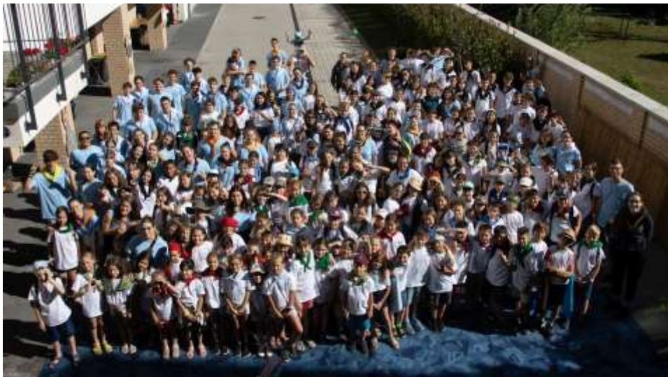
Óbudai Nyári Oratórium – első hét

Tekintettel arra, hogy Kazincbarcika nem csupán a szobrok és virágok városa, ha-