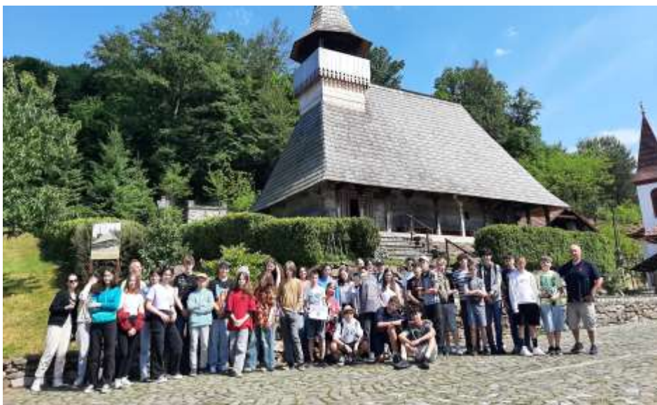
A „Határtalanul” program keretében a Péter-Pál iskola csapata Erdélyben járt

Olaszországi szakmai gyakorlat – Június 9-én a META Don Bosco Technikum és Szakgimnázium tízfős küldöttsége