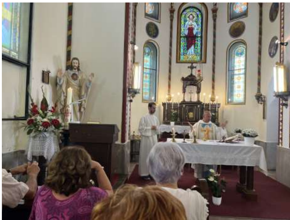
A Baross utcai templom búcsúja

lett Istenembert ünnepeljük, ahol különösen nagy hangsúlyt kap az Ő szeretete, amely egyszerre tükrözi az Atya és az emberek iránti szeretetét. Jézus lándzsától átszűrt szíve forrássá válik, az élet új folyójának forrásává. Minden kereszténynek és minden papnak Krisztusból kiindulva olyan forrássá kell válnia, amely életet áraszt másokra. Az élet vizét kell ajándékoznunk a szomjazó világnak. Életünk akkor lesz hasonló Jézus Krisztuséhoz, ha lelkeségünk és a mi szívünk is hasonlóvá válik az Övéhez. Nem csak beszélni kell a szeretetről, hanem cselekedni is kell. Minden kereszténynek élő szeretetté kell változnia. Egy mosoly mosolyhullám lesz, egy jó tett jócselekedetlánc lesz, egy csepp szeretet akár tengernyi szeretetté válhat. Hiszen a szeretet szeretetet szül.”