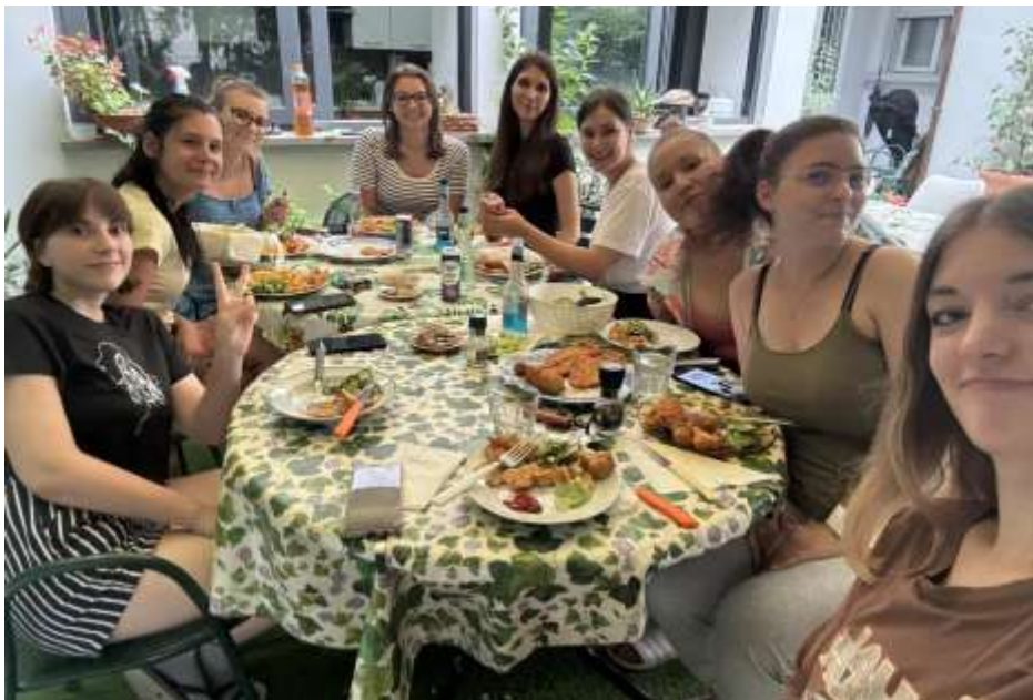
Metások olaszországi gyakorlaton