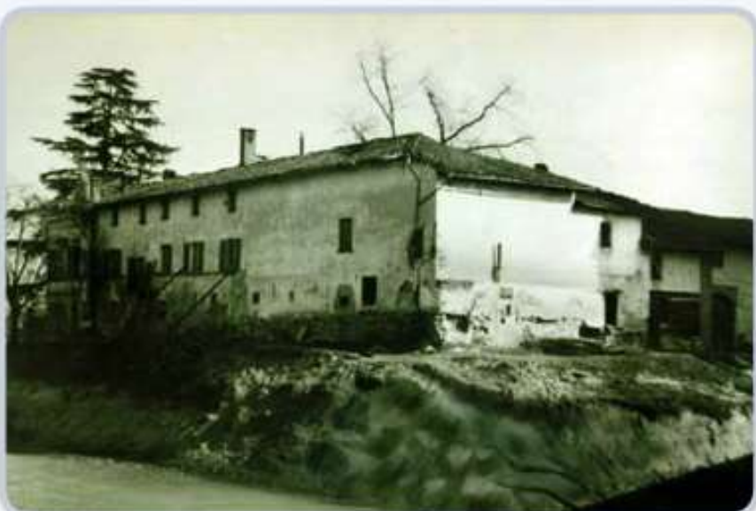
Don Bosco szülőháza a bontás előtt