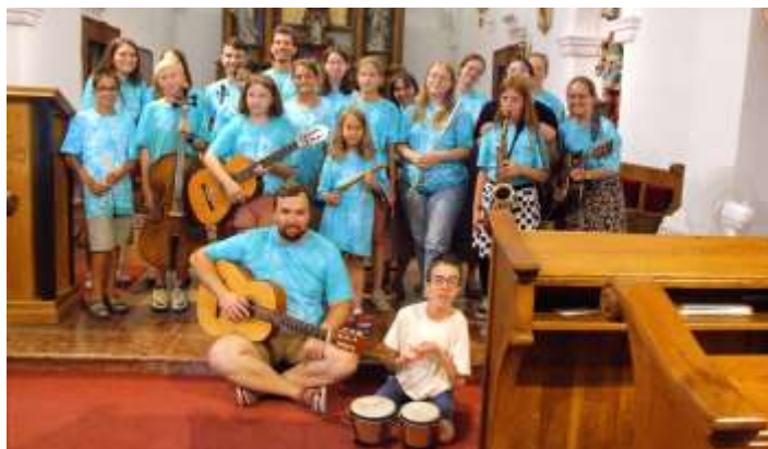
Az első Szalézi Mini Zenetábor résztvevői és szervezői

A programok tekintetében törekedtünk arra, hogy a gyerekek összekovacsolódjanak, így a kis létszámból (8 résztvevő) előnyt faragva sok olyan játékot játszottunk már az elejétől fogva, ahol össze kellett dolgozniuk. A csapat-összetartozást már az első napon megalapoztuk azzal, hogy közösen batikolva készítettük